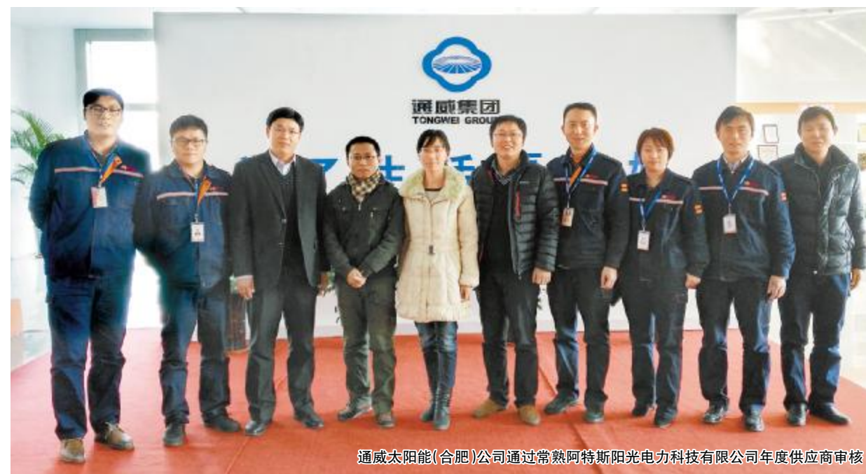
通威太阳能(合肥)公司通过常熟阿特斯阳光电力科技有限公司年度供应商审核

未来,双方也将各自凭借优势环节展开合作,优势互补,形成更大的产业空间,为行业创造更大的商业价值和经济效益。