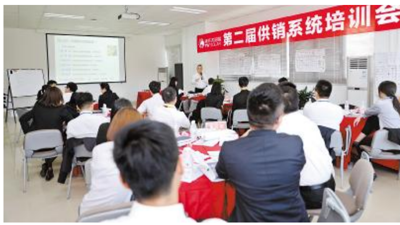
外训老师讲解项目型销售理念

此外,公司还强化培训效果考核,线上课程结束后,公司会给学员一定的消化时间,线下检验实际效果,比如模拟现实场景让销售把货卖给采购。杨总表示,今年人力资源部将开展包括新晋主管的培训、项目型销售等10多个培训项目,提升员工的综合素质。