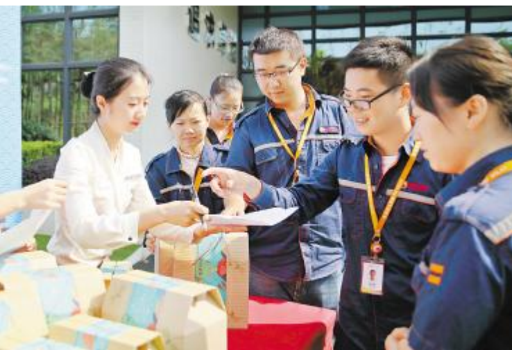
成都基地礼品派发现场

中,检查组现场对不符合安全生产要求的地方提出了整改意见,责令整改,不留安全死角,全力保障节日期间的安全生产工作。安全隐患排查和治理是一项长期而任重的工作,通威太阳能合肥、成都两地公司将会继续深化安全隐患排查治理,及时发现并排查人的不安全行为、物的不安全状态以及现场管理的不安全因素,确保公司以平安、祥和的安全生产环境迎接端午佳节的到来。