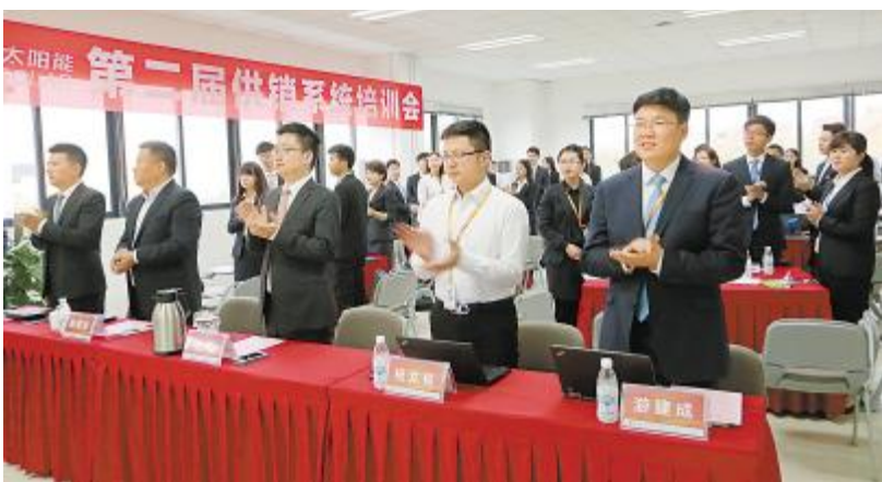
通威太阳能公司第二届供销系统培训会开幕

在培训中,通威太阳能公司时刻灌输优胜劣汰的理念,培训人数从去年的50多人减少到了近40人,只有表现最好、能力最强的员工,才有机会站上这个舞台,在所有高管、同事面前展示自己。