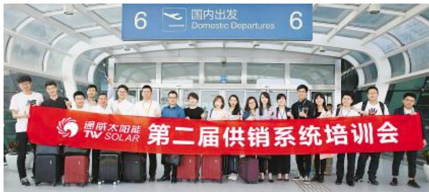
供销将士整装待发,踏上“回家”之旅

5月10日下午,合肥新桥国际机场来了一批特殊的客人。与往日在机场见到他们的场景不同,这次的飞行他们不再飞往全国各地拜访客户、供应商,而是一次“回家”之旅,目的地是通威集团总部所在地——成都。接下来的几日,他们将在通威太阳能(成都)有限公司进行为期3天的系统培训。