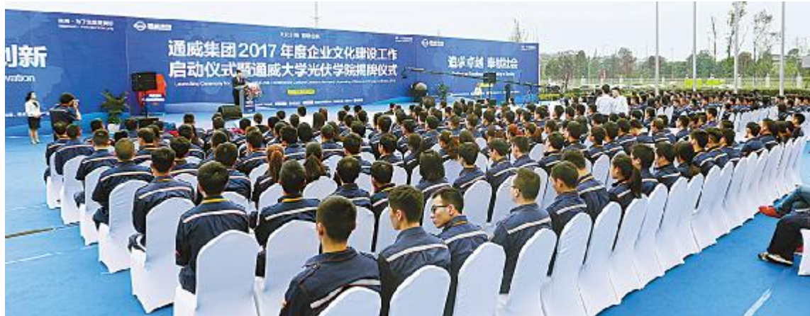
通威集团2017年度企业文化建设工作启动仪式暨通威大学光伏学院揭牌仪式现场