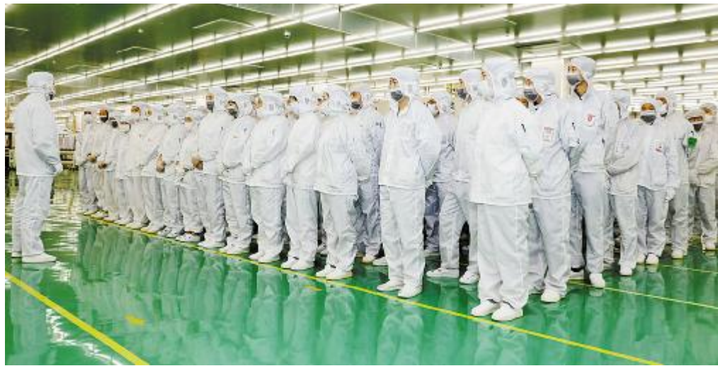
成都公司生产部2017年度首期“讲用汇谈”活动现场

2017年作为通威太阳能公司企业文化建设迈入2.0时代的开局之年,“讲用汇谈”活动的开展,不仅给员工提供了更深入地了解和学习通威企业文化的平台,而且加深了员工对企业文化重要性的理解。