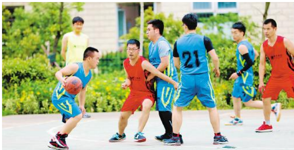
队员们在赛场上全力反攻

培训最后,企业文化宣传办公室还向参训员工发放了精心准备的新闻写作工具书,希望各位通讯员通过此次培训,拓宽写作思路和视野,增强对新闻写作的认识、理解和把握能力,促进通威太阳能公司整体新闻宣传工作水平的提升。