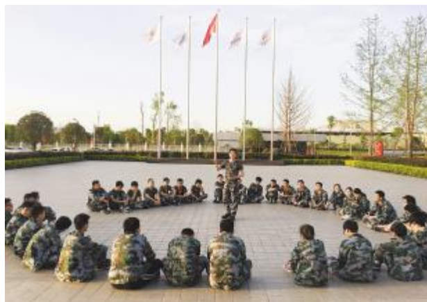
成都公司启航工程管培生开展军训拉练

沟通会结束后,学员们纷纷表示,轮岗培训期间大家全面了解了生产体系的内部运转与协作流程,为后期的定岗、定向培养打下坚实基础。学员们也深刻认识到做好每一件小事并不简单,应杜绝眼高手低,潜心学习、虚心请教,真正做到“用心工作,用智慧工作,用只争朝夕的精神工作”。