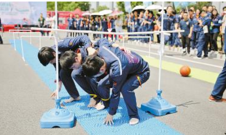
合肥基地“指压板接力赛”中“三人四足”跨越障碍赛段