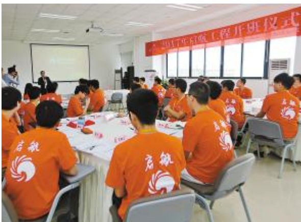
成都公司启航工程管培生培训项目开班仪式