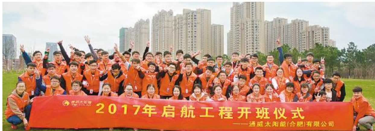
合肥公司2017年启航工程开班仪式学员合影留念