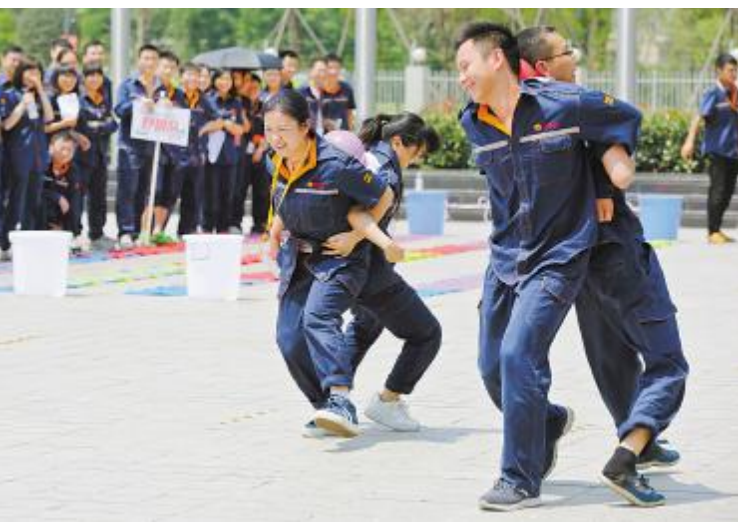
成都基地“齐头并进”项目