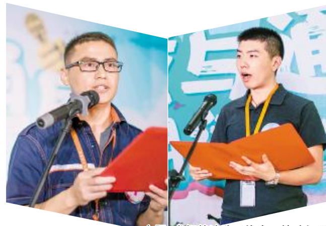
合肥、成都基地选手饱含深情地朗诵

经过选手们紧张而精彩的作品呈现以及评审组专业、严苛的综合评分,合肥、成都两地公司共6名选手脱颖而出,分别荣获通威太阳能合肥、成都两地公司2017“我与通威”朗读比赛一、二、三等奖。