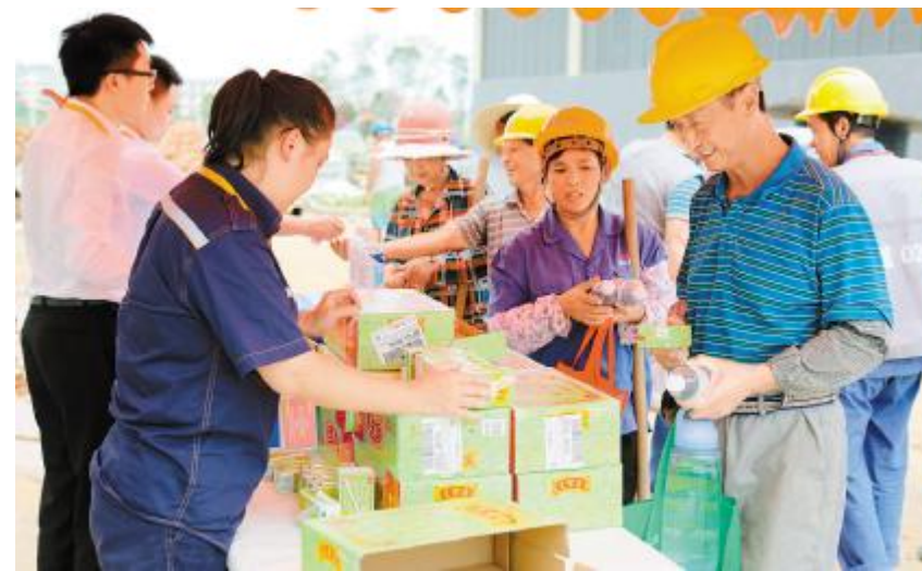
成都公司向外部驻厂工人发放清凉饮品

据了解,每年夏季高温天气,公司都会按照惯例组织“送清凉”活动,同时采取错峰施工避开高温时段,尽可能为广大户外工作者提供安全、健康的工作环境。此次活动极大地激发了员工们爱岗敬业的工作态度和顽强拼搏的精神,进一步增强了员工的凝聚力和向心力。