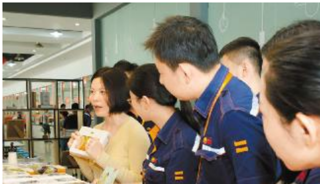
资深营养师现场为员工们一一解答

8月25日,在通威太阳能(成都)有限公司工会委员会的组织下,中秋月饼试吃活动在员工餐厅欢乐举办。当天下午三点整,公司近百名员工参与到此项活动中,品尝美味香甜的各式中秋月饼,为即将来临的中秋佳节增添了几分欢乐。