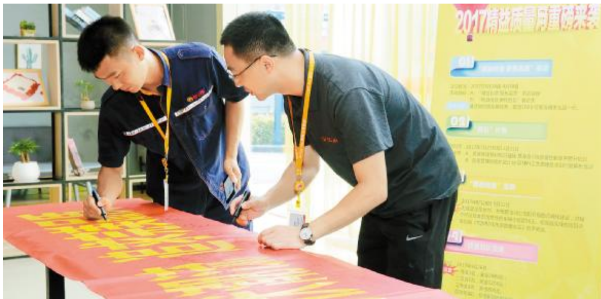
员工们纷纷在“质量月”活动横幅上签字

自投产以来始终坚持“追求卓越”的企业宗旨,始终秉承“质量立企、质量兴企、质量强企”的质量方针,围绕企业的经营战略、方针目标和现场存在