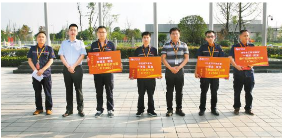
谢毅董事长与成都公司2017年首届TQM改善项目表彰大会获奖项目负责人合影留念

经过5个多月的不懈努力,2017年(第一期)TQM改善项目圆满结束,顺利完成了4个项目改善,经财务核定测算,4个项目的年收益达685.4万元,季度收益合计高达171.3万元。