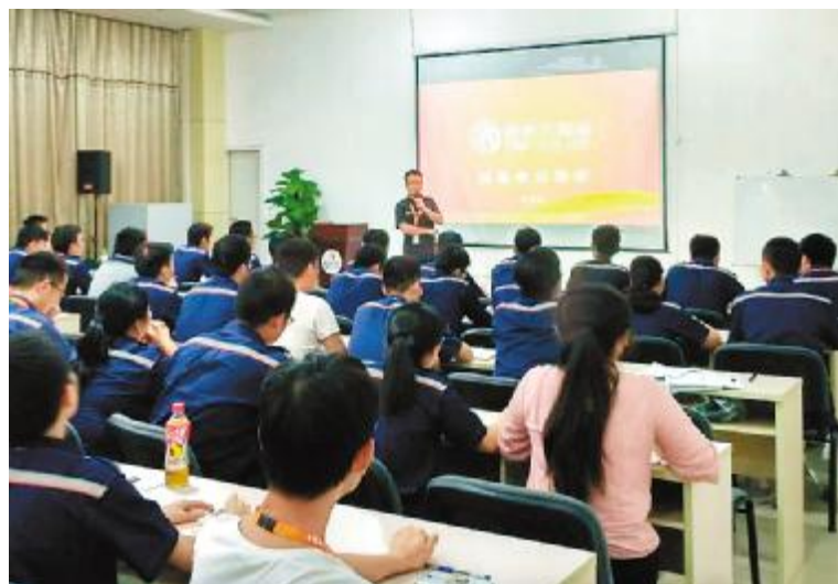
通威太阳能(合肥)有限公司质量意识提升培训现场

据悉,本次培训是公司质量专题培训的首场培训,标志着质量专题培训活动的正式启动。专题培训将从质量意识提升培训、质量关键控制点培训(在线监控点及客户反馈)和质量工具培训三方面开展,以小班模式对各分厂班组长、技术员、专员、助理工程师、工程师、主管等共计357人进行专题化、系统化培训。