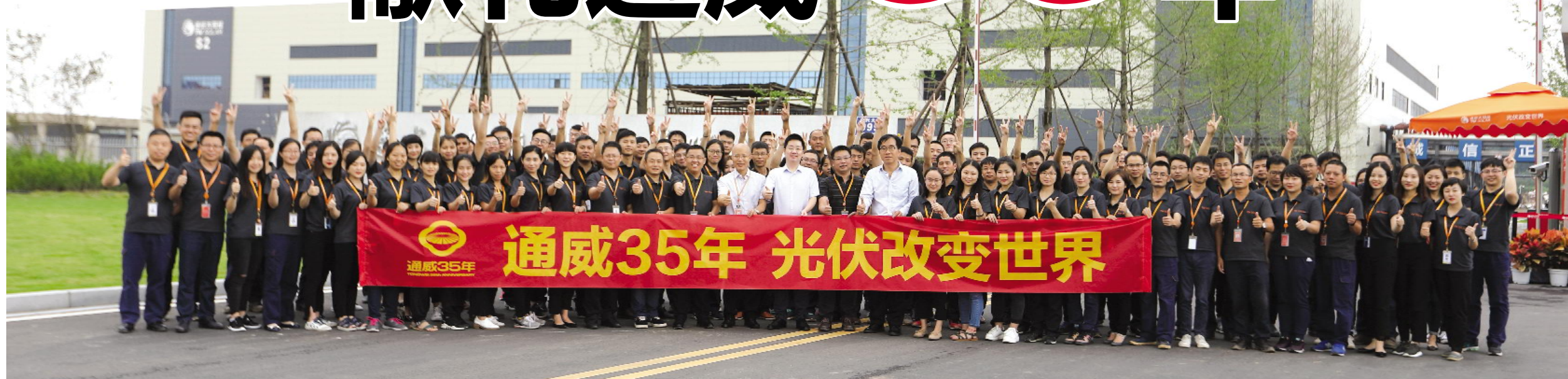
通威太阳能公司热烈祝贺通威 35 年华诞

本报讯(记者 唐胜)截至 2017 年 8 月底,通威太阳能公司捷报频传,取得了连续 35 个月持续盈利的佳绩,此时,恰逢通威迎来 35 年华诞。通威太阳能公司在创造光伏行业新纪录的同时,向通威 35 年庆隆重献礼。