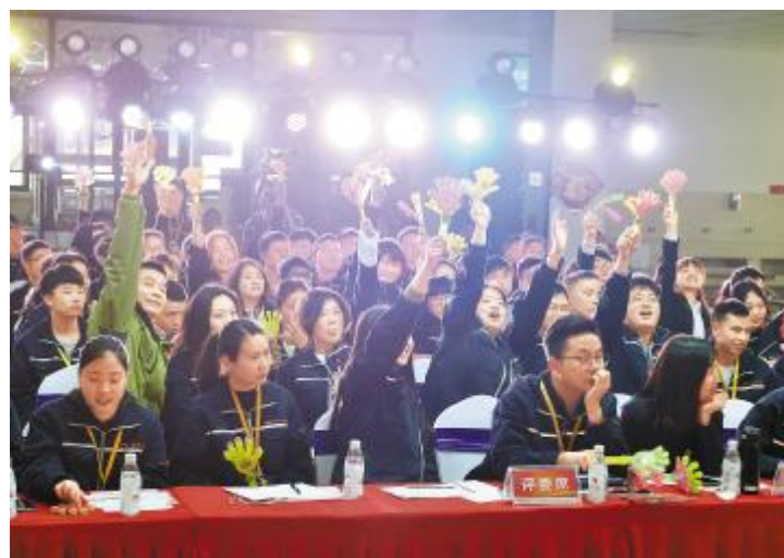
成都公司决赛现场