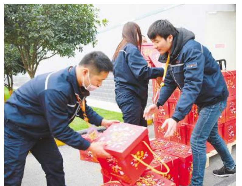
工作人员发放春节大礼包

2017年,公司开展的一系列节日慰问让员工真切地感受到通威大家庭的温暖,在这样殷切的关怀之下,大家都觉得动力十足。2018年,全体员工将带着这份关怀与祝福,戮力同心,共创佳绩!