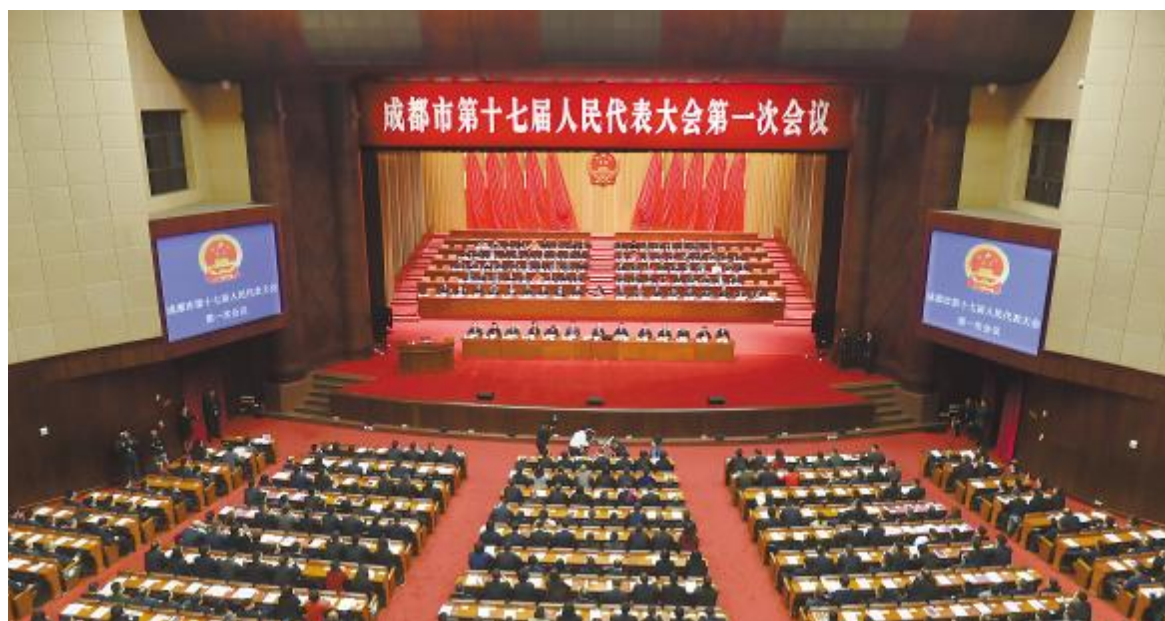
2月25日,成都市第十七届人民代表大会第一次会议开幕

除此之外,成都市政府也将通威太阳能列入由四川省委常委、成都市委书记范锐平担任顾问,成都市市长罗强担任编纂委员会主任委员的2017年卷《成都年鉴》。2017年卷《成都年鉴》全面系统地记载了成都年度自然、政治、经济、文化、社会等方面的基本情况、发展变化及大事要闻。作为成都市重点项目,年鉴中详细介绍了通威太阳能项目进度、产能规模等情况。