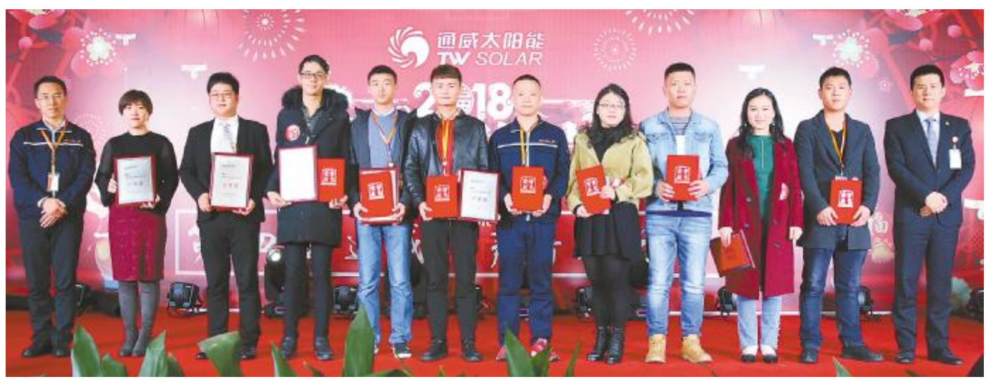
合肥公司参赛选手合影