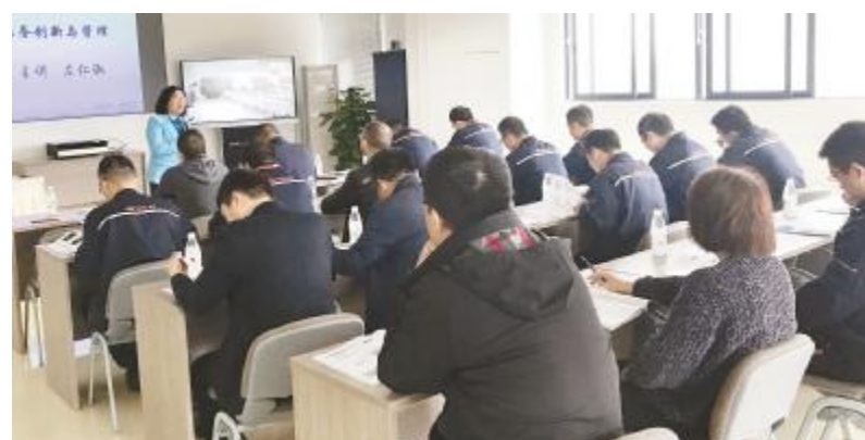
中高管MBA研修班上学员们聚精会神听讲

在第一天《企业运营信息管理》授课中，侯伦教授围绕信息化产业、信息技术演进和展望、信息化创新、信息化管理等方面展开了详细的讲解，在第二天《服务创新与管理》课堂上，左仁淑教授从服务全视觉认识、服务创新思维、服务管理方法等维度