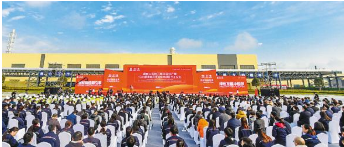
通威太阳能三期项目投产暨 1GW 超高效异质结电池项目开工仪式现场

11月18日,通威太阳能三期项目投产暨 1GW 超高效异质结电池项目开工仪式在成都市双流区隆重举行。此次投产的三期项目规模是一期、二期规模总和,实际建设周期仅用了 6 个半月时间,再一次刷新了“成都速度”、“中国速度”、“全球速度”。作为目前全球光伏行业工艺技术、生产设备以及自动化、智能化程度都领先的单体规模最大的高效晶硅太阳能电池项目,三期项目将成为全球光伏行业智能化工厂、数字化车间的样板工程!