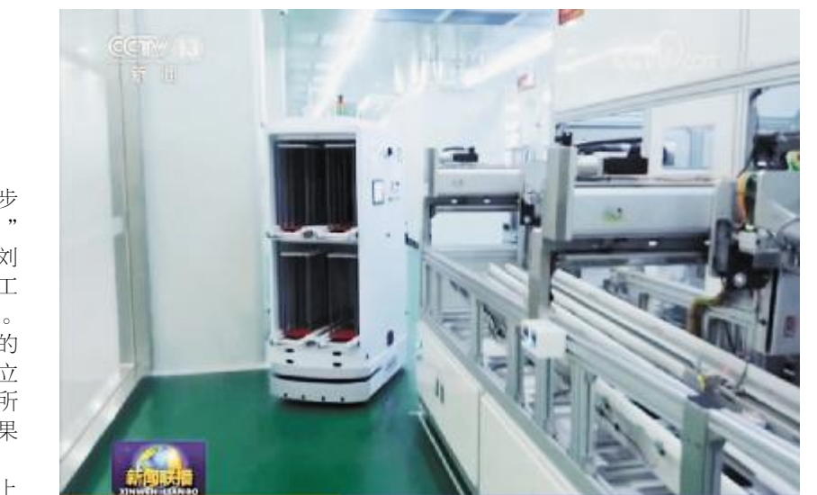
央视《新闻联播》报道通威太阳能画面

调配下,机器人麻利地载着产品在生产线、装配线之间穿行……这是位于双流区西航港经济开发区,日前刚刚投产的通威太阳能三期项目生产车间上演的场景。