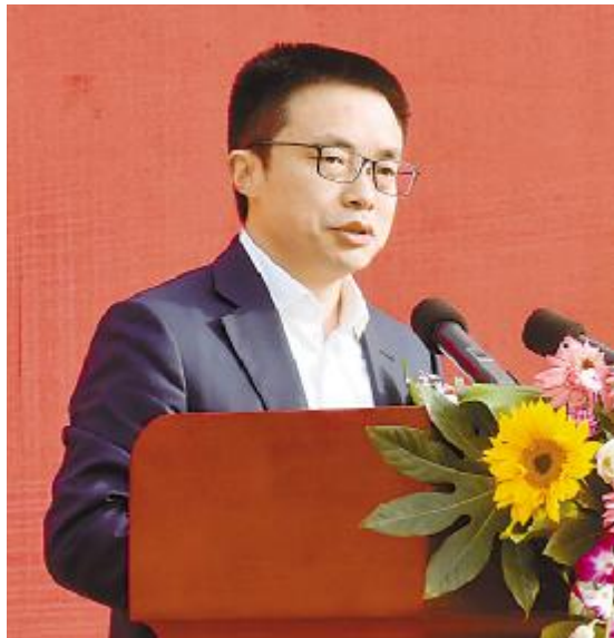
双流区委副书记、区长鲜荣生致辞