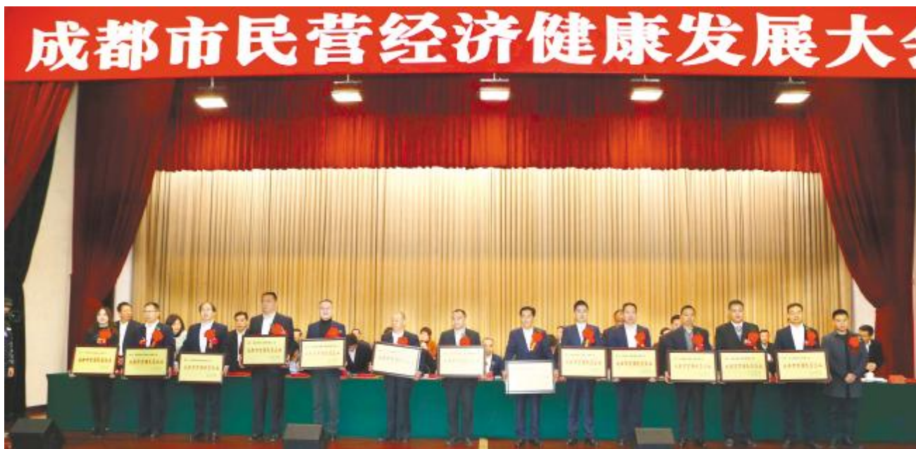
通威太阳能董事长谢毅上台领奖