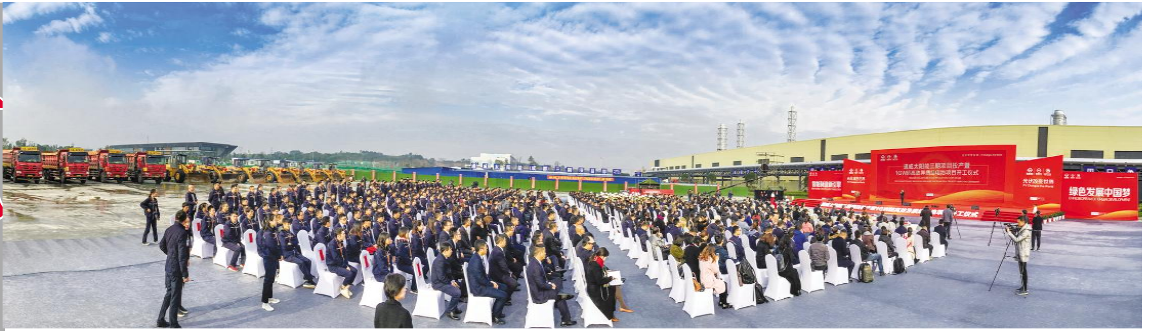
项目投产仪式现场

11月18日,通威太阳能三期项目投产暨1GW超高效异质结电池项目开工仪式在成都市双流区隆重举行。四川省委统战部副部长、四川省工商联党组书记、常务副主席陈泉,成都市人民政府副市长曹俊杰,双流区委书记韩轶,双流区委副书记、区长鲜荣生,十一届全国政协常委、全国人大代表、通威集团董事长刘汉元,通威集团总裁、通威股份独立董事、通威股份副董事长严虎,通威股份总裁郭异忠,通威太阳能董事长谢毅等领导,行业合作伙伴、金融证券机构、主流媒体及通威太阳能合肥、成都两地公司主要管理班子和员工代表近500人见证了这一重大时刻。