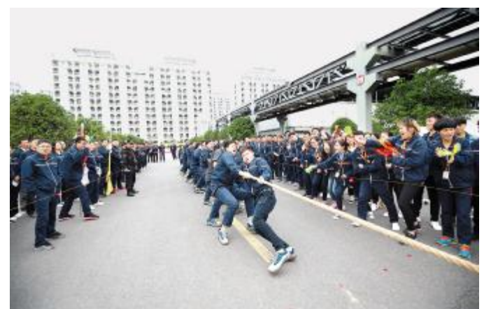
拔河比赛中，队员们奋力拼搏

参与性高、趣味性强、拔河比赛作为通威太阳能企业文化建设和周年活动有机结合的重要载体，不仅丰富了员工的文化生活，展现了员工饱满的精神风貌，更有利于增强各部门员工间的凝聚力和向心力，通威太阳能员工们团结一心，奋勇争先的比赛精神也将继续助推通威太阳能在未来的发展中百尺竿头更进一步！