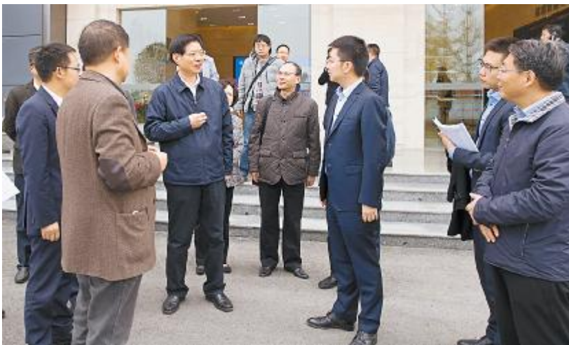
崔保华副主席调研通威太阳能,详细询问公司发展情况