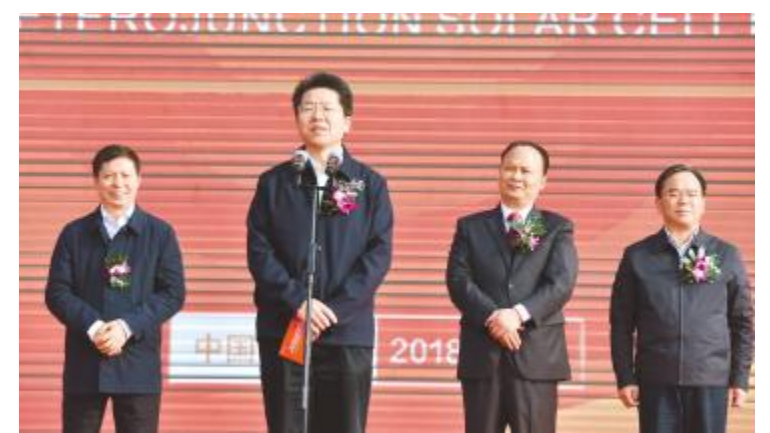
曹俊杰副市长宣布通威太阳能三期项目投产暨1GW超高效异质结电池项目开工

刘汉元主席特别感谢了省、市、区各级政府多年来的关心、支持与帮助,8月17日,四川省委彭清华书记在调研乐山永祥股份时提出以绿色电力支持战略性新兴产业发展,国庆节后彭清华书记还听取了光伏产业发展的专题汇报。