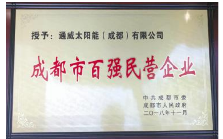
通威太阳能成都公司获成都市百强民营企业殊荣

该榜单是成都市政府多个经济主管部门共同评定、联合发布的，受到了企业界、经济界及其他社会各界的广泛关注和肯定，彰显出成都市着力培育大企业大集团所取得的突出成效，以及这些企业成为成都市经济社会发展的强力支撑和动力源泉。