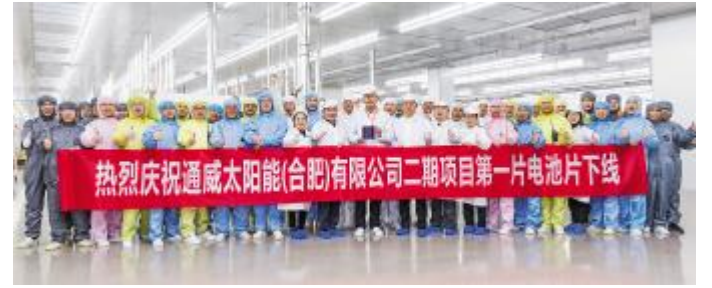
通威太阳能合肥二期项目第一片电池片顺利下线合影留念

本报讯(通讯员 叶婷婷)11月28日,通威太阳能合肥二期高效晶硅太阳能电池项目 A1 车间迎来了振奋人心的时刻,通威太阳能合肥二期第一片“智能制造”电池片顺利下线。