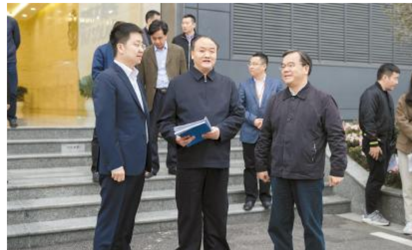
李仲彬主席调研通威太阳能,深入了解公司智能制造发展成果