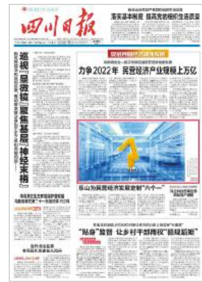
《四川日报》头版聚焦通威太阳能

近年来,由于全球环境和资源压力剧增,中国经济已逐渐从高污染、高耗能模式,向绿色、可持续发展方式快速创新转型。作为习近平总书记亲自倡导的“五大发展”理念之一,绿色发展也早已成为了中国政府和全社会的高度共识。此次媒体高频次的报道,再次彰显了通威作为我国绿色农业和绿色能源的全球龙头企业,长期秉承和践行的绿色发展战略和可持续发展理念,高度契合了我国绿色发展和经济转型升级战略。未来,通威必将提升我国光伏智能制造水平、推动我国乃至全球能源转型升级,为人类可持续发展作出更大贡献!