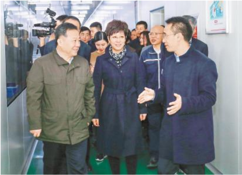
宋国权书记、凌云市长一行调研合肥公司 P5 高效晶硅电池生产车间

本报讯(通讯员 叶莉莉)11月29日,为深入贯彻落实习近平总书记在民营企业座谈会上的重要讲话精神以及安徽省促进民营经济发展大会精神,深入了解民营企业发展情况,安徽省委常委、合肥市委书记宋国权,市委副书记、市长凌云,市委常委、秘书长韦心,市政府副市长王文松一行莅临通威太阳能合肥公司调研。通威太阳能合肥公司总经理谢泰宏及公司中高管团队热情接待并陪同参观。