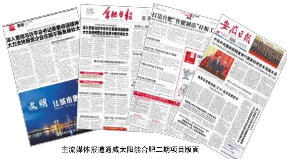
主流媒体报道通威太阳能合肥二期项目版面

1月8日,安徽卫视《新闻联播》播出安徽省委书记李锦斌与刘汉元主席座谈专题报道。1月9日,《安徽日报》在头版推出题为《李锦斌与刘汉元座谈时指出 深入贯彻习近平总书记重要讲话精神 大力支持民营企业在皖不断发展壮大》报道,并指出,支持民营企业在皖不断发展壮大是党委、政府义不容辞的责任。安徽将坚定不移贯彻习近平总书记中央经济工作会议、民营企业座谈会上的重要讲话精神,积极解决融资难融资贵问题,真正把支持政策落实好。刘汉元主席表示,习近平总书记在民营企业座谈会上的重要讲话,给广大民营企业企业家吃下了定心丸。安徽发展潜力巨大,通威集团将继续加大高效晶硅电池、光伏发电、“渔光一体”等项目推进力度,为安徽生态文明建设、经济高质量发展贡献力量。1月10日,《合肥日报》、《合肥晚报》、《江淮晨报》也纷纷