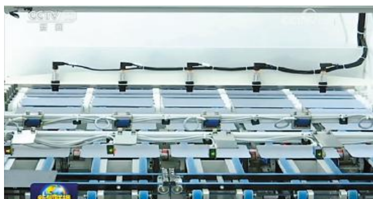
2018 年 11 月 21 日,通威太阳能作为四川优秀民营企业代表,三期项目再获央视《新闻联播》聚焦