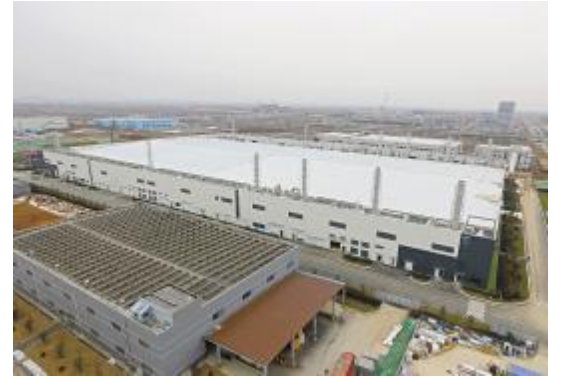
2019年1月8日,通威太阳能合肥二期项目主体工程建设完工