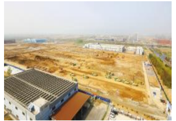
2018年4月2日,建设中的通威太阳能合肥二期项目