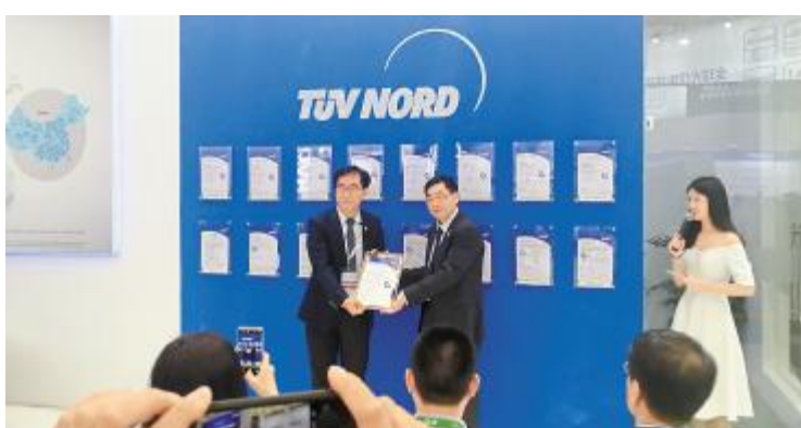
2018 年 5 月 28 日,通威太阳能获全场首张叠瓦新标准认证证书