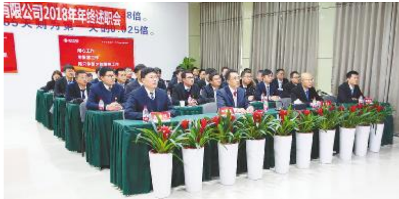
合肥公司述职大会现场