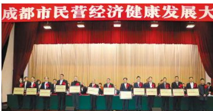
2018 年 11 月 24 日,成都市民营经济健康发展大会隆重召开,通威太阳能成都公司荣获“成都市百强民营企业”荣誉称号