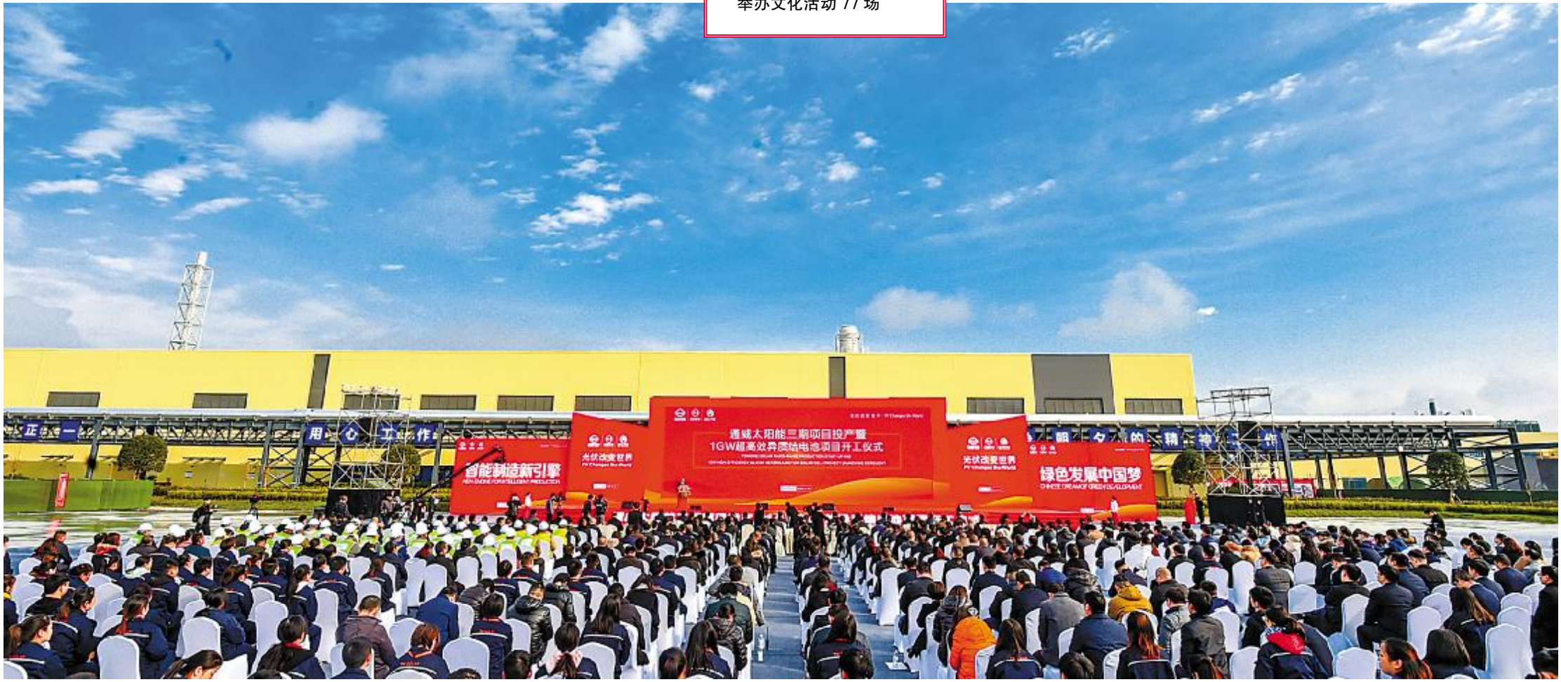
2018 年 11 月 18 日,通威太阳能三期项目投产暨 1GW 超高效异质结电池项目开工仪式隆重举行

2018 年,通威太阳能迎来成立 5 周年,5 年时间,公司在全球光伏行业一骑绝尘,成为全球光伏行业领军企业、全球最大晶硅电池企业;成为中国制造业企业典范、全球光伏企业标杆。历经市场检验,通威太阳能风华正茂、青春向阳、一路向前!