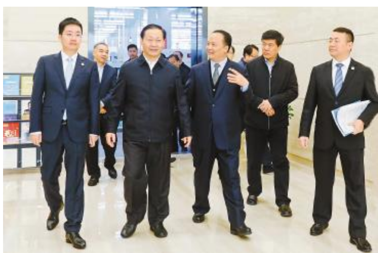
2018 年 11 月 14 日,四川省委书记彭清华调研通威太阳能成都公司