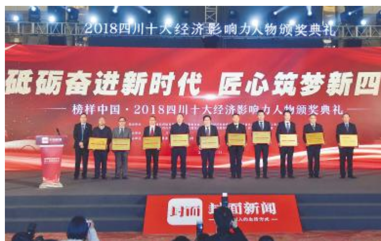
通威太阳能成都三期项目投产入选“2018四川十大经济影响力事件”

通威太阳能也将积极推动制造业转型升级,大力推进数字经济发展,充分发挥试点企业典型引领作用,构建全面管控体系,推进管控落地,提升运营效率,提高产品质量的可追溯性。