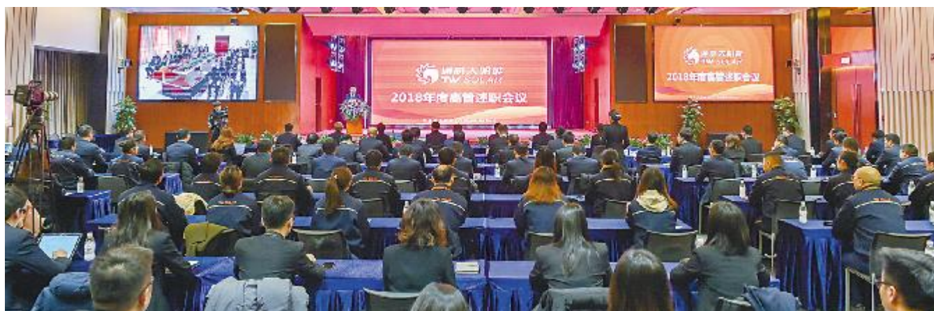
通威太阳能 2018 年度高管述职会议现场

会议由集团人力资源部部长杨继成主持。通威太阳能副总经理周华、副总经理张忠文、首席财务官周丹、成都基地总经理萧圣义、合肥基地总经理谢泰宏分别汇报了各自分管体系2018工作总结及2019年目标计划。