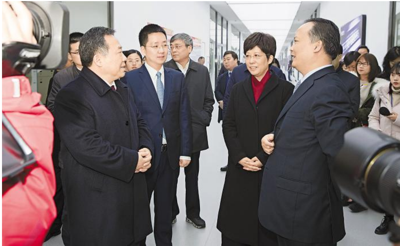
安徽省委常委、合肥市委书记宋国权,合肥市委副书记、市长凌云调研通威太阳能合肥二期项目

2019年1月8日,新年伊始,万象更新。中国光伏产业发展再传捷报,通威太阳能合肥二期2.3GW高效晶硅电池项目主体工程已全部完成,项目正式进入“投产倒计时”。2019年,通威太阳能再开工8GW高效晶硅电池项目,进一步巩固全球晶硅电池企业龙头地位。