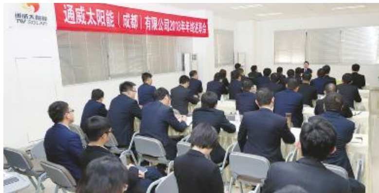
成都公司述职大会现场

本报讯(通讯员 雍宗虹)1月9日、11日,通威太阳能2018年度述职大会暨2018年度总结大会分别于合肥、成都两地公司顺利召开,通威太阳能董事长谢毅及高管团队现场出席两地会议。