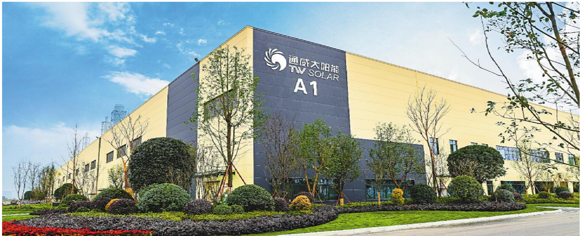
通威太阳能成都三期A1车间