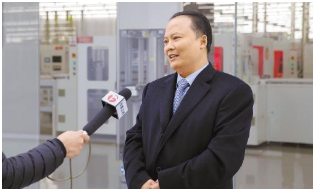
安徽卫视《新闻联播》专访刘汉元主席

通威太阳能在成都、合肥两大晶硅电池生产基地,目前产能总规模超过13GW,已成为全球最大的晶硅电池生产企业。