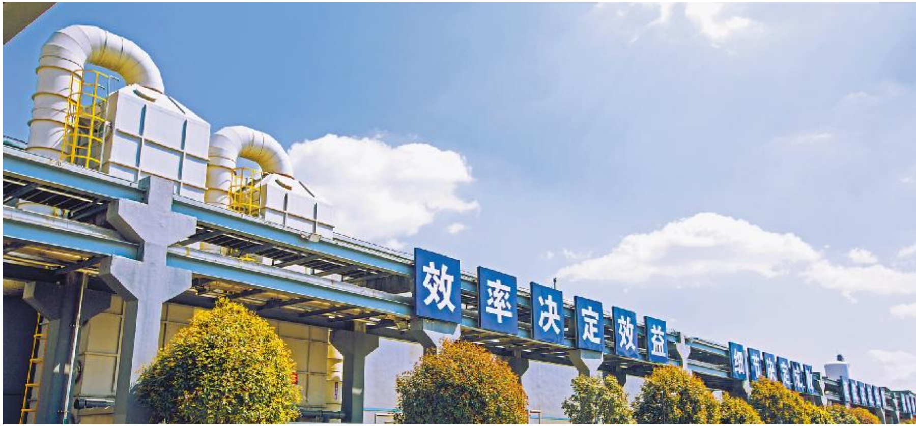
蓝天白云下通威太阳能合肥公司厂区

“胜日寻芳泗水滨,无边光景一时新。等闲识得东风面,万紫千红总是春。”四月,正是春意盎然的时节,走进通威太阳能合肥、成都基地厂区,红色、白色、粉色的花朵,绿色的草地,一眼望去就是一片花的海洋,这里不是公园,这里是通威太阳能的“花园式工厂”。