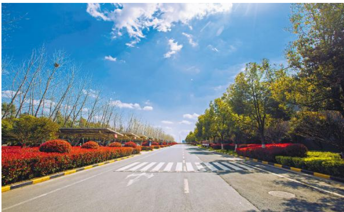
通威太阳能合肥公司厂区郁郁葱葱,在这里,每一片树叶都充满了精气神,每一名员工都用奋斗诠释着青春的姿态

此次祭扫活动的举办,深切地缅怀了革命先烈,重温了爱国主义精神,强化了党支部的凝聚力。全体党员表示要以革命先烈为榜样,强化担当意识,增强责任感和使命感,争当先锋模范,为公司的持续发展拼搏奉献,为新时代新征程奋斗终身!