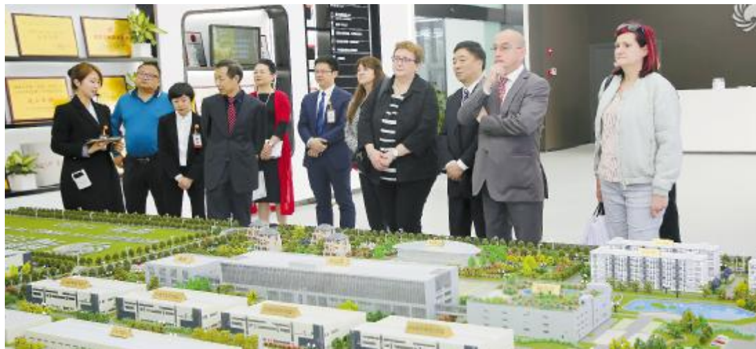
奥地利生产工会联邦副主席克劳迪亚·弗立本女士一行参观通威太阳能

参观结束后,克劳迪亚·弗立本女士一行对通威太阳能的生产环境、员工权益保障、企业文化建设等方面给予了高度评价,并期待未来能有更深层次的交流。