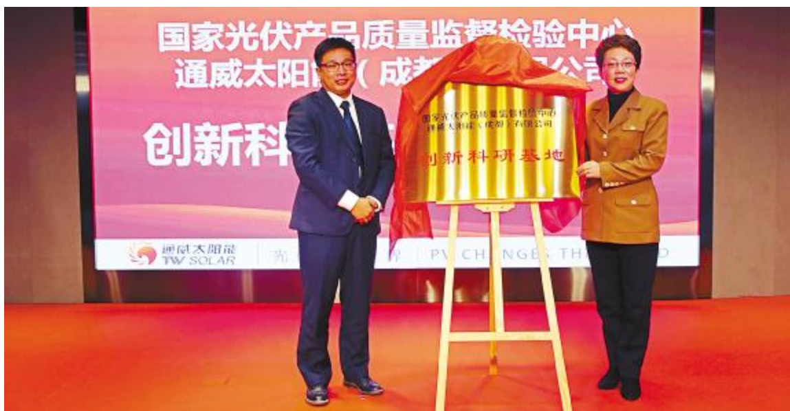
“创新科研基地”揭牌仪式现场

成都市政府确定的“共管、共建、共管、共享”和“新机构、新体制、新机制、公司化运作”标准建立,是四川省产品质量监督检验检疫院、成都市产品质量监督检验检疫院整合组建的专业提供产品质量检验、检测及质量技术咨询服务的法人实体机构,由四川省市场监督管理局与成都市市场监督管理局共同管理。“创新科研基地”的成立,是公司顺应时代发展需要,创新发展理念的体现,也是成都国检与通威太阳能深入合作的良好开端。深化合作,借鉴学习成都国检科学化、标准化的工作方法,未来通威太阳能将创造出更丰硕的成果。