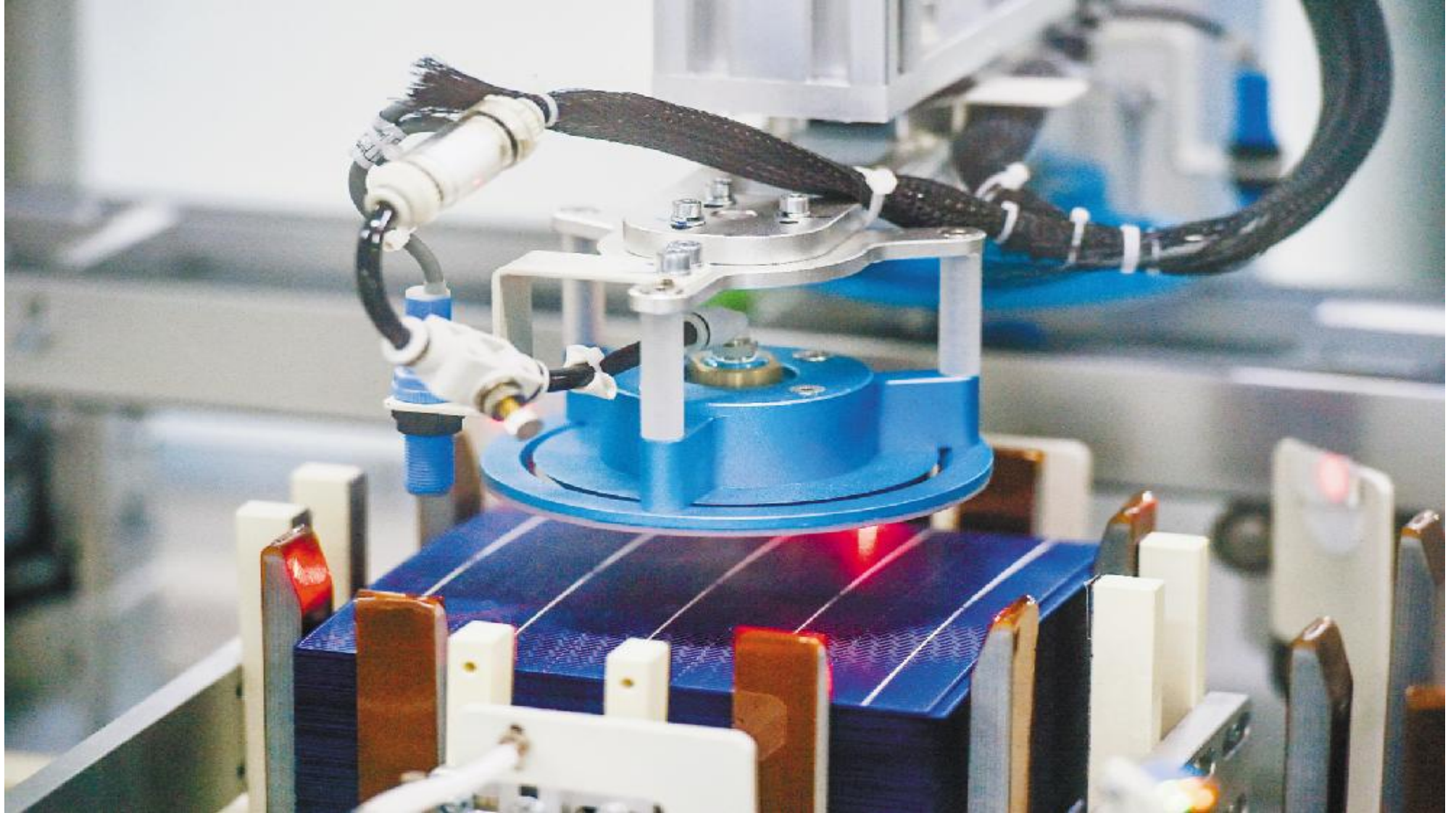
通威太阳能智能制造生产线

作为全球太阳能晶硅电池生产的龙头企业,通威太阳能高度重视技术的创新与研发,推动产业链整体成本持续下降,强化与科研院所合作,积极打造创新研发高地,同时不断优化电池片工艺及制成,率先在行业打造晶硅电池无人生产车间,引领行业的创新与进步。