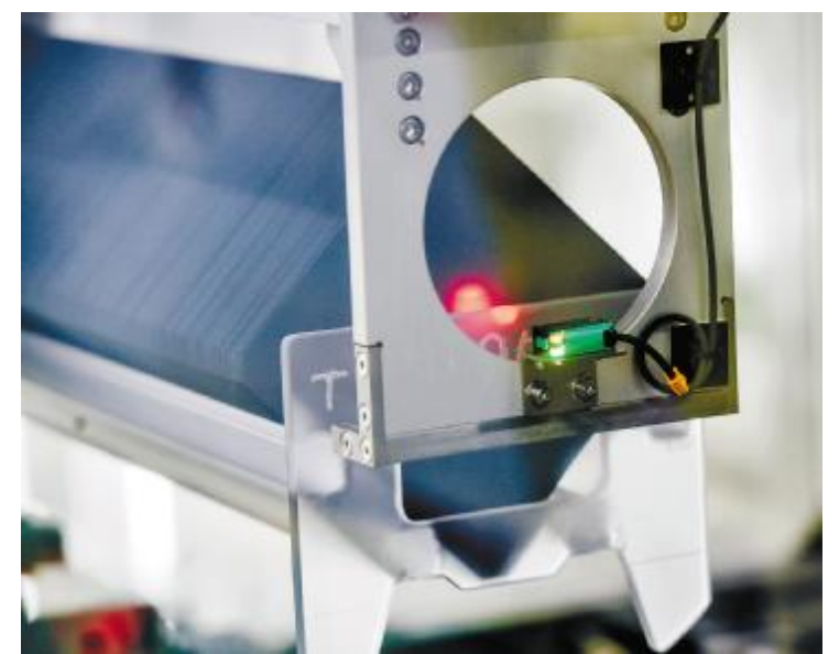
通威太阳能智能制造生产线扩散工序

目前通威太阳能已经形成13GW电池片产能,一直以来,通威始终专注于太阳能电池的效率与可靠性提升,并对技术投入力度不断加强,去年,其自主研发的高效组件两次打破光伏组件功率和效率的世界纪录;同时,公司还积极打造智能制造生产线,率先在行业打造光伏晶硅电池无人生产车间,进一步提升产品质量和生产效率,真正成为行业的创新者和引领者。