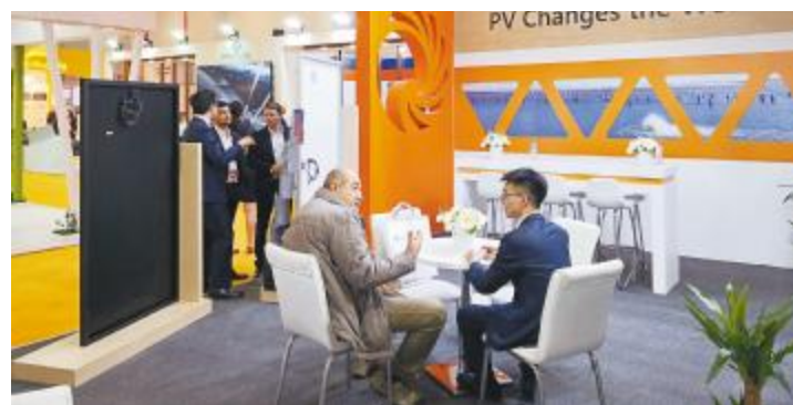
2019年土耳其国际太阳能新能源展,通威太阳能商务人员与观展嘉宾交流

通威太阳能多年来积极拓展海外市场,始终从效率及成本两大层面提升产品在海外市场的竞争力。借助一次次的参展,通威太阳能进一步拓展了海外市场的品牌影响力和知名度,也加深了对海外市场的了解,在光伏产业日益发展的今天,通威太阳能也必将为全球客户提供更多更好的产品与服务!