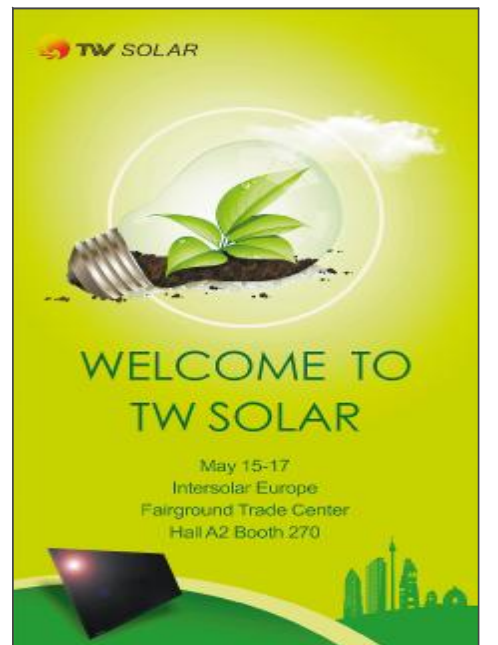
5月15日,通威太阳能将携高效展品精彩亮相德国 Intersolar 展