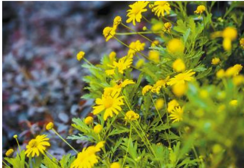
通威太阳能成都公司厂区,百花齐放,处处皆绿意,步步皆美景