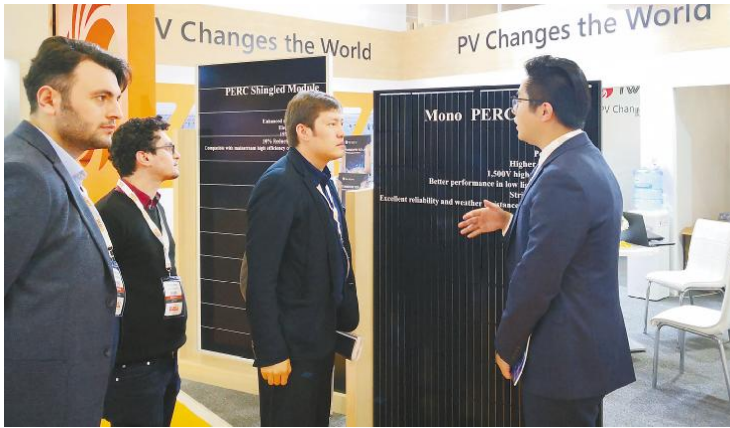
2019年土耳其国际太阳能新能源展,通威太阳能商务人员向嘉宾介绍公司产品

■ 《四川日报》点赞通威太阳能眉山项目:从签约到开工,仅用两个月,成为通威集团国内“接触最晚、上马最早、速度最快”的太阳能项目。