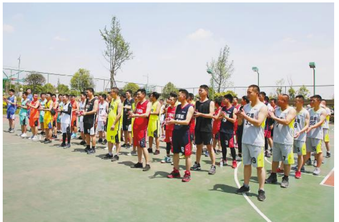
成都基地开幕式现场