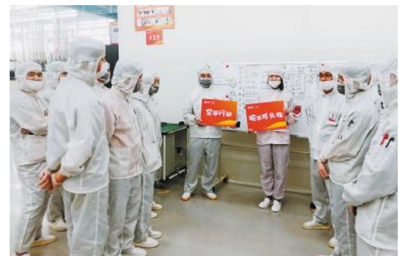
员工积极响应“空手行动”