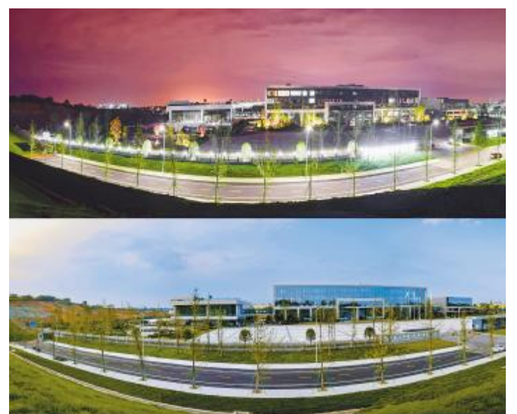
通威太阳能的昼与夜