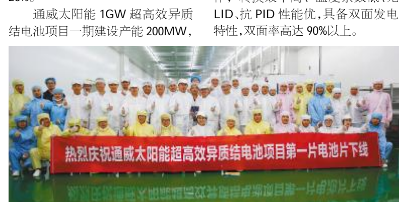
通威太阳能超高效异质结电池项目第一片电池片顺利下线

自2018年11月18日启动以来,短短7个月,就完成了从启动仪式到设备安装调试等一系列繁琐复杂的筹备工作,全车间采用智能制造自动化生产线。本次成功下线的超高效异质结电池片采用低温工艺制作,转换效率高、温度系数低、无LID、抗PID性能优,具备双面发电特性,双面率高达90%以上。