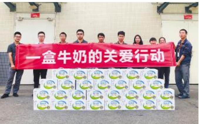
通威太阳能开展“一盒牛奶”职工关爱活动