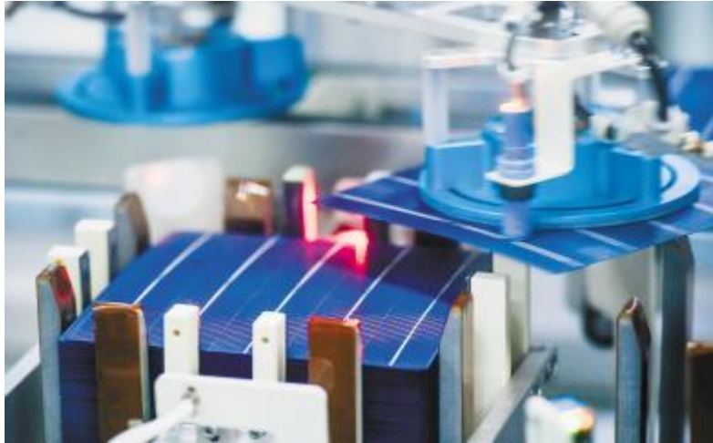
通威太阳能智能制造生产线

根据PV InfoLink统计,2018年,通威连续第三年居电池片出货第一,爱旭与展宇并列第二。从产业链全局来分析,2018年可说是电池片势力的重要转折点,通威等电池片大厂挟规模以及新产能的成本优势,纷纷冲出了超过4GW的出货,尤其通威总出货量超过6.5GW,遥遥领先其他电池厂。PV InfoLink预期此三家电池厂在2019年也将稳居电池片出货前三