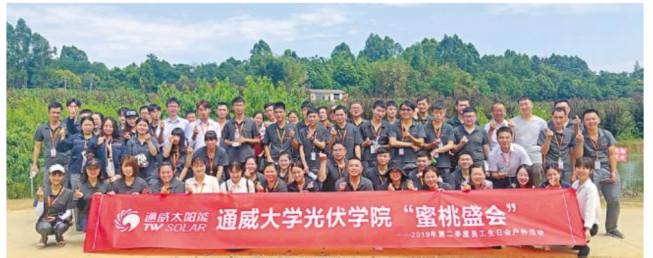
成都公司生日会合影留念

整个桃园。采摘结束后,寿星员工们一同围坐在草坪上,品尝新鲜的蜜桃,共唱生日快乐歌,互送生日祝福语。最后,聚焦的镜头留下了本次生日会寿星员工们的身影,也为本次生日会划下了圆满的句号。镜头上寿星们欢快的笑脸,正是公司构筑一个充满关爱的通威大家庭的温馨画面。2019年光伏学院将持续致力于打造特色员工活动,营造自信、阳光的工作氛围,激发员工热爱企业、投身企业发展的激情,形成良好的企业向心力和凝聚力。