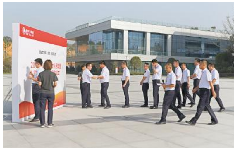
通威太阳能 2019 年企业安全文化暨“安全生产月”启动仪式现场

此次演练在公司H2危险化学库进行, 主要针对氨气泄漏、人员撤离、现场处置、应急救援及请求政府支援等应急流程进行。通过安全演练活动的开展, 检验了公司应急救援队伍对应急响应程序的熟悉程度, 测试应急救援预案可实施性、应急培训的有效性、应急救援人员可操作性, 提高了与事故应急相关部门的协作能力, 为通威太阳能安全、稳定、高效发展奠定了坚实基础。