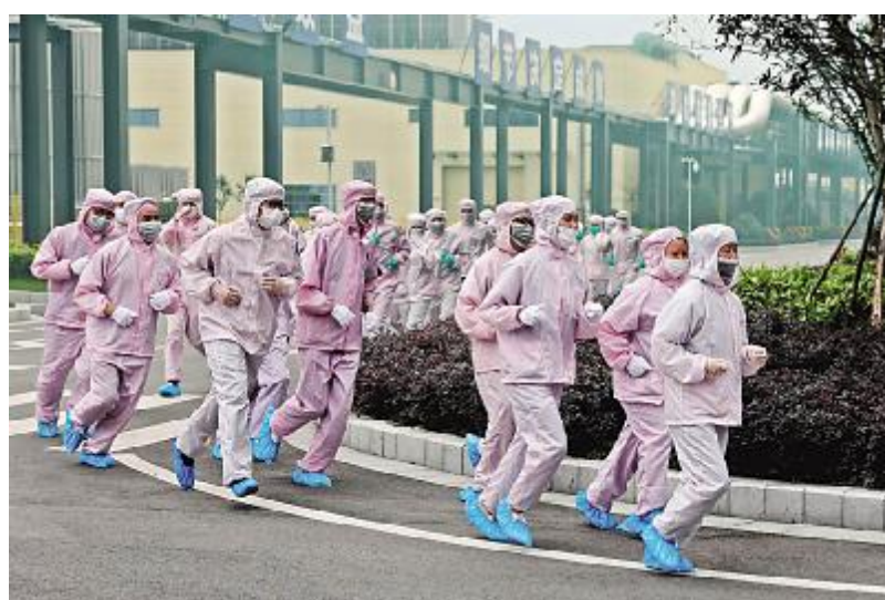
成都公司应急演练疏散现场