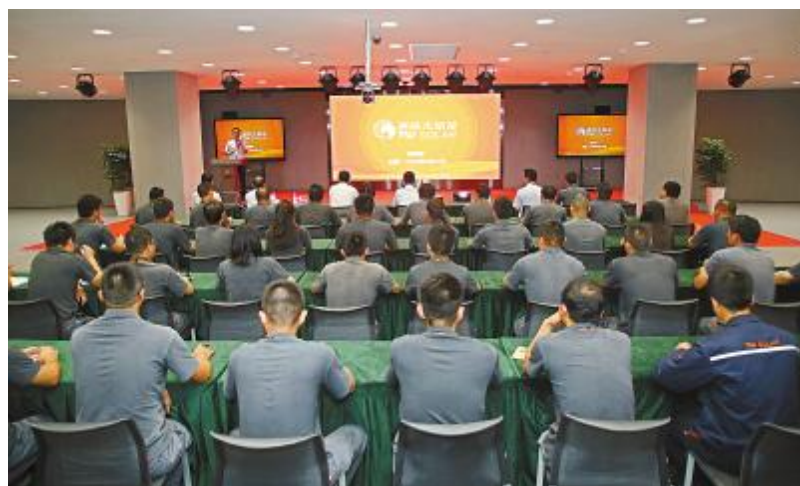
“我的工作, 我负责”安全生产管理专题会议现场