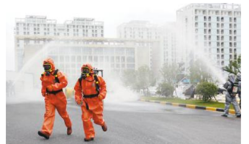
合肥公司应急救援演练现场

安全意识要深入骨髓。只有让安全文化深入人心, 才能从根本上消除安全隐患, 降低事故发生率, 真正做到防风险, 除隐患, 遏事故。此次活动的推行, 进一步强化了安全红线不可逾越, 保障安全, 尊重生命的意识!