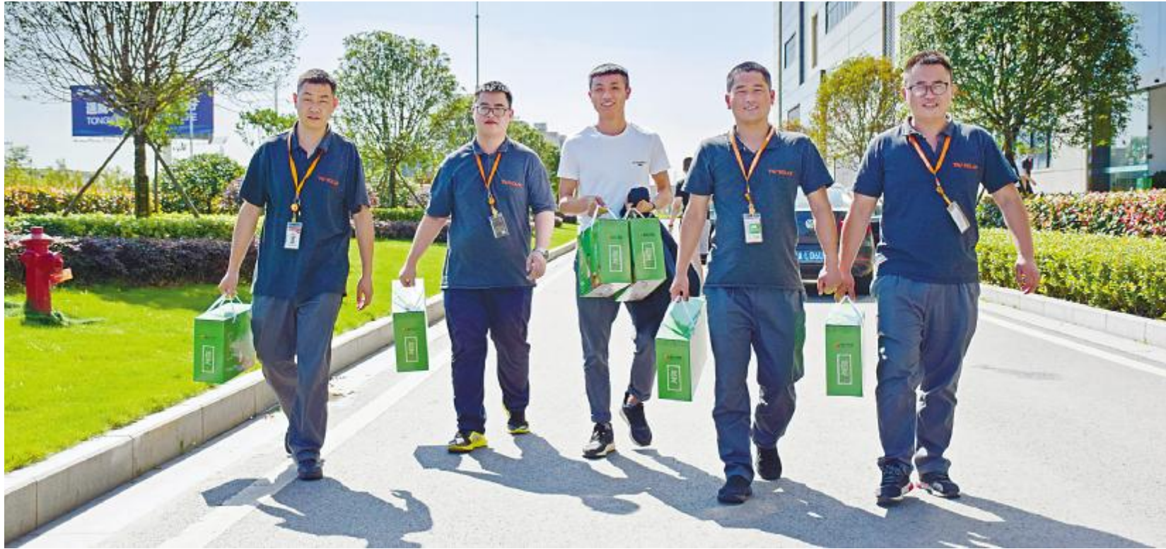
成都公司员工兴高采烈领取端午节礼品

小长假期间,两地员工餐厅还准备了精美的节日菜品以及特别的加餐福利,免费粽子等特色小食让员工在辛勤工作的同时,度过一个温暖、祥和的传统佳节。