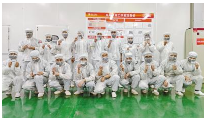
“安全环保十大禁令”推行活动现场