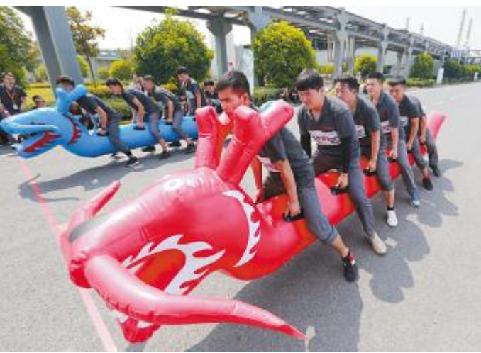
合肥公司旱地龙舟比赛现场