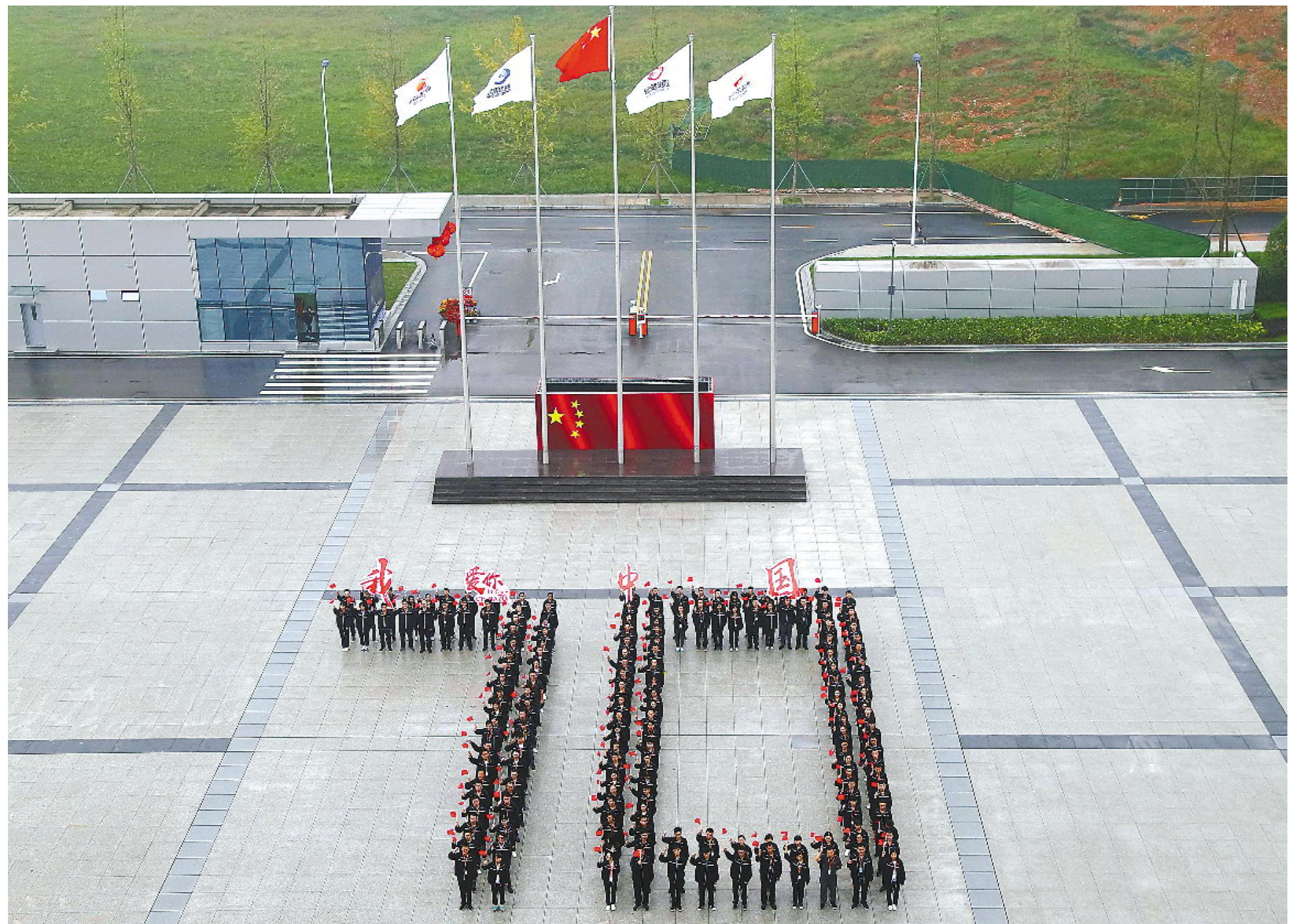
通威太阳能员工祝祖国生日快乐