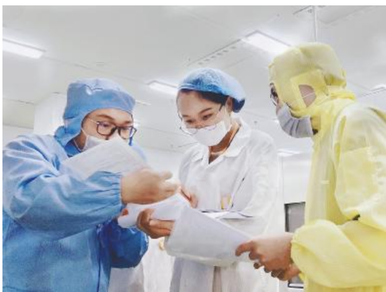
通威太阳能合肥公司2019年季度过程审核现场

10月18日的末次会议上,各厂厂长、部长、经理等管理人员出席会议,对审核中存在的问题和不足制定详实有效的整改措施。本次审核,有利于公司进一步识别并制定措施规避电池加工制造过程中的风险,确保公司质量管理体系持续符合ISO9001:2015标准要求、客户要求以及相关法律法规的要求。