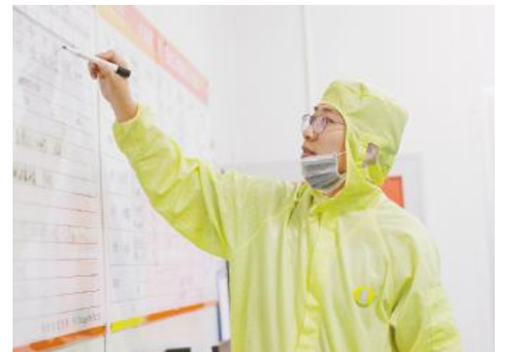
通威太阳能员工国庆期间坚守岗位,谱写爱岗敬业劳动赞歌