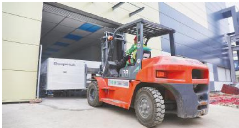
成都公司四期项目大型设备进场

在通威太阳能眉山10GW高效晶硅电池项目基地,相关建设也在紧锣密鼓地推进中,目前,室外总坪工程方面,雨污水管网施工累计完成12000余米,完成西南侧围墙砖墙、柱基础建筑80米,H5道路混凝土浇筑累计完成近5000米;土建工程方面,A1厂房、动力站、纯水站、消防水池等设施进展顺利。