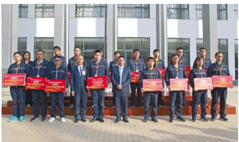
通威太阳能合肥公司2019年第三季度TQM改进项目表彰大会现场

辩论赛决赛的结束也标志着通威太阳能2019年质量月活动圆满落幕。本届质量月通过线上、线下多种形式开展,先后举行了点赞通威点亮质量月、质量知识竞赛答题活动、全员找质量隐患、质量征文等你来“稿”事、质量辩论赛、TQM改善积分加倍赏等六大活动。通过全员参与,发现和采取更多有效措施提高产品、体系或过程满足质量要求的能力,使质量达到一个新的高度。