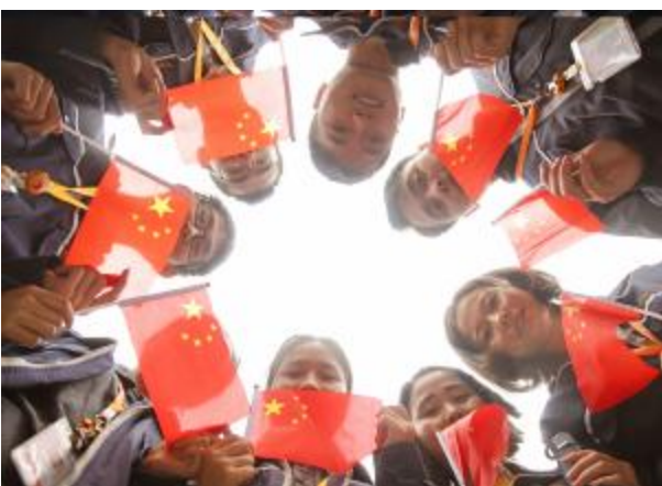
通威太阳能员工与国旗合影

通威太阳能作为国家绿色工厂、智能工厂,一直致力于党工共建的特色发展路径,让党建工建相融相促,引领职工同心筑梦,促进企业和谐发展。此次开展庆国庆系列活动向新中国70周年献礼,利于职工在感受国威的同时,更好的将党工共建融入公司生产经营发展的全过程。员工们纷纷表示要铭记历史,弘扬民族精神,同时立足本职工作,不断提高自我要求,以昂扬向上的工作状态,迎接更为严峻的挑战,为光伏事业贡献力量,永远保持奋斗精神,不忘初心、继续前行。