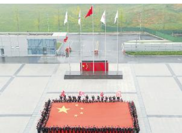
通威太阳能员工向祖国70周年献礼