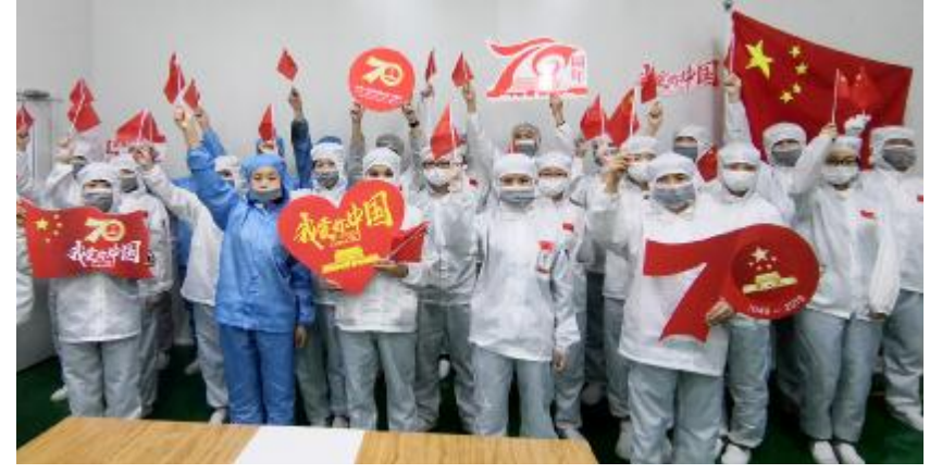
通威太阳能员工祝福祖国明天更美好