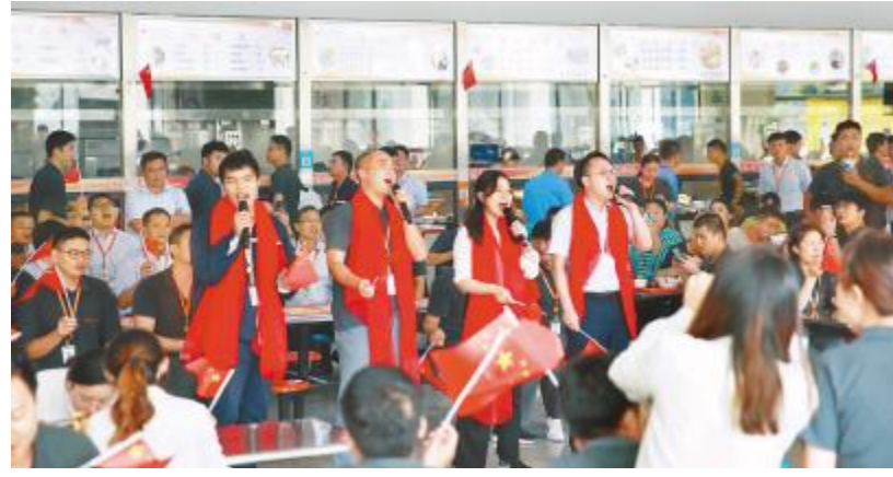
合肥基地员工进行歌唱祖国快闪活动