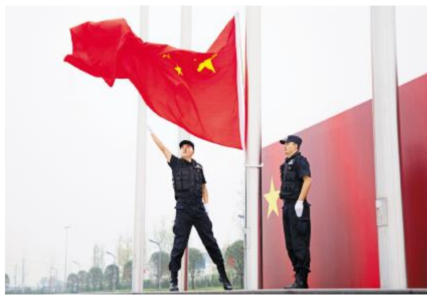
成都基地庄严的升旗仪式