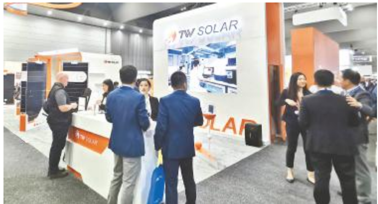
通威太阳能亮相澳大利亚全能源展