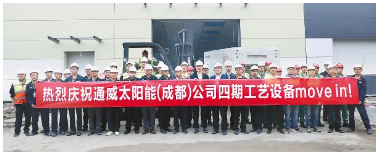
成都公司四期项目工艺设备进场合影留念

企业安全文化是安全管理重要组成部分,公司通过各项活动的开展,强化员工的安全思维,有效夯实公司安全管理基础。公司还将不断推出各项企业安全文化活动,通过各项激励机制,在公司内营造良好的企业安全文化氛围。