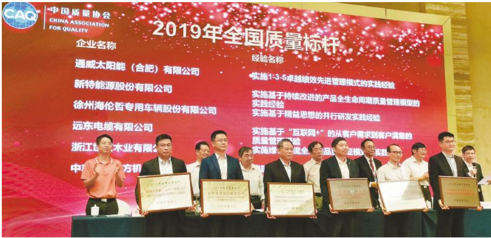
通威太阳能合肥公司荣膺“2019年全国质量标杆”殊荣

质量是兴国之道,更是强企之策。质量是检验产品市场认可度的重要标准,是企业的尊严,也是持续发展的坚强后盾。刚刚过去的全国质量月,通威太阳能开展了包括点赞质量月、全员找隐患、质量征文等一系列活动,全面提升全员质量意识和参与质量建设的积极性。我们同时也要清醒地看到,质量建设是一项长期而艰巨的任务,提高质量不可能一蹴而就,要常抓不懈,而不能浅尝辄止。在通威太阳能,质量建设一直在路上,通过持续不断地开展质量提升工作,最终在行业内树立了“通威口碑”。