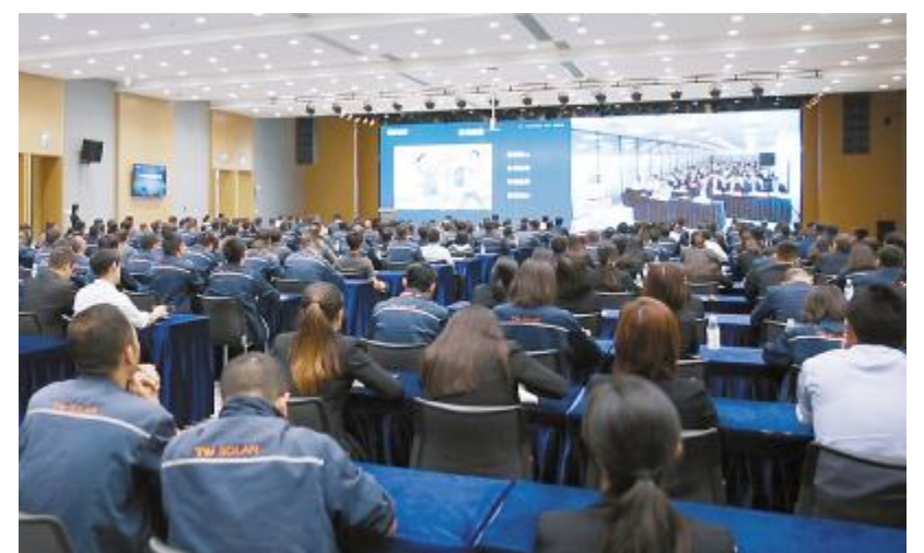
成都基地文化沙龙现场

员工熟知企业文化内容,践行企业文化制度,进一步推动公司文化建设向更优发展。经由企业文化沙龙所汇聚、分享、传播的故事,将不断推动企业文