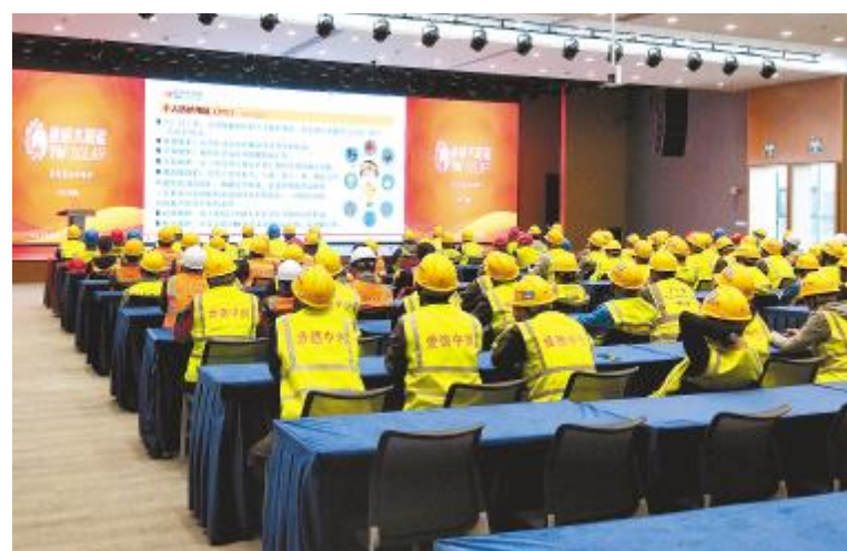
成都公司施工承包商安全培训现场

10月26日,光伏学院组织开展了外部专家课堂第二期《价格与成本分析实战工具》专题学习,合肥、成都基地营销体系近60人参加。本期课程中,学员通过学习“学习曲线、利益平衡点、总使用成本”等适用于不同场景、对象的价格分析具体方法,能够帮助准确解读供应商所提供的信息,为采购及招标工作提供科学的验证方法。供应链管理是企业变化的市场环境中能够利用外部资源提高竞争优势的重要管理策略之一。通威太阳能积极致力于优化升级供应链管理,通过供买双方进行信息共享与经营协调,实现柔性且稳定的供需关系。通过紧密合作,达到双赢乃至多赢的目的。