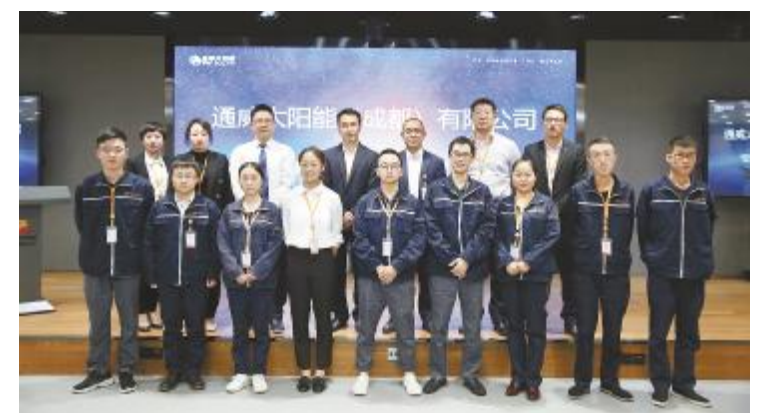
成都公司“安全环保十大禁令”知识竞赛决赛评委与选手合影留念

随着通威太阳能ERP2.0一阶段项目顺利上线,二阶段项目工作正如火如荼的进行中,预计将于11月初完成销售到应收共享、资产项目管理模块的上线,12月底完成财务核算、资金管理模块的上线。整个ERP2.0项目将于2019年底完成所有核心业务覆盖。