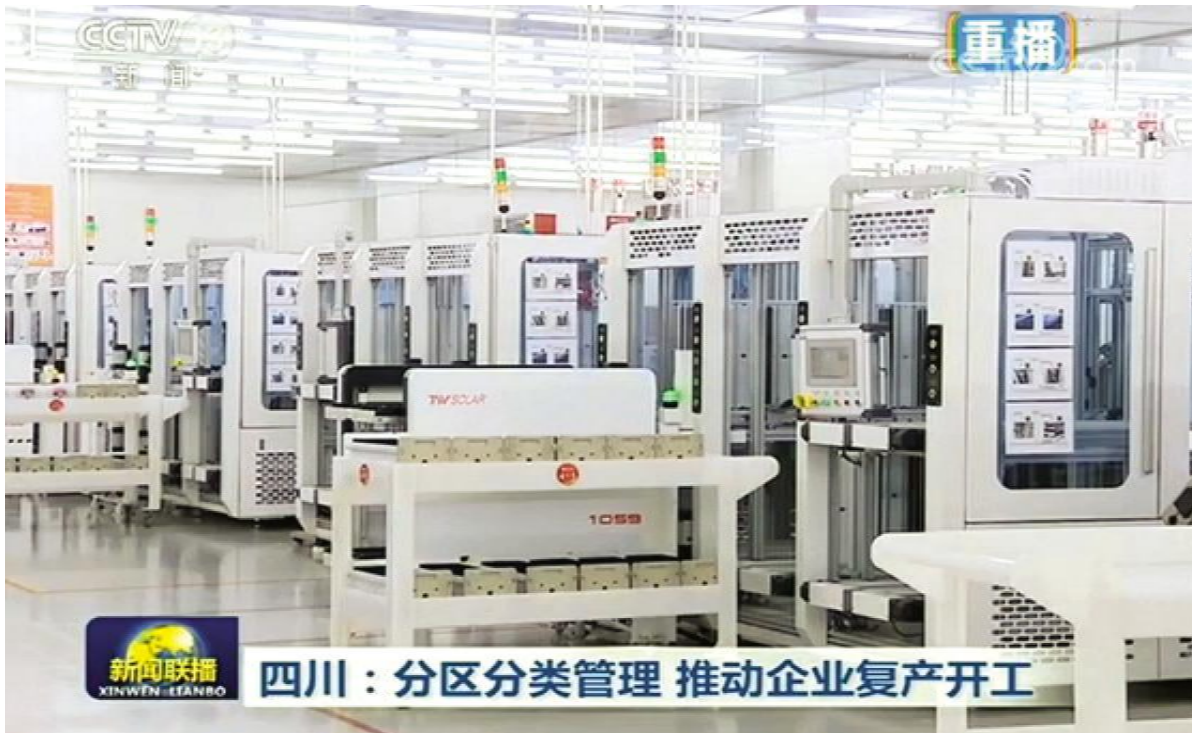
四川:分区分类管理 推动企业复工复产