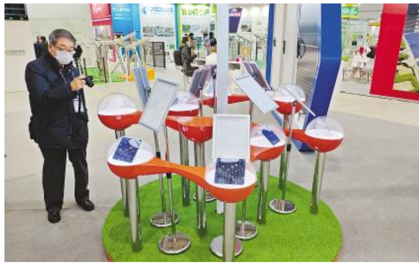
参展客户详细了解通威太阳能电池片

日本长期以来非常重视新能源的开发利用,其中对于光伏行业尤为关注,对于产品品质和效率的要求也远高于很多市场。通威太阳能作为全球最大的电池片供应商,全球市场占有率达10%-12%,众多封装通威电池片的组件源源不断涌入日本市场,转光热为能源,未来通威太阳能也将致力于高效产品的研发,为光伏产业的未来不断注入力量。