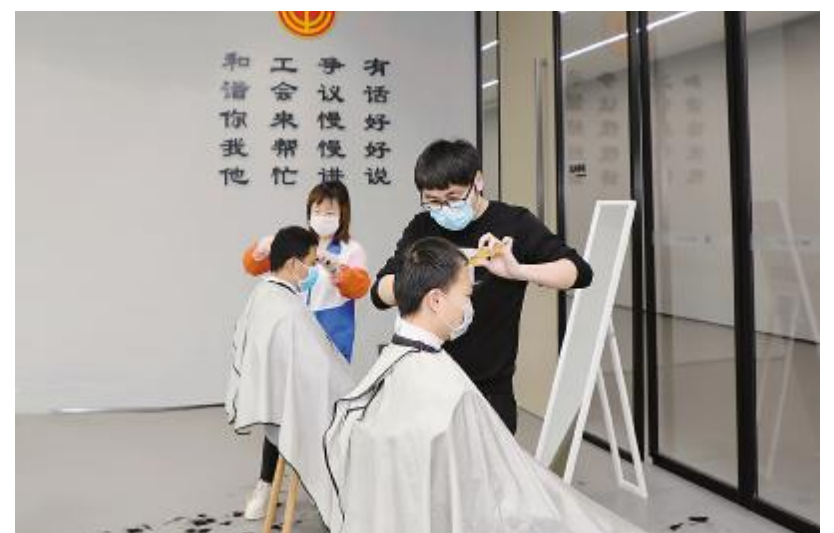
成都公司爱心免费理发现场