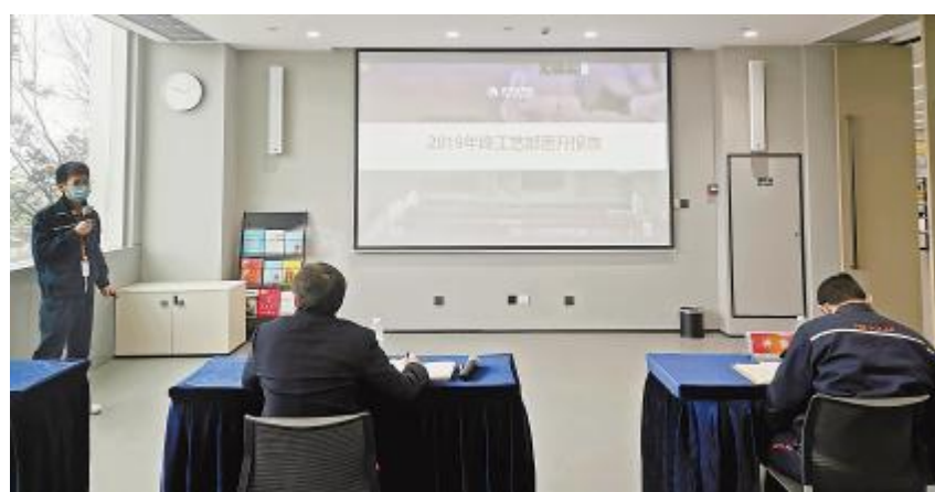
工艺部晋升评审现场

为保障公司各类培训项目有序开展,通威大学光伏学院充分引入互联网技术创新培训方式,将各类线下面授培训转移至线上开展,让学员在保障身体健康的前提下,学习新知识、新技能。秉承这一工作目标,2月26日、27日,通威大学光伏学院成功举办了储备组长培养项目秋季班《精益生产》直播课程,成都、合肥两地共计110余名学员参加了学习。