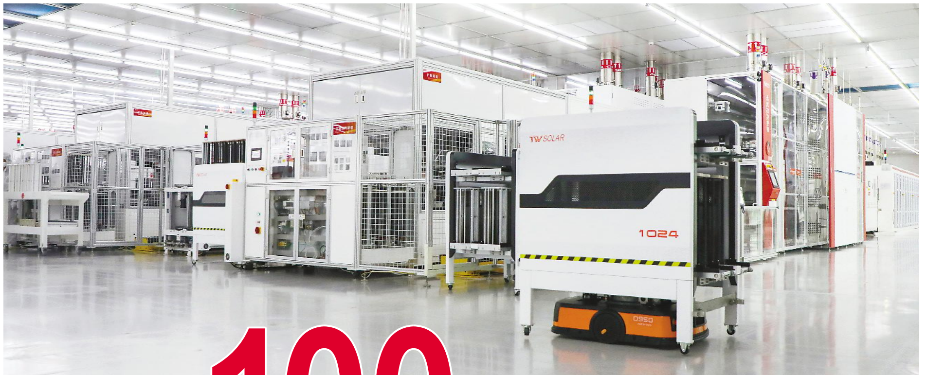
通威太阳能成都公司智能制造生产车间

在多晶硅环节,协鑫、大全、特变、通威、东方希望五大龙头目前形成第一梯队产能均势的格局。在电池片环节,则形成以通威为龙头的“1+8”格局,但未来2-3年面临着HJT技术对Perc系列技术的迭代。因此,通威在当前这个时间点上大规模宣告在多晶硅、电池片两大环节的重点扩产高性价比的HJT电池技术,将打破当前多晶硅、电池片两大环节的竞争格局,推动着两大环节的集中度提升。