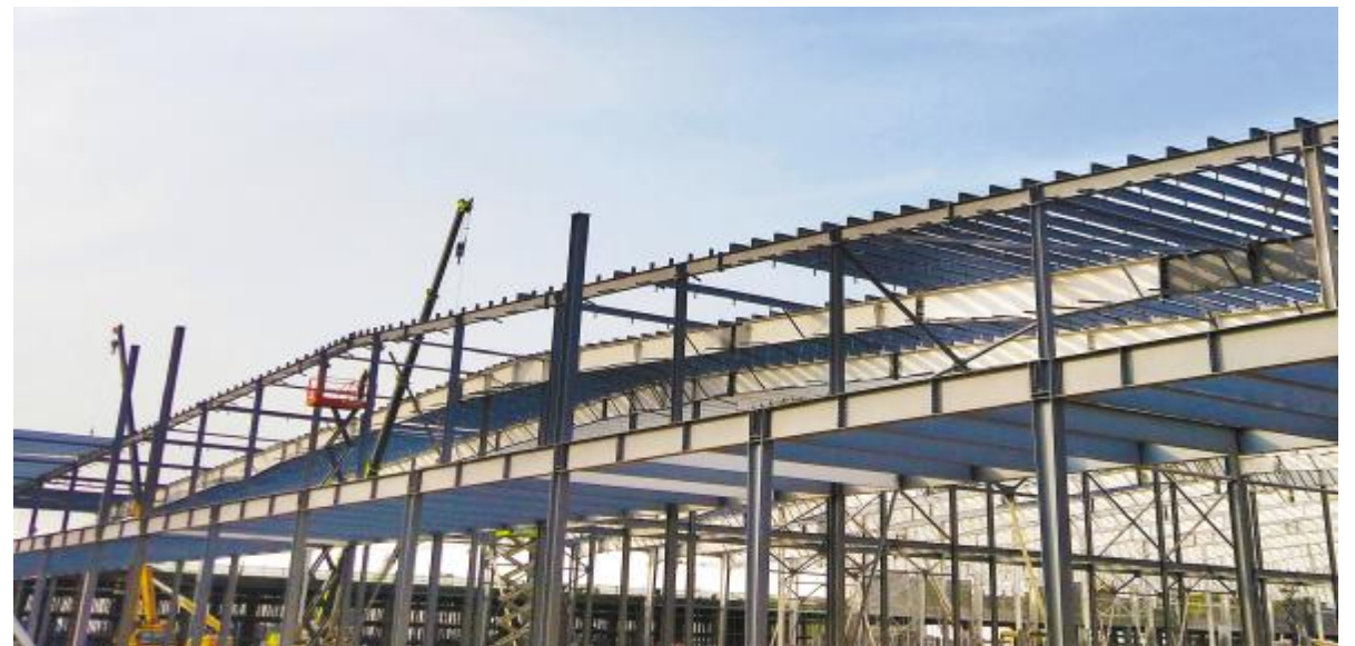
通威太阳能眉山公司建设现场

除上述主流媒体外,能源一号、索比光伏网、北极星太阳能光伏网、SOLARZOOM、OFweek太阳能光伏、PV-Tech、世纪新能源网、成都发布等近20家主流媒体、行业媒体竞相报道通威扩产计划,强势聚焦通威太阳能金堂项目。