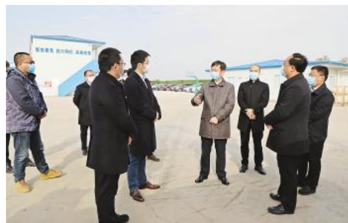
眉山市委副书记、市政府代理市长胡元坤调研眉山项目

2月,面临疫情防控和生产经营的双重压力,通威太阳能坚持防控和生产“两手抓”“两手硬”,严格落实各项防疫措施,引导员工加强自身防护,积极组织,有序复工复产,为地方经济发展贡献通威力量。眉山市委书记慕新海,眉山市委副书记、市政府代理市长胡元坤,成都市人民政府副市长曹俊杰,成都市政协副主席、双流区委书记韩轶等领导莅临通威太阳能各基地调研指导,高度肯定公司战疫情、保生产的各项举措,鼓励公司持续降低产品生产成本,持续提升技术水平,不断夯实在太阳能电池产能、技术方面的领先地位。