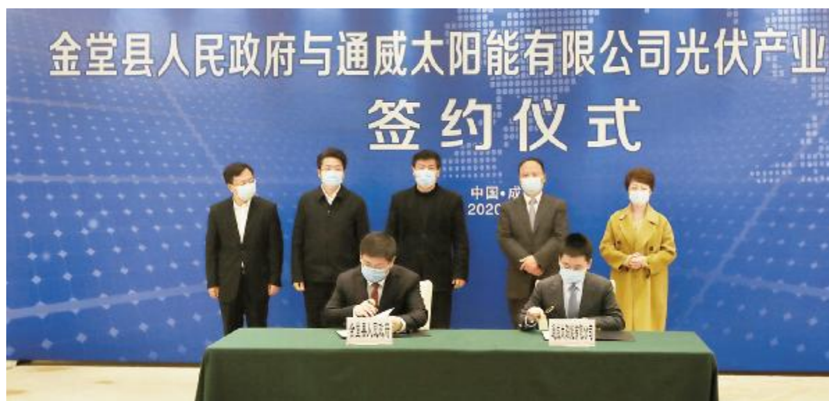
通威太阳能光伏产业基地项目签约仪式现场

自2015年至今,通威在蓉共投资4期项目,产能、销售收入、投资额连续3年实现翻番,不断刷新全球单车间产能规模纪录,通威太阳能光伏产业基地项目将再次刷新这一纪录。