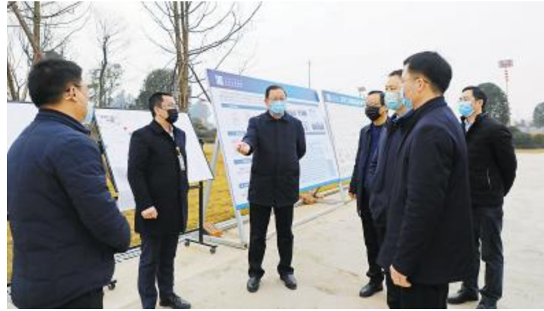
眉山市人民政府副市长冉登祥详细了解公司疫情防控措施