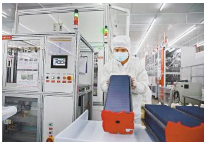
合肥公司车间员工正在有序进行复工复产

目前,通威太阳能成都、合肥两地已完成复工复产,各产线运转良好。通威太阳能将继续夯实疫情防控基础,并为推动两地经济发展作出积极贡献。