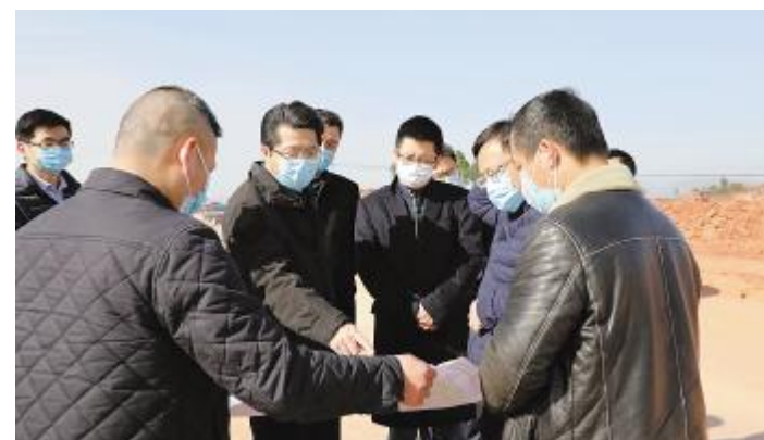
成都市政府副市长曹俊杰现场指导金堂项目规划

眉山市政府代理市长胡元坤询问了公司发展土地、用电、交通等要素保障需求,对防疫期间“分区作业、分岗操作、分餐就餐、分开会议、分别住宿”的“五分管理法”表示高度肯定,并指出,在全市战疫情、保生产的的关键时期,眉山市委市政府要与通威太阳能等在眉企业同心同向,推进各项举措抓细抓牢、落实落地,实现防疫与发展两手抓、两不误,促进产业与城市融合发展,实现眉山2020年经济发展再上新台阶!