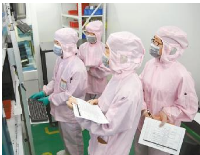
实际操作技能考核现场,员工操作设备机台

此外,技术评定实行定制化岗位管理,光伏学院根据公司各岗位所需的技术水平、操作难度、工作压力等因素将岗位划分为核心岗位和普通岗位。普通岗位评定1-6级,对核心岗位给予政策性鼓励,培育刻苦钻研的工匠精神,可评定1-8级。