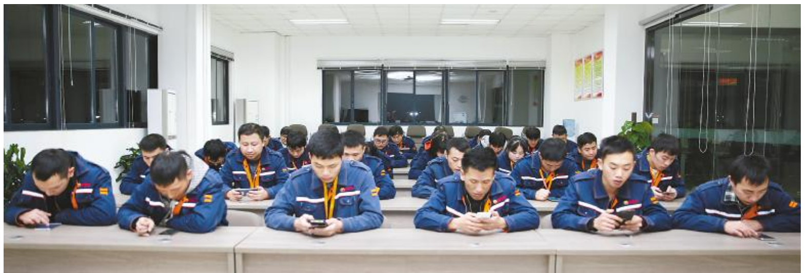
员工理论知识考试现场