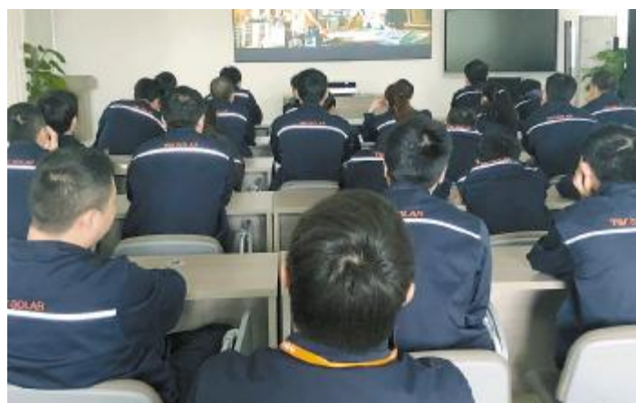
通威大学光伏学院观影活动现场