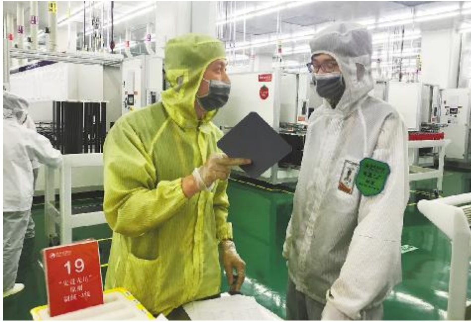
岗位带教情况落地调研