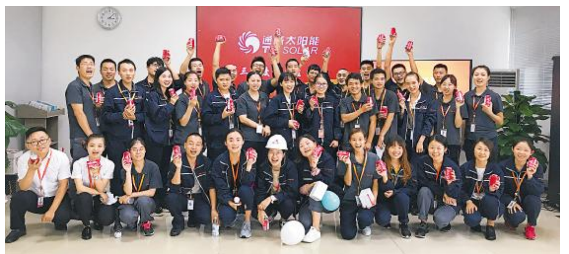
通威大学光伏学院第三季度成都基地员工生日会现场

每一位在职员工切身感受到公司大家庭的温暖,使广大员工真正地融入到公司大家庭中,进而保持更好的工作心态,与公司共同成长和发展。通过开展员工兴趣培训班、员工生日会等活动,光伏学院在打造“关爱员工”的企业文化过程中受到了员工的一致好评,在集团2018民主测评中,公司得分增幅全集团最快。