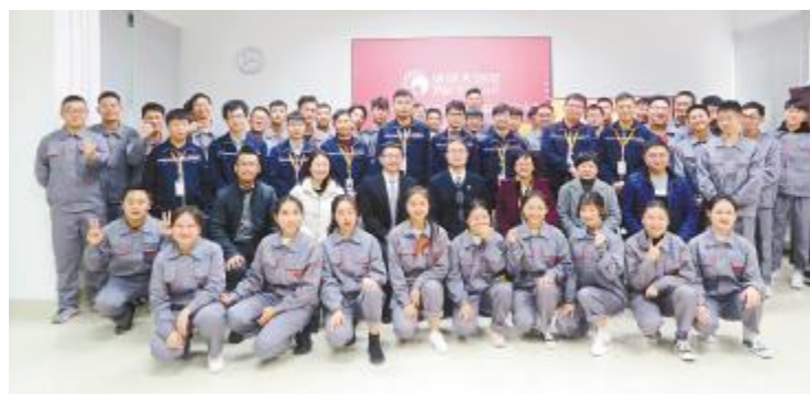
2018年12月4日,乐山职业技术学院2018级通威现代学徒制班拜师仪式合影留念