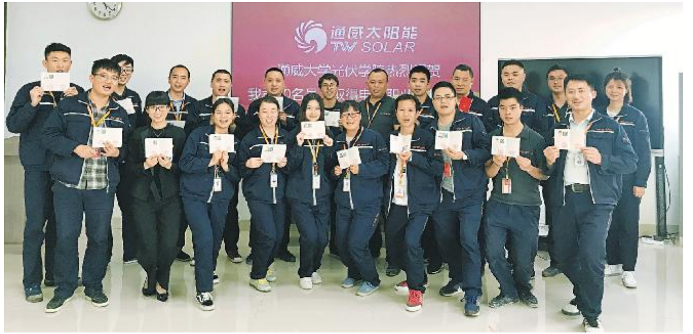
通威大学光伏学院 90位学员通过国家级技能鉴定