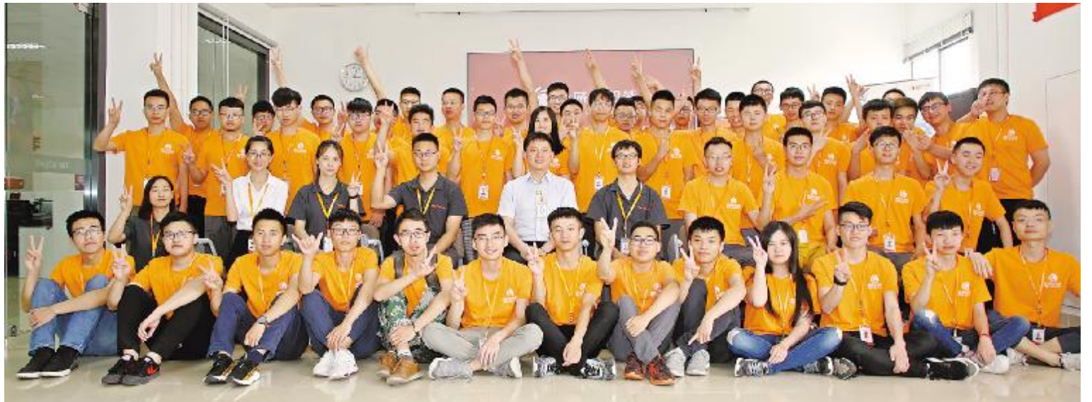
2018年6月19日,通威太阳能2018年“启航工程”培训项目正式启动

自2016年以来,校企合作为企业输送合格人才500余人。一方面满足了企业所需的人才需求,另一方面也塑造了良好的雇主品牌形象。人才的保障,有力的支撑了企业朝着“全力打造世界级太阳能光伏企业和世界级清洁能源公司”的目标不断砥砺前行!