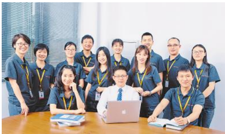
通威太阳能人力资源团队

2019年1月8日,刘主席在视察通威太阳能合肥公司时指出,“在未来的发展过程中,我们要思考如何探索建立长效的发展机制,充分激活每个员工的内生动力,让每个员工‘脑袋转起来,腿跑起来’,让每个员工、每个岗位都能够分享公司发展的成果。”在杨总看来,这正是光伏学院的目标。2018年,光伏学院进入第二个年头,这一年光伏学院从班组长成长、技术序列员工发展、管理层的与时俱进、销售采购员工培训以及应届生招聘与培训等多个方面开展员工培训。从各个层级帮助员工成长,