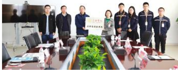
2018年11月23日,合肥学院大学生就业基地落户通威太阳能合肥公司