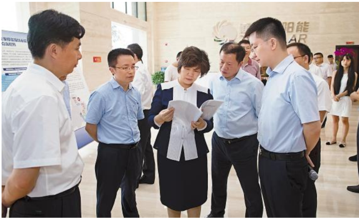
2018年8月24日,国家人力资源和社会保障部副部长、党组成员张义珍视察通威太阳能,高度评价光伏学院发展成果

在打造产品核心竞争力的同时,通威太阳能依托通威大学光伏学院,持续提升团队核心竞争力,从人才培养、机制建立、人均效能提升等多方面发力,打造了一支召之即来、来之能战、战之必胜的通威铁军。