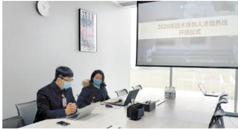
技术序列春季培养班成都公司开班仪式现场

态度和行为收获想要的结果。仪式的最后,两地技术序列人才培养项目负责人就培养目标、培养周期与对象、培养内容、配套政策等内容进行了宣贯。 光伏学院2020年技术序列人才培养项目力求培养体系与阶段衔接,以培养目标为导向,按照培养层级的实际需求输出课程与评估,增加了行动化学习、项目实战演练的规划。同时,项目也将强化导师角色,充分发挥岗位实践带教与职业成长辅导的作用,让内部赋能落地转化为实际的人才输出成果。 本次开班仪式的顺利举行为光伏学院其他关键人才培养项目春季班开班拉开了序幕。未来,光伏学院将持续围绕公司战略发展目标,承接业务一线需求,完善基础学习、岗位实践、技术实践与管理实践体系,全方位优化人才结构,提升人才输送效能,在打好这场防疫战的同时,保障人才培养工作顺利开展!