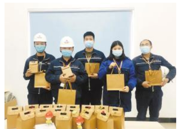
第二十八届“世界水日”有奖知识竞赛活动颁奖现场

本次演练以现场按比例抽取交通车司机的形式,针对快速取用车载灭火器并在空地使用灭火器实操灭火进行演练。演练开始前,安全员为交通车司机就如何使用灭火器等安全常识进行讲解,以便每位司机均能在事故发生时采取有效措施保证乘车人员的安全,减少经济损失。通过本次现场处置演练,进一步提升了驾驶员的疏散能力及职工自救能力。生命没有彩排,只有通过一次又一次的演练提升安全知识和应变能力,当危险真正的来临时,我们才能更好地保护自己、保护他人。