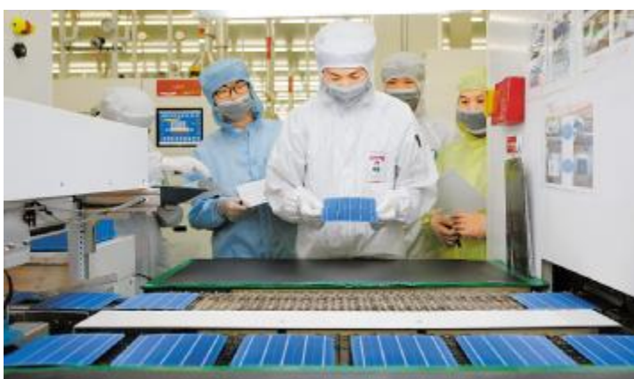
技能等级评定等公开透明的晋升机制,充分激活员工潜能

本报讯(通讯员 王园园)企业向前发展的动力来源于每一位员工,如何让员工在公司工作生活的舒心、安心、放心、对未来充满信心,是通威太阳能公司管理层持续思考的话题。为了实现以文化的力量助推幸福企业的建设,让员工实现精神与物质的双丰收,通威太阳能特色文化建设不断创新升级,“以人为本”的雇主品牌蓝图开始绘就。