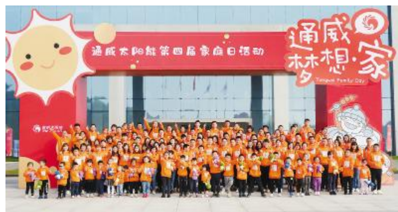
家庭日等系列活动,提升了员工归属感,增强了员工凝聚力

余人,为了管好人、用好人,公司探索总结出了一套优秀的人力资源管理经验。完善的薪酬保障和绩效激励,使员工的工作价值得到满足;光伏学院定期组织开展主题培训、外派进修,为员工的成长提供了学习渠道;公开透明的晋升机制,促进员工在岗位上发挥自己最大的潜能,实现自我。企业文化建设体系中,篮球比赛、拔河比赛、烘焙、插花、节假日主题活动等多姿多彩的企业文化活动,丰富了员工的业余生活;工会开展奋斗者关爱系列项目,定期为员工发放生日礼品、购物卡,开展困难职工帮扶,并积极为大病家庭申请国家级救助金,