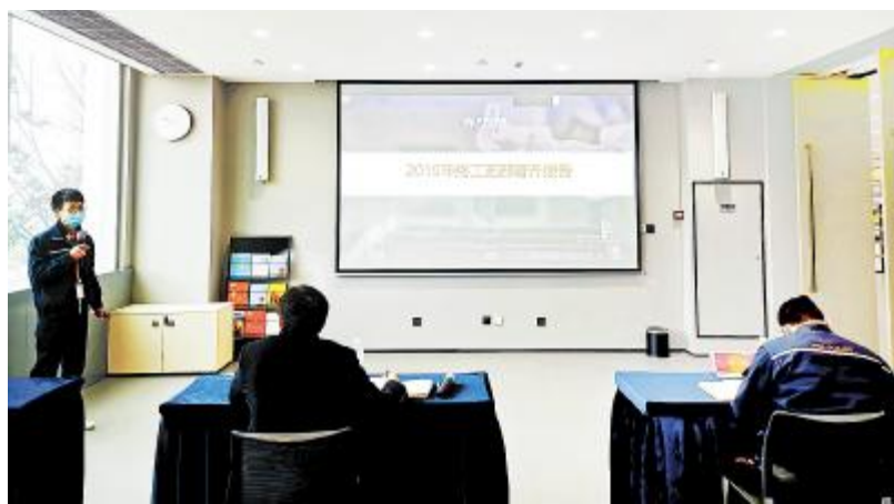
成都公司工艺部 2019 年度年终晋升评审现场