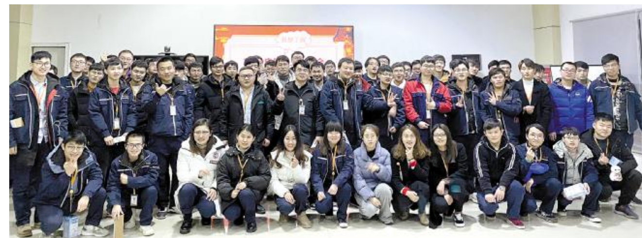
2019届启航员工年度座谈会合肥公司合影