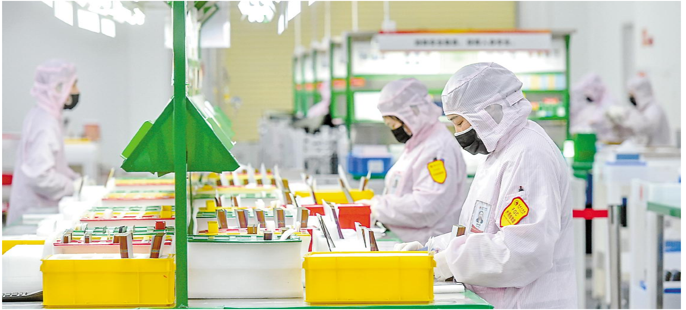
通威太阳能成都公司各生产线、各体系工作井然有序推进