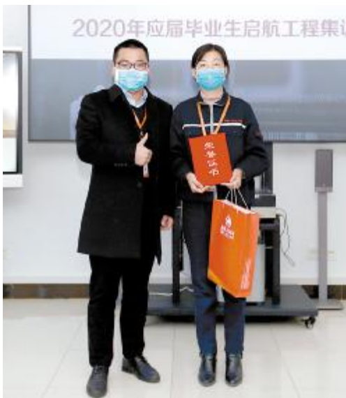
2020年启航工程春季班集训营结业仪式颁奖环节