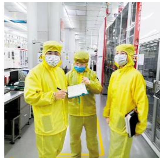
2020年中威企业文化融合主题学习交流现场

据悉,自今年年初中威电池厂并入以来,人力资源体系已完成编制梳理并同时着手开展绩效方案修改,本次交流活动落实了光伏学院针对中威电池厂开展的文化融入、效能提升工作方案的第一步。未来,光伏学