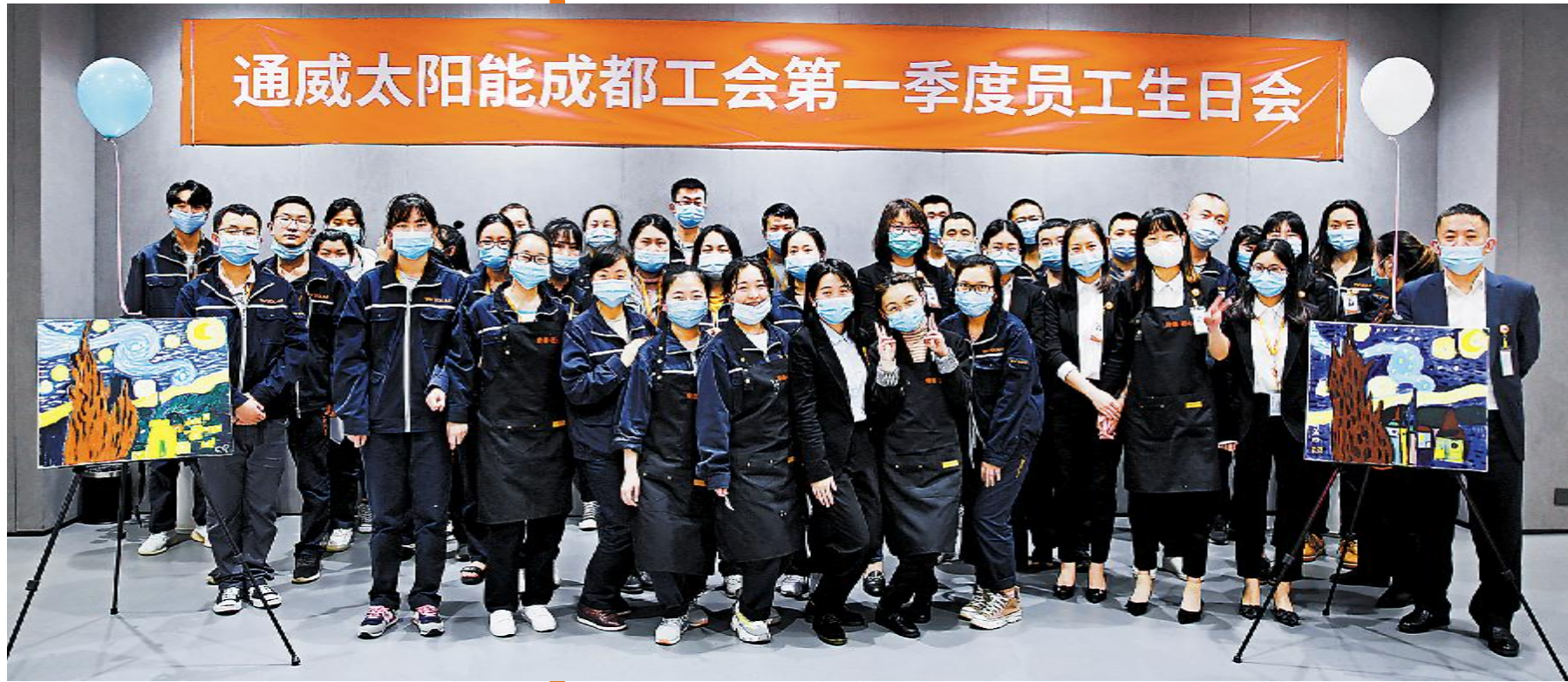
成都公司2020年第一季度员工生日会合影留念