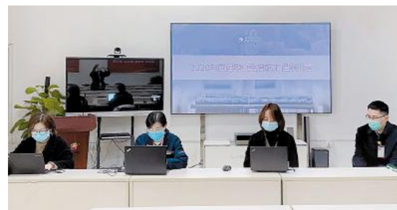
2020年启航工程春季班线上集训营开班仪式现场

光伏学院老师们不断创新授课模式,在启航集训营的开展过程中结合讲授、素质拓展、沙盘模拟、参观等方式开展灵活教学,同时坚持每日有考核的过程管理,带给学员们一场兼具系统性、多样性、挑战性、趣味性的学习之旅。