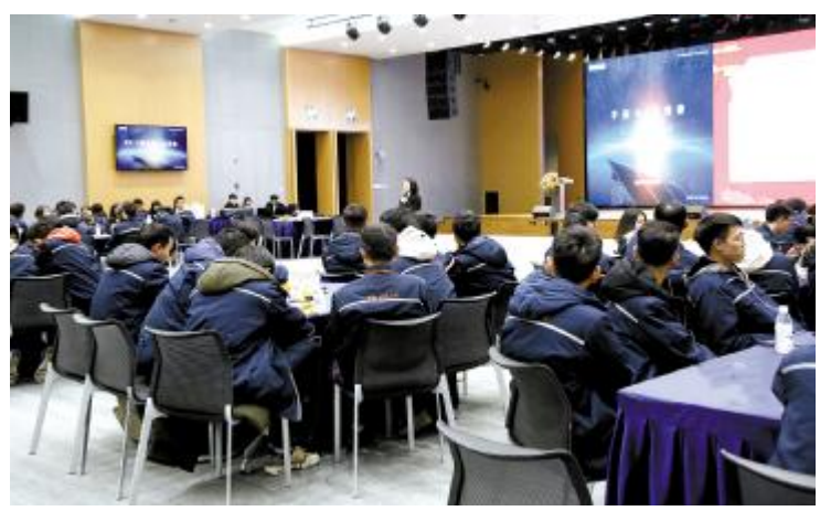
2019届启航员工年度座谈会成都公司现场