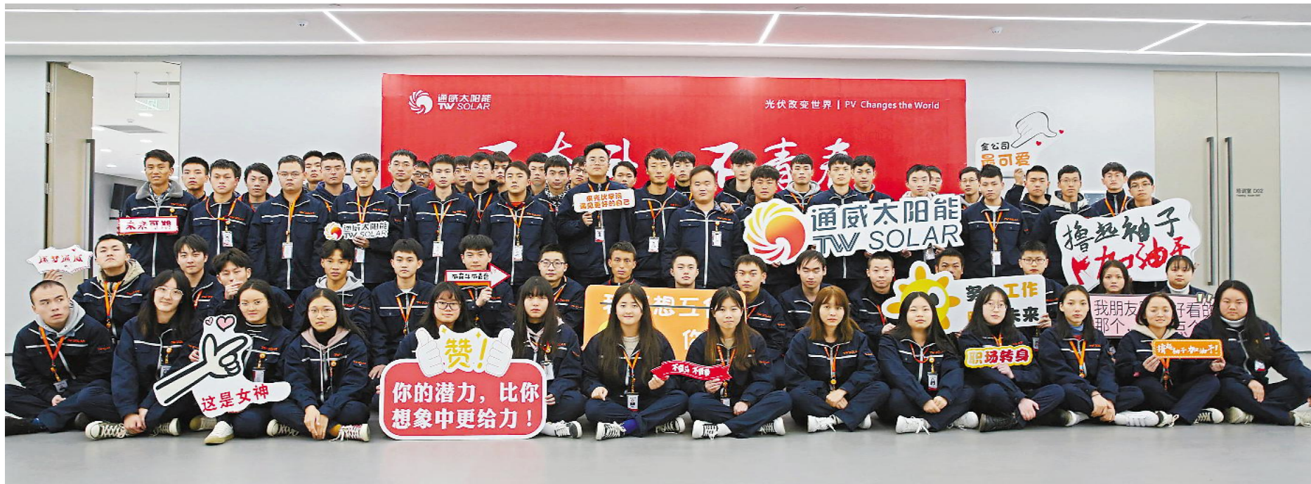
启航工程学员合影留念