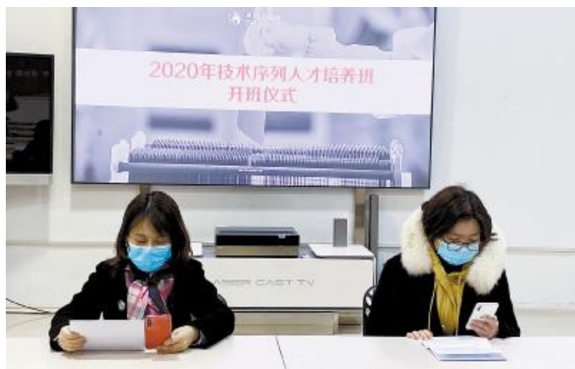
技术序列春季培养班合肥公司开班仪式现场