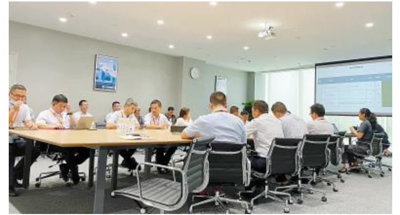
成都公司召开2020年下半年第一次质量会议

本次会议的召开,明确了下一步质量工作开展方向及要求,进一步落实了各部门、各岗位质量问题责任制,为公司提升产品质量管理水平,强化各项监管措施,严格防范各类质量风险,为高质量的产品及良好的公司形象奠定坚实基础。