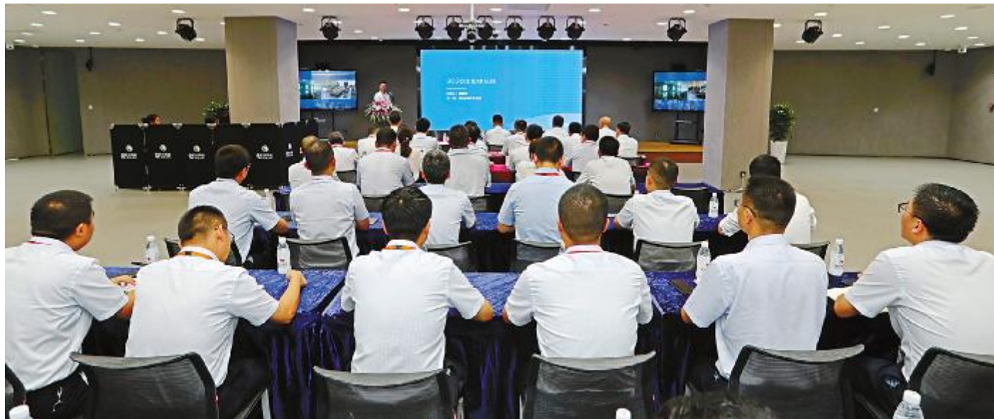
通威太阳能 2020 半年总结计划会现场