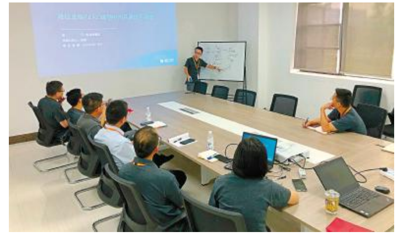
成都公司召开内部品质提升专项首次会议

后期,通威太阳能将持续强化产品质量监督,推进产品质量改善,强化各项监管措施,严格防范各类质量风险,不断提升产品质量管理水平,打造高质量通威产品。