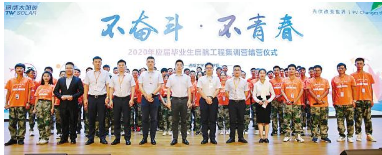
结营仪式现场合影留念

7月10日—24日,通威大学光伏学院2020年“不奋斗·不青春——启航工程”集训营在通威太阳能成都公司成功举行,来自全国各大高校的300余名应届毕业生参加。为期15天的集训旅程,启航学员从走进通威到走进通威,完成了一次职场转身的洗礼。