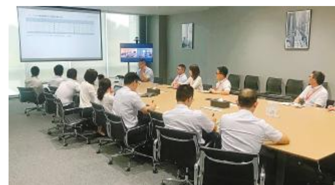
通威太阳能产销协调会现场