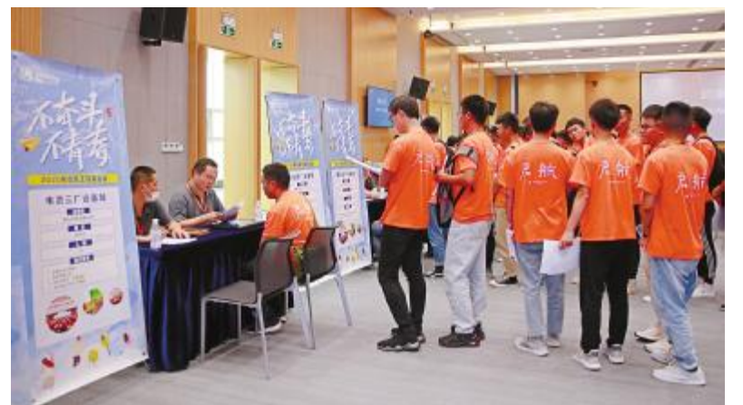
人才双选会,面试官与学员交流

本次双选会通过学员们自主选择岗位、投递简历进行面试的形式,不仅为用人单位选到合适的人才,更推动着岗位和专业的精准匹配,将用人单位需求和人才培养精准对接,为实现通威太阳能人才战略性发展做出重要贡献。