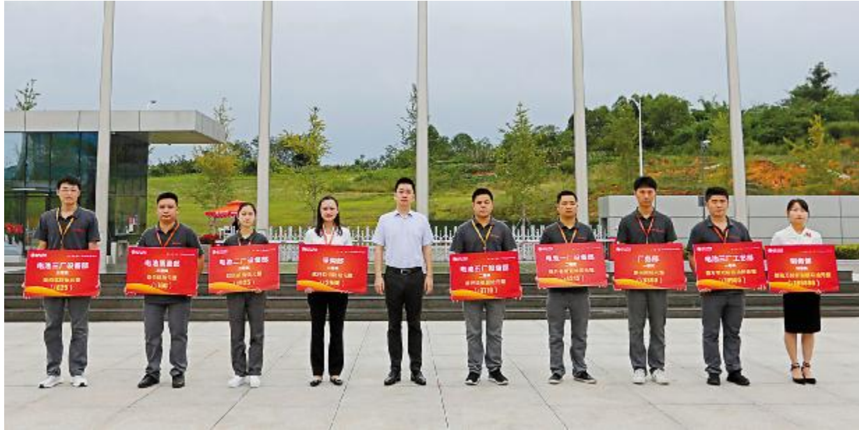
成都公司2020年第二季度TQM颁奖仪式现场