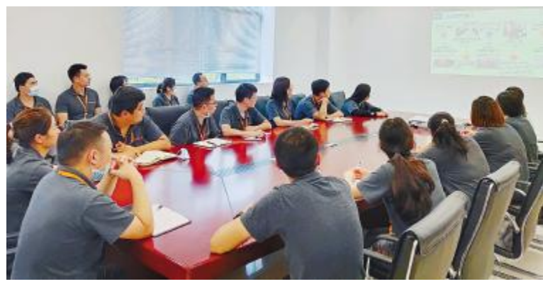
合肥公司电池质量部清单管理总结会现场