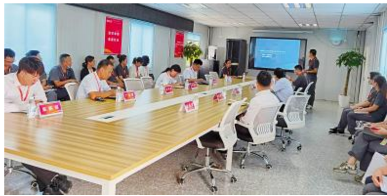
眉山公司举行首次内审会议暨TQM启动会

本次演讲比赛考验了各组对清单管理的推行力度和理解程度,体现了厂务部对清单管理的执行力。通过本次演讲比赛,提高了参赛人员的现场表达和对清单管理的理解能力,同步检验了厂务部对“谈执行力”系列讲话精神的实践。后期,通威太阳能将进一步完善清单管理的要求,切实将清单运用到实际工作中,提高员工的各项技能,为车间生产保驾护航。