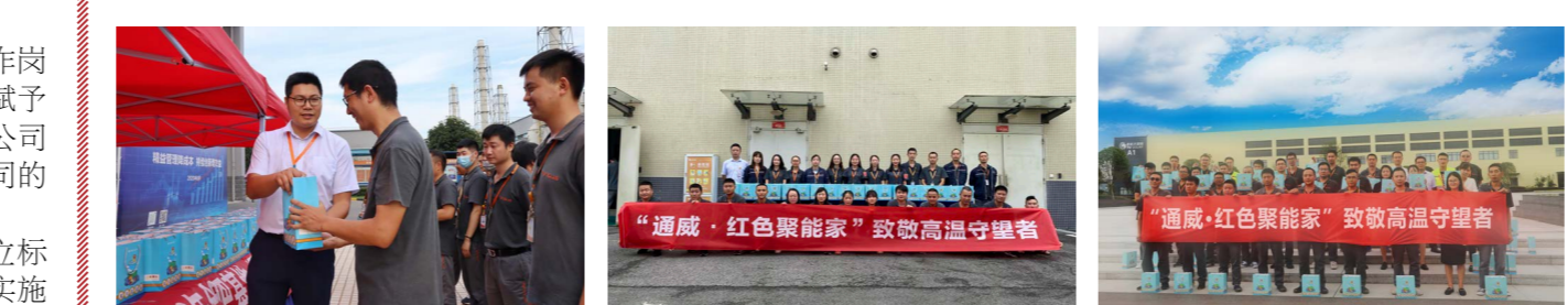
合肥工会活动现场 成都工会活动现场 眉山工会活动现场

本报讯(通讯员 程良 徐志琴 徐璐璐)为全面做好防暑降温工作,切实落地奋斗者关爱企业文化,8月14日,通威太阳能成都、眉山、金堂基地组织开展了“致敬高温守望者”夏日送清凉慰问活动。 烈日当空,各基地党员代表、工会委员代表将一份份清凉、菊花茶、冰袖、随身小风扇的“清凉大礼包”发放到了620余位高温作业职工的手中,大家带着喜悦的心情领取属于自己的清凉礼包。每年工会都向大家心意,精心搭配夏日必备的清凉用品,员工纷纷表示,小小的礼物给予了大大的惊喜,感受到了公司无微不至的关怀,收到的是清凉慰问品,心里却收获了满满的温暖,自己会将公司的关心转化为工作的动力,以更加饱满的工作热情投入到工作中,坚持不懈地紧抓安全生产这根弦,坚守好自己的岗位,保质保量完成公司各项生产目标任务,为公司增光添彩!