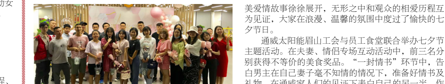
眉山工会七夕合影留念

本次活动不仅凸显了爱情忠贞、家庭幸福等文化内涵,增强了员工对传统节日的重视,营造了浓厚的节日氛围,更是使大家充分感受到了来自通威的温暖和关爱,进一步增强了员工对企业的归属感与认同感。