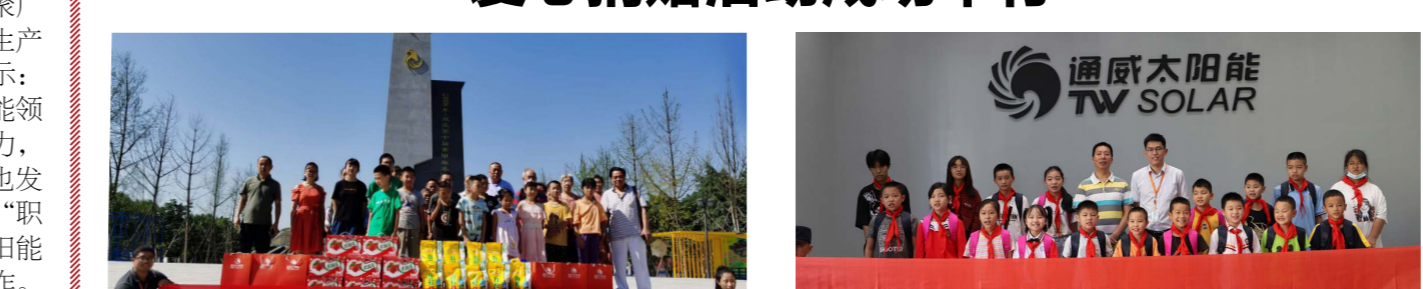
成都“红色聚能家”捐赠活动合影留念 眉山“红色聚能家”捐赠活动合影留念

随后,学生们井然有序地进入通威太阳能智能制造体验馆开始了参观之旅,现场观摩“智能工厂”、“数字化车间”的实时运行情况,讲解员亲切地讲解了通威的发展故事,同学们将“课堂”搬到了车间,边参观边向“太阳能电池片是怎么发电的?”、“机器人是怎么运作的?”、“讲解员——耐心解答。同学们激动地说:“机器人也太厉害了!”、“我要努力学习科学知识和技能,将来能到这样的地方工作!” 此次活动既是一次爱心传递活动,也是一次精神鼓舞活动,让孩子们感受到了祖国和谐大家庭的温暖,还营造了关心、关爱留守儿童的良好氛围。通威太阳能将继续践行使命与担当,不忘初心、牢记使命,继续用真情与爱心回馈社会,传递爱与责任,为构建和谐社会传递正能量。