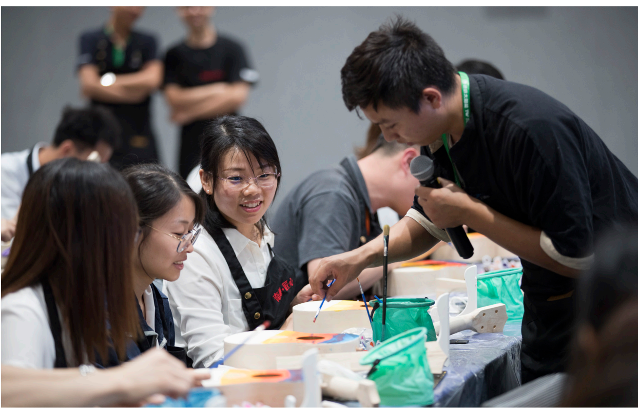
成都工会活动现场员工开心地绘制着尤克里里