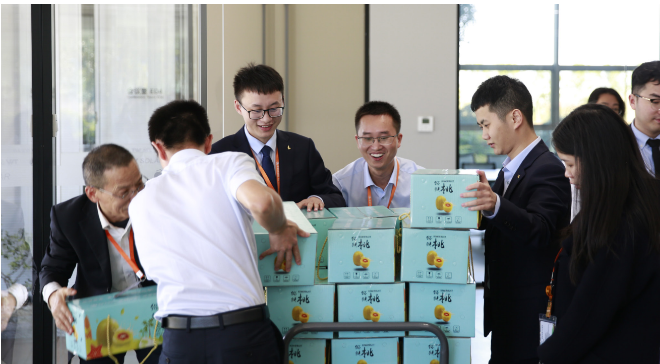
成都工会中秋节福利发放现场

通威太阳能工会始终传承“家”的文化,以员工为核心,努力不懈地为员工打造一个暖心、发展的生活工作平台。值此国庆、中秋佳节来临之际,祝公司的各位同仁节日快乐!也祝通威太阳能不断发展更强大!映着微笑,捧着香甜,相信在未来的日子里,每一位通威人定能再接再厉,继续拼搏,共筑通威太阳能更加辉煌的明天!