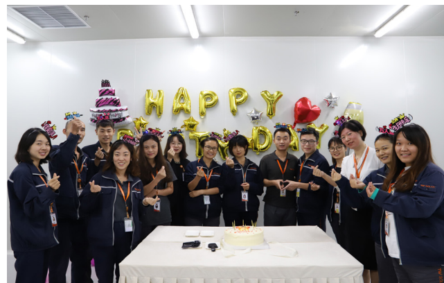
眉山工会活动现场合影留念

本报讯(通讯员 张瑜 陈南)记录每一份感动,镌刻每份感动。金秋时节,硕果丰收,为感谢伙伴们辛勤付出,活跃员工气氛,增强企业团队凝聚力,9月15日-16日,通威太阳能成都、眉山、合肥公司工会成功举办第三季度员工生日会。