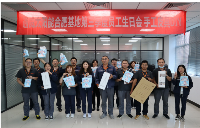
合肥工会活动现场合影留念