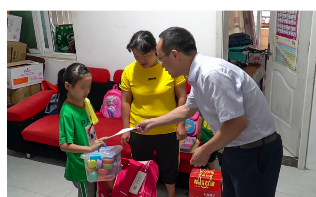
为困境儿童发放爱心礼包

本报讯(通讯员 程良)贫困家庭儿童、单亲家庭儿童、残疾儿童等困境儿童成为社会和家庭关注的重点,引起了社会的普遍关注。2020年9月5日,恰逢第五个“中华慈善日”,通威太阳能合肥公司党工代表组织开展了一场困境儿童关爱帮扶公益活动,党工代表志愿者们自发爱心捐款,并前往困境儿童家庭进行慰问,为传递公司正能量助力。