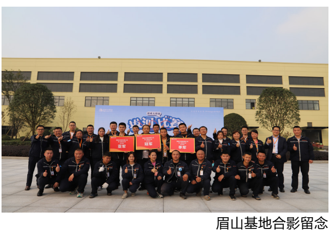
眉山基地合影留念