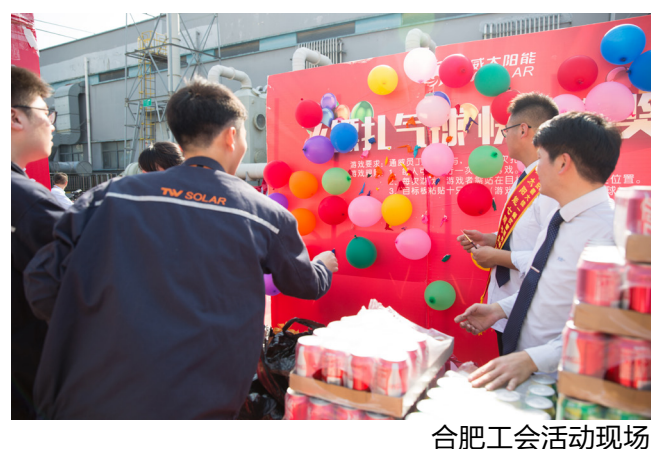
合肥工会活动现场