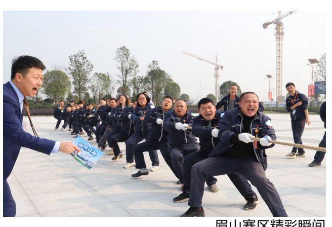
眉山赛区精彩瞬间