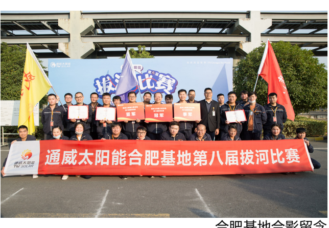
合肥基地合影留念

由于实力相近,势均力敌,多场比赛拼满三局才决出胜负。经过紧张激烈的争夺,最终合肥基地由电池五厂、高效电池项目组、制程整合部组成的“无敌队”夺冠,电池二厂“威狼队”和电池一厂、三厂组成的“猛虎队”分获第二、三名。成都基地电池五厂组成的“力拔山兮队”夺冠,电池一厂“猛虎队”和电池四厂“通威队”分获第二、三名。眉山基地由电池二厂生产部、工艺部、设备部组成的“必胜队”夺冠,计划部组成的“天一队”和