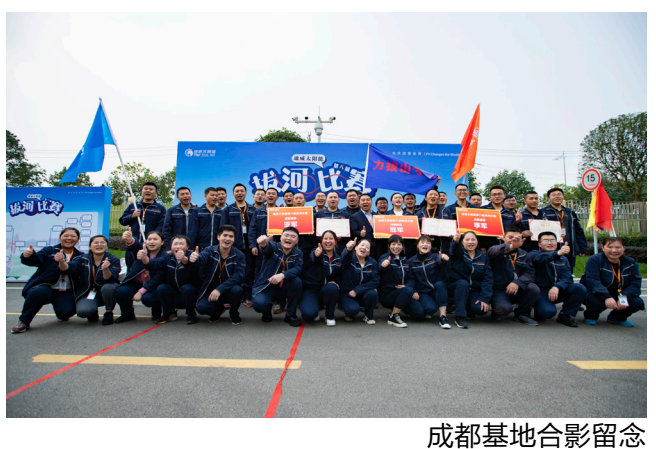
成都基地合影留念

质量部组成的“质量一家亲”分获第二、三名。赛场如战场,拔河比赛是通威太阳能周年活动的传统比赛项目,见证了通威太阳能员工团结拼搏的意志品质更是展示了通威员工团结协作、敢打敢拼、勇往直前、永不言弃的精神风貌,活动旨在鼓励员工以饱满的精神状态和昂扬奋发的斗志投身工作,为公司的高质量发展贡献自己的最大力量。