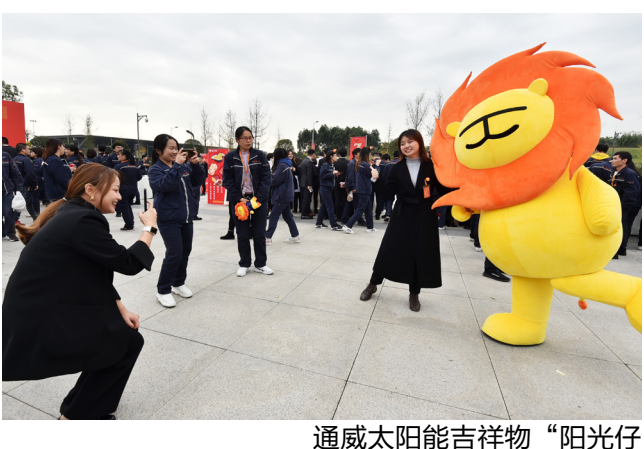
通威太阳能吉祥物“阳光仔”