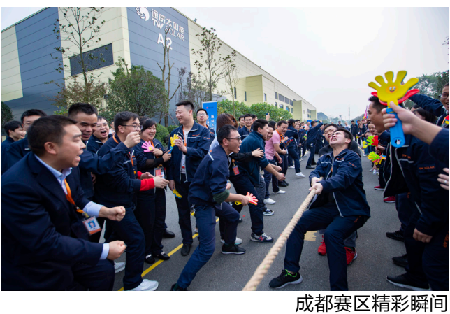
成都赛区精彩瞬间