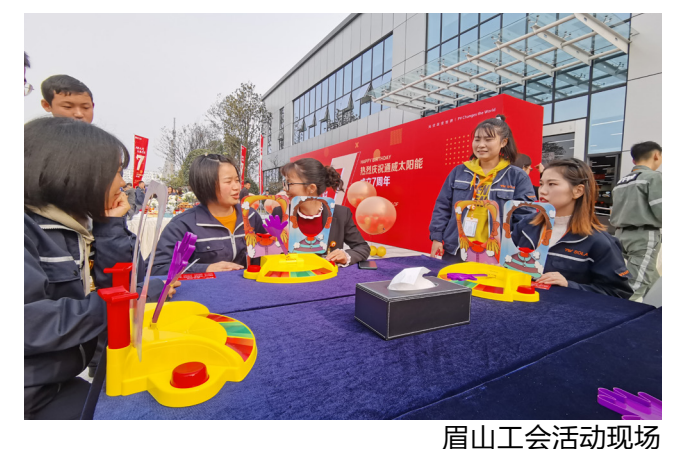
眉山工会活动现场