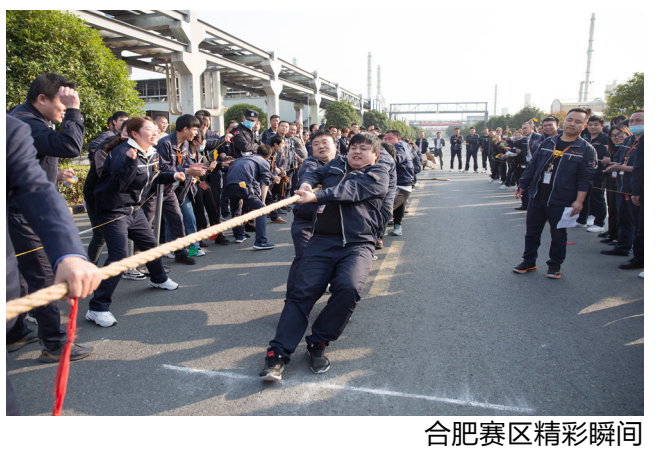
合肥赛区精彩瞬间

围迅速紧张起来,选手们个个精神抖擞、斗志昂扬,大家拉起绳子,咬紧牙关,紧紧将绳子攥在手心,只要结束的哨声没有吹响,大家都在全力以赴为了集体荣誉拼尽全力。他们用汗水为我们讲述了团结的含义,更用顽强的毅力与拼搏的精神感染每一个通威人。场下,拉拉队员更是使出浑身解数摇旗助威、拍手呐喊,加油声、呼喊声响彻赛场,每一声“加油”都带来一股振奋人心的力量!