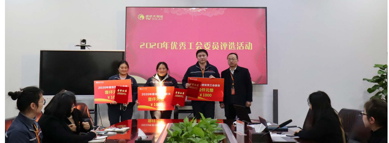
合肥基地合影留念