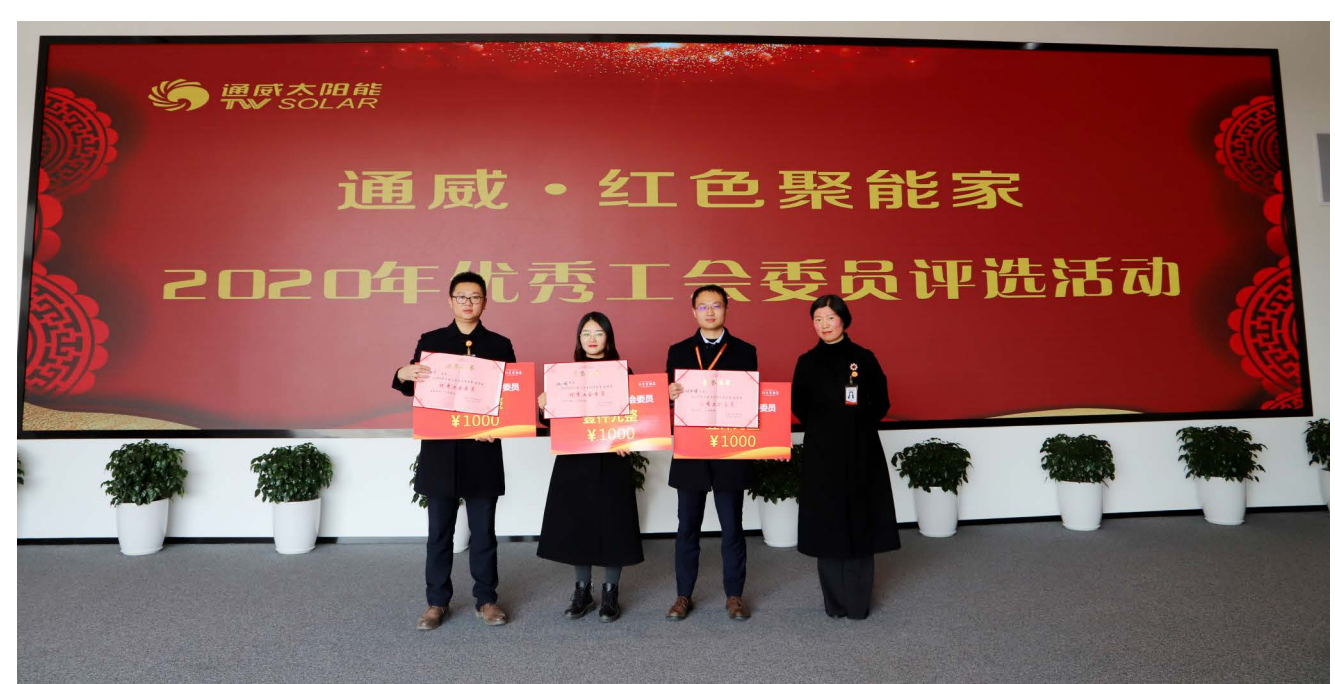
眉山基地合影留念