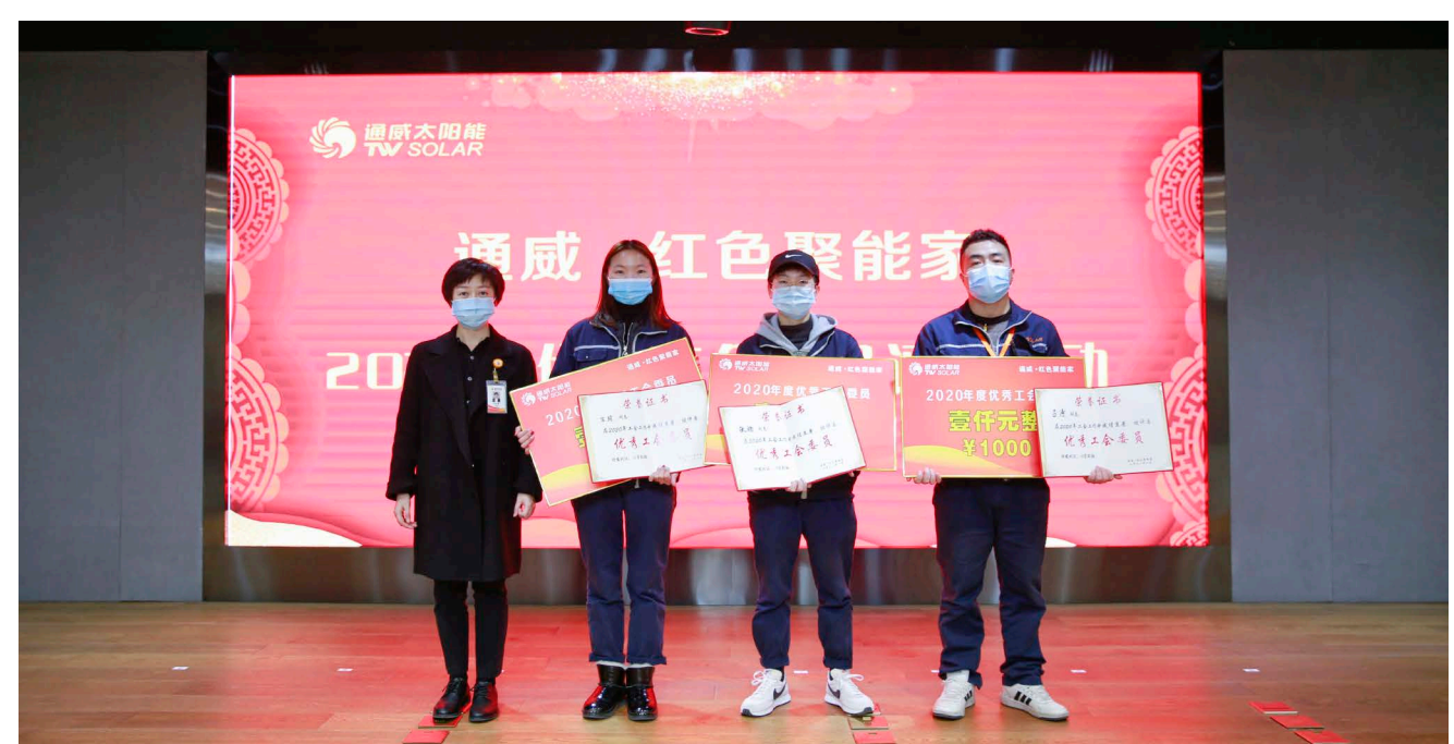
成都基地合影留念