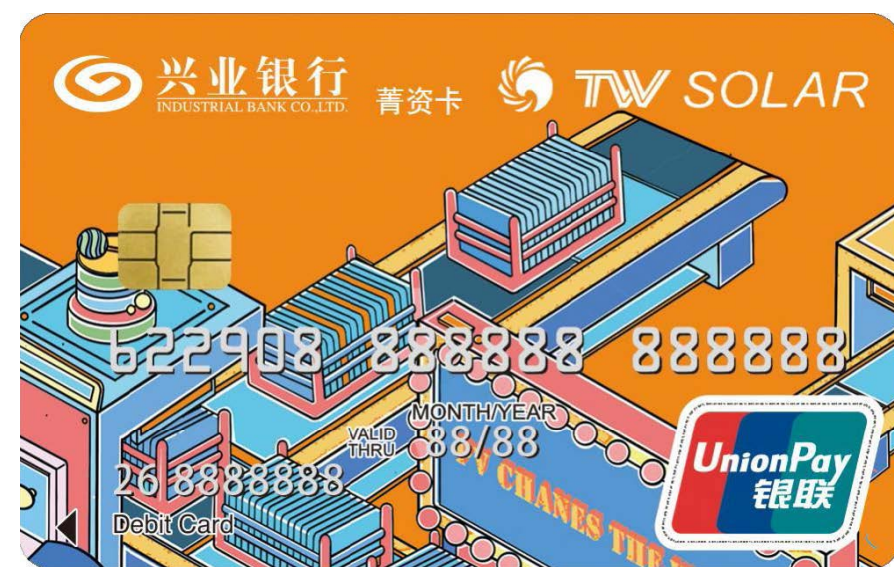
通威太阳能 & 兴业银行联名卡