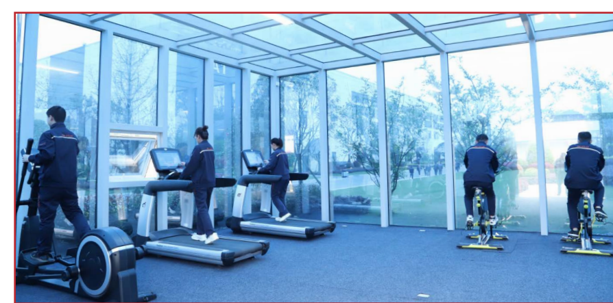
宽敞明亮的健身房