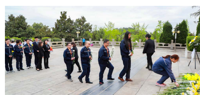
党员们为烈士敬献鲜花