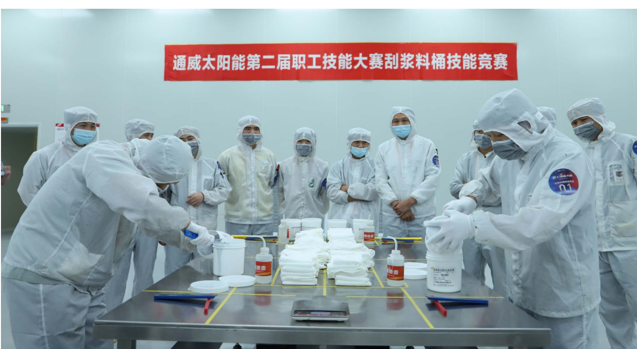
刮浆料桶技能竞赛现场

本报讯(通讯员 程良 张涛 徐志琴)人间四月,万物复苏,4月8日-4月15日,通威太阳能为期一周的第二届职工技能大赛成功举办,本次比赛以“赛技能亮点,展岗位风采”为主题,合肥、双流、眉山三地共计250余名选手积极报名参加,经过叉车、刮浆料桶、电工、电池片检验、消防共五个技能项目的激烈角逐,最终产生了单项冠军、亚军和季军各五名。