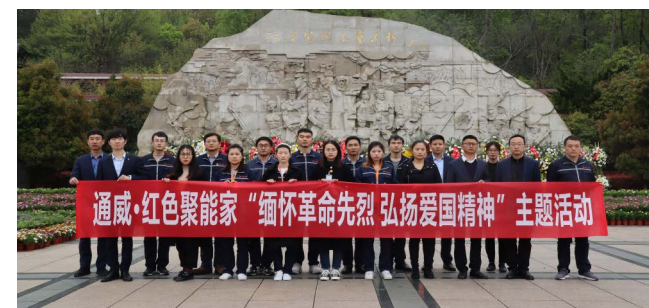
合肥基地合影留念