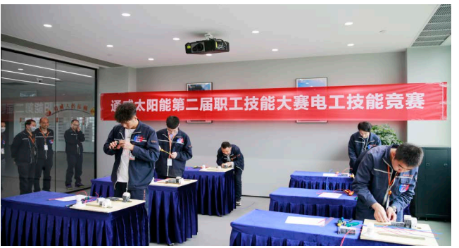
电工技能竞赛现场

此次比赛的冠军同时还荣获“通威太阳能第四届最美工匠”荣誉称号。其中冠军亚军分别获得奖金500元、300元、200元,所有参赛选手将按照公司最新企业文化管理办法进行企业文化积分加分奖励。