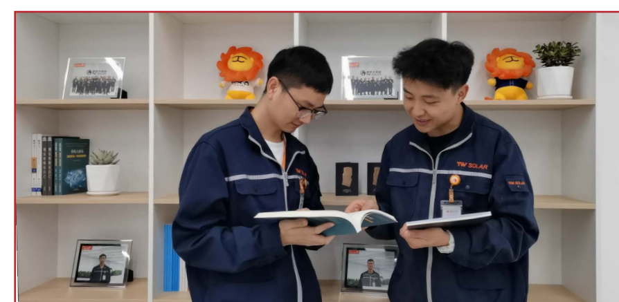
员工挑选自己喜爱的书籍阅读品研