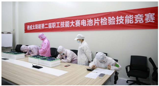
电池片检验技能竞赛现场