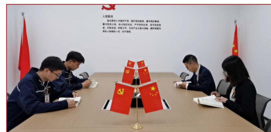
干净整洁的党工办公室

本报讯(通讯员 程鑫宇)4月20日,为更好服务公司员工,为员工切实感受“家”的温馨和温暖,通威太阳能眉山基地工会委员对党工区域硬件设施进行全面完善,建立规划“党工工作阵地”“母婴室”“医疗室”“劳动争议调解室”“心灵驿站”“休闲吧”“读书吧”“职工健身中心”等功能区域,全方位关爱职工,筑建温暖职工之家。总体项目面积约2000平米,由专人负责运行维护,一上线就圈粉无数,项目各个板块不仅丰富了员工业余生活,也使得员工在工作之余及时得到放松减压,受到员工一致好评。