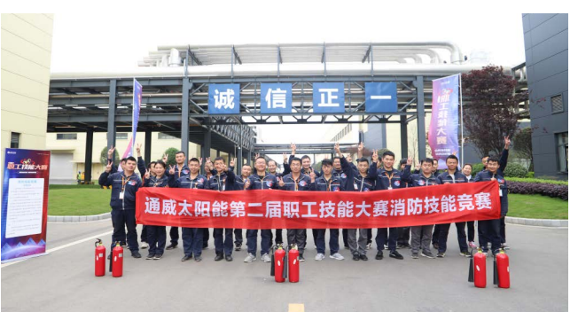
消防技能竞赛现场