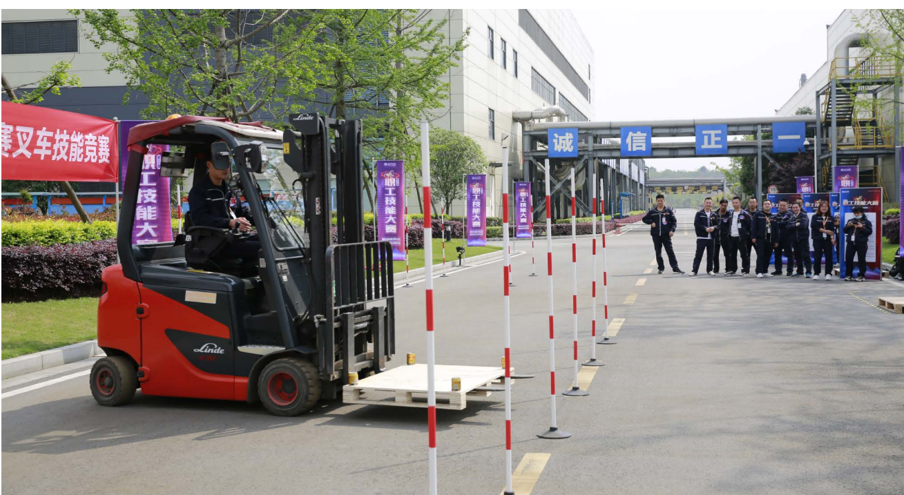
叉车技能竞赛现场