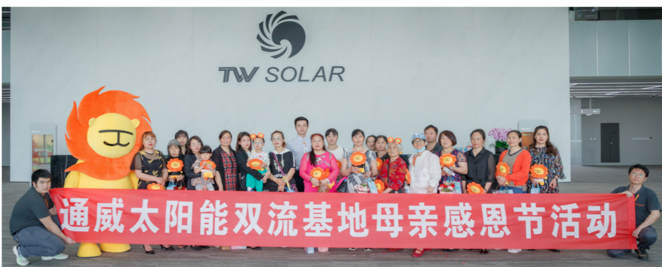
双流基地合影留念