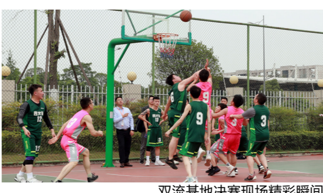
双流基地决赛现场精彩瞬间