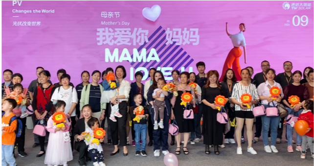
眉山基地合影留念

本报讯(通讯员 秦文 李慧 鲁二宝)为弘扬中华民族传统美德,提高员工素质,增强员工“孝道”意识,推动企业健康发展,5月8日,通威太阳能红色聚能家在母亲节来临之际,组织开展“浓情五月天·感恩母亲节”主题活动,来自合肥、双流、眉山基地的30余职工代表邀请其母亲、子女共计80余人参与活动。 本次活动首先通过线上平台发起倡议,号召员工参与活动,表达对母亲的感恩之情。报名成功的家庭由公司派专车接送至各基地,在各基地行政部工作人员的组织开展一系列活动。 活动中,员工及其家属先后参观了A1展厅智能制造生产车间、“红色聚能家”党工阵地、员工食堂、健身房等区域,进一步了解通威太阳能发展历程、行业地位及战略布局、企业文化建设、员工福利等基本情况。母亲们表示,通过这一次活动,