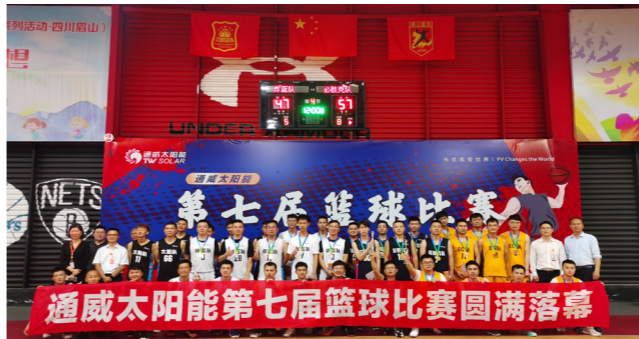
眉山基地合影留念

本报讯(通讯员 王守健 徐忠琴)5月20日,通威太阳能红色聚能家成功举办第七届篮球比赛圆满落幕。本届比赛历经初赛、半决赛和决赛三个阶段,共计30余场次的激烈比拼,诞生出各基地冠军季军队伍,并在当天决赛结束后举行颁奖仪式,通威太阳能各基地厂部负责人出席本次仪式并为获奖队伍颁奖。