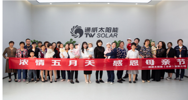
合肥基地合影留念

本报讯(通讯员 秦文 李慧 鲁二宝)为弘扬中华民族传统美德,提高员工素质,增强员工“孝道”意识,推动企业健康发展,5月8日,通威太阳能红色聚能家在母亲节来临之际,组织开展“浓情五月天·感恩母亲节”主题活动,来自合肥、双流、眉山基地的30余职工代表邀请其母亲、子女共计80余人参与活动。 本次活动首先通过线上平台发起倡议,号召员工参与活动,表达对母亲的感恩之情。报名成功的家庭由公司派专车接送至各基地,在各基地行政部工作人员的组织开展一系列活动。 活动中,员工及其家属先后参观了A1展厅智能制造生产车间、“红色聚能家”党工阵地、员工食堂、健身房等区域,进一步了解通威太阳能发展历程、行业地位及战略布局、企业文化建设、员工福利等基本情况。母亲们表示,通过这一次活动,