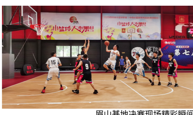
眉山基地决赛现场精彩瞬间