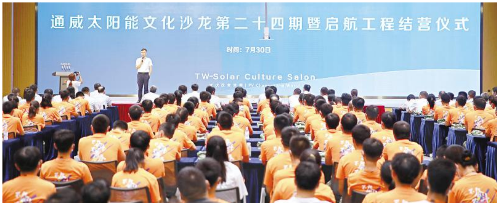
通威太阳能文化沙龙第二十四期暨启航工程结营仪式