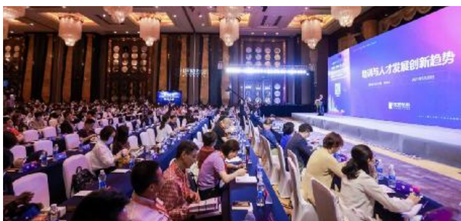
“人才发展菁英奖”颁奖现场