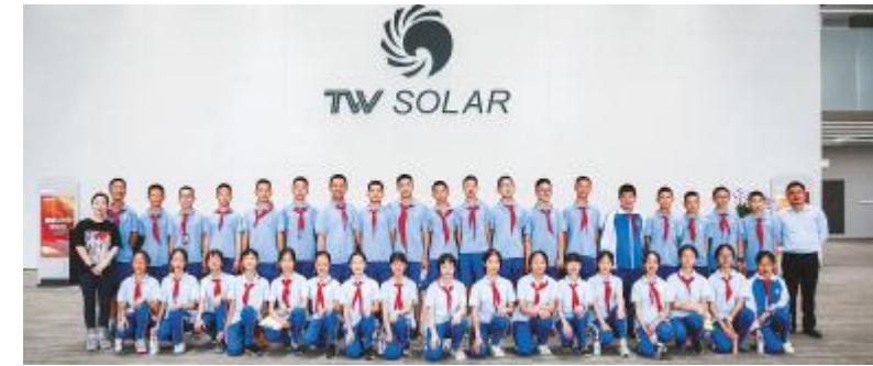
石室天府中学学子参观通威太阳能合影留念