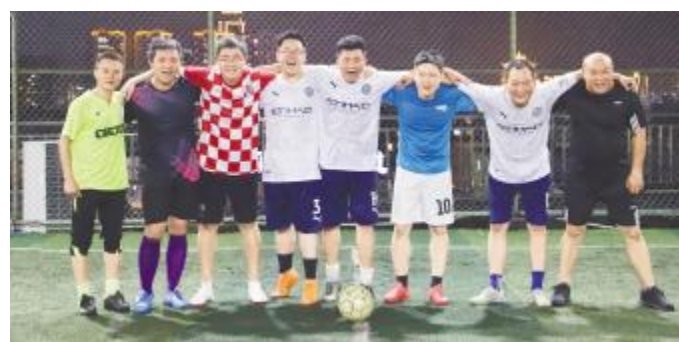
绿茵场上,运动员们尽情挥洒汗水

同时,各社团不定期开展外部交流活动,邀请各内部兄弟单位及外部单位进行交流赛。近日,通威太阳能眉山基地先后开展了篮球、乒乓球首届球技比拼活动,篮球、足球以分组对抗展开,乒乓球以单打的形式展开,现场气氛竞争激烈,并有大量的观众入场观看。