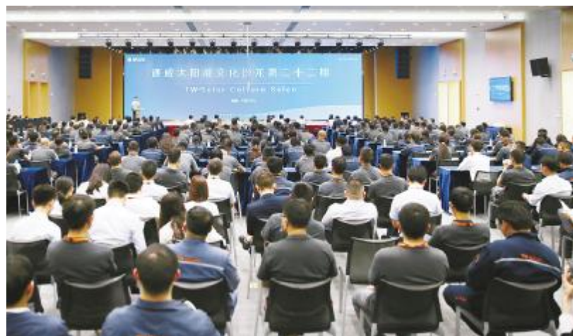
员工代表多维度诠释精益管理与创新思维如何为发展赋能