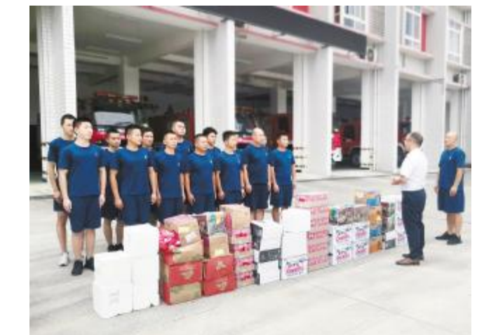
通威太阳能双流基地慰问消防官兵

在活动中,安全环境部负责人与消防官兵亲切交流,对消防官兵在高温下的坚守与付出,为西航港片区消防安全秩序的辛苦付出表达感谢,并表示公司将一如既往地支持消防工作,履行企业消防安全主体责任。消防官兵表示,将把爱心企业的关心爱护化为动力,一如既往地做好各项工作,发扬对党忠诚、纪律严明、赴汤蹈火、竭诚为民的优良作风,克服高温带来的困难,扎实工作,顽强拼搏,确保西航港地区消防安全稳定,不辜负人民群众和爱心企业的期望和厚爱。