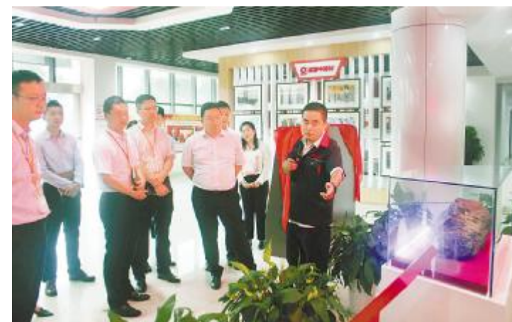
第二届储备厂长培养班学员参观建材光电材料有限公司展厅

双方围绕在快速发展时期如何充分发挥技术优势、提升管理水平、以降本增效为工作导向等热点议题展开了深入的探讨,进一步加深了对彼此行业的认知、对智能制造的理解、对光伏技术前沿话题的学习。