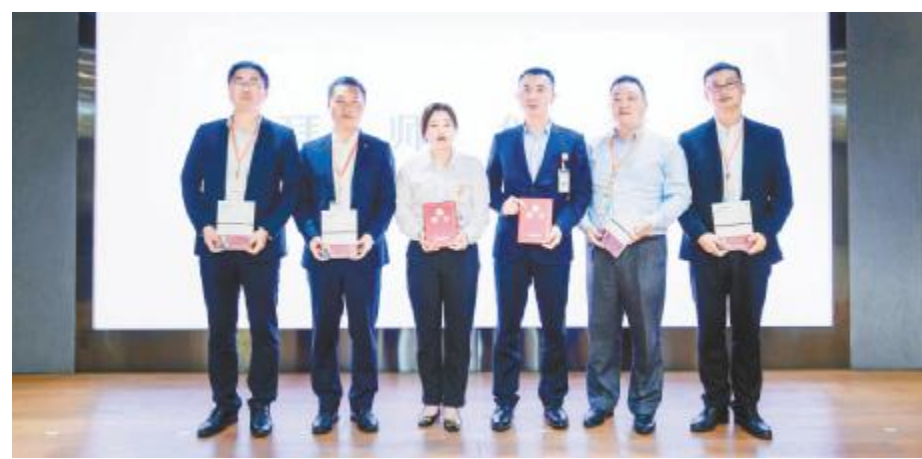
第二届储备厂长培养项目开班仪式现场