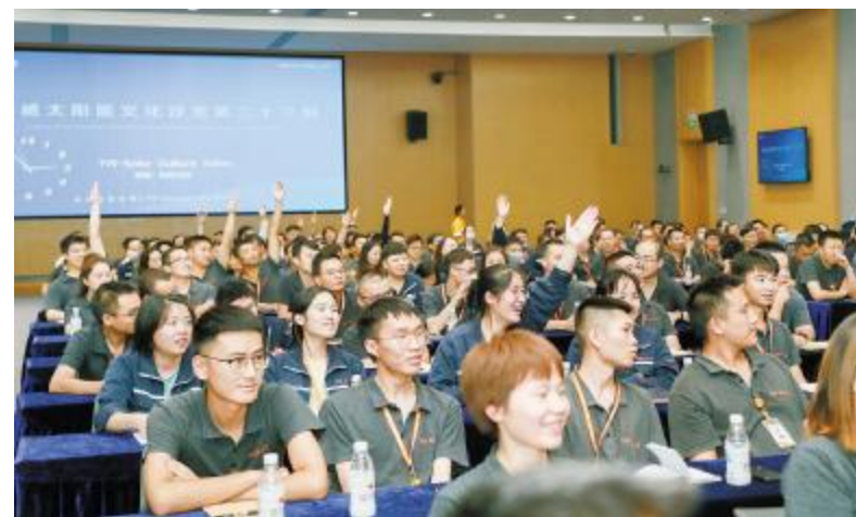
EHS 知识竞赛现场,员工们踊跃参与