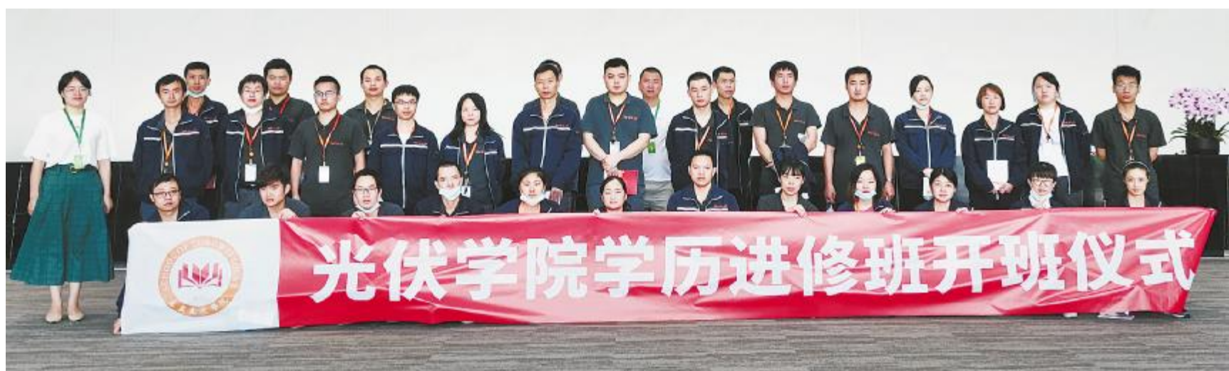
2021年学历进修春季班学员合影留念

作为公司人才培养体系的重要支柱,光伏学习中心关键岗位晋升人才培养项目春季班自3月开班以来,四地共开设1200门课程,共290名学员参与学习,沉淀了368个优秀案例,四地平均合格率超过85%的目标,培养项目满意度也均超出90%。值得一提的是,本次春季班还新增了行动化学习作业,创新了培养模式,加大了实操力度,通过理论与实践的结合,帮助学员快速提升。