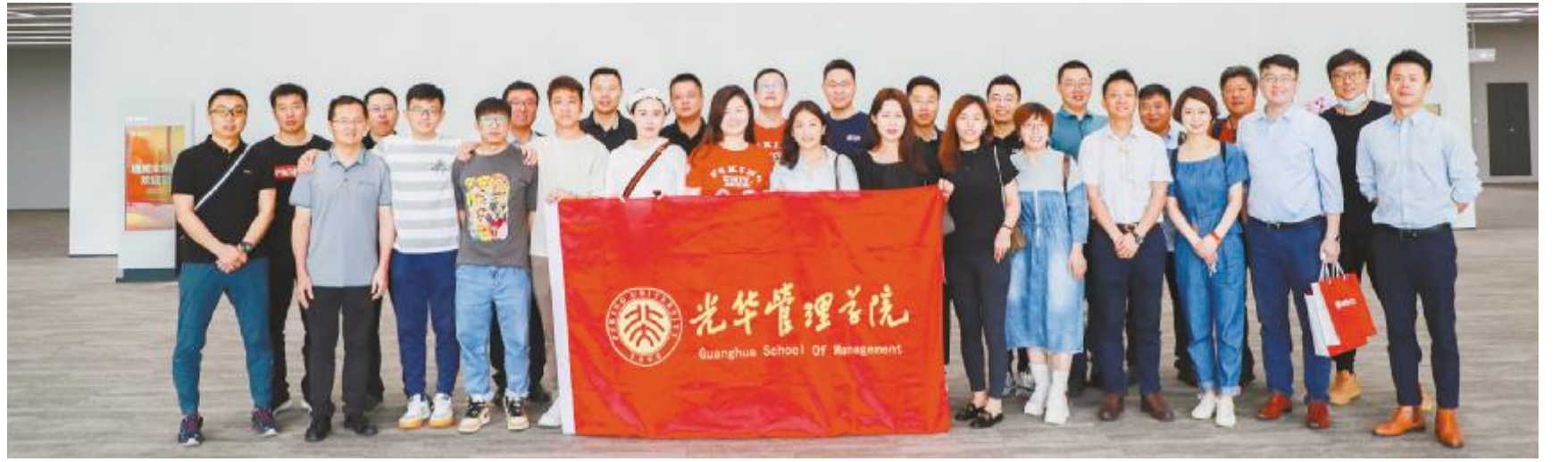
北大光华《中国经理人》学员合影留念