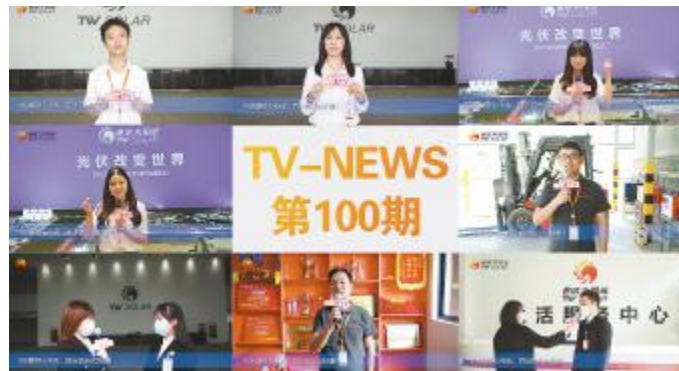
员工们为 TV-NEWS 100 期送祝福

光伏 TV-NEWS,从2019年8月24日第1期正式上线至今,已连续播出100期,浏览量累计超83万。光伏 TV-NEWS 是通威太阳能家人们的专属独家 TV,每周一期,周五准时推出,内容涵盖公司要闻、厂部动态、享受奋斗、拥抱危机、防危重安的企业文化活动和温馨提示6个模块,通过“家庭同乐日”“司庆活动”“厨王争霸赛”“篮球赛”“生日会”“知识竞赛”“主题征文及演讲比赛”等大型特色企业文化品牌活动,以视频的方式,通过员工服务平台,将当周的企业文化要事传递给每一位员工,深受员工喜爱,营造了良好的文化氛围,让每一位奋斗中的通威人都成为企业文化的传承者。