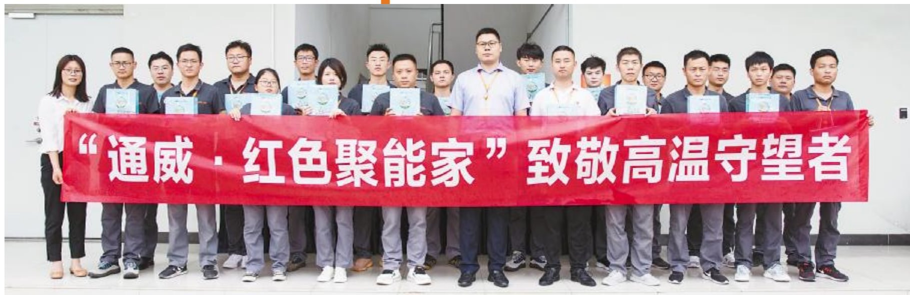
“致敬高温守望者”活动合影留念

企业的发展,离不开“安全”二字,而安全也是一个企业良性快速发展的基石。面对新一轮的机遇与挑战,安全更加不能忽视。通威太阳能通过百日安全大作战、签订安全责任书、致谢为安全生产保驾护航的消防官兵等活动,强化安全意识,筑牢安全防线。