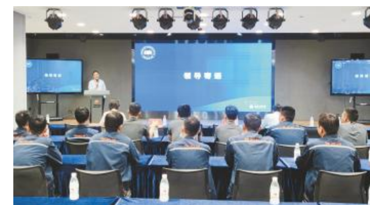
生产主管培养项目现场

“管理者应具备的素质”和“管理者应具备的能力”的讲授环节中,讲师引入基础的管理工具,展开阐释管理者所需具备的沟通、计划、协调、学习等能力维度。