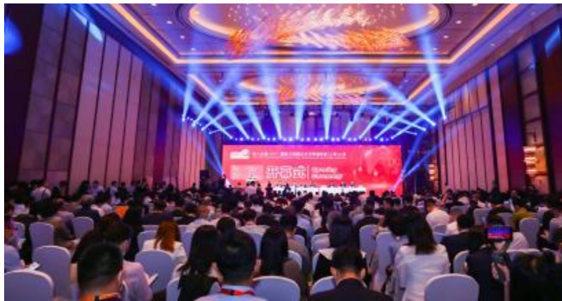
“APVIA 亚洲光伏奖 - 人才培养奖”颁奖现场