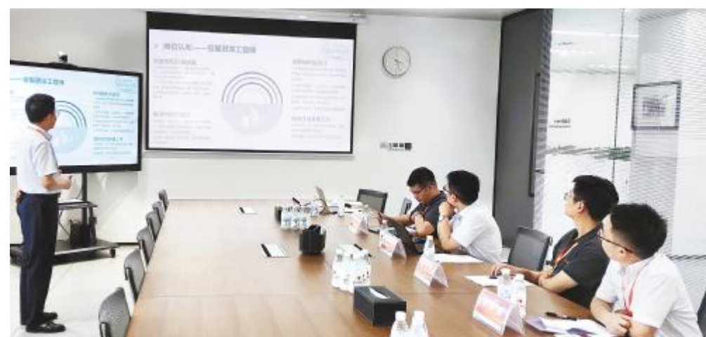
生产体系技术序列 2021 半年晋升评定工作现场