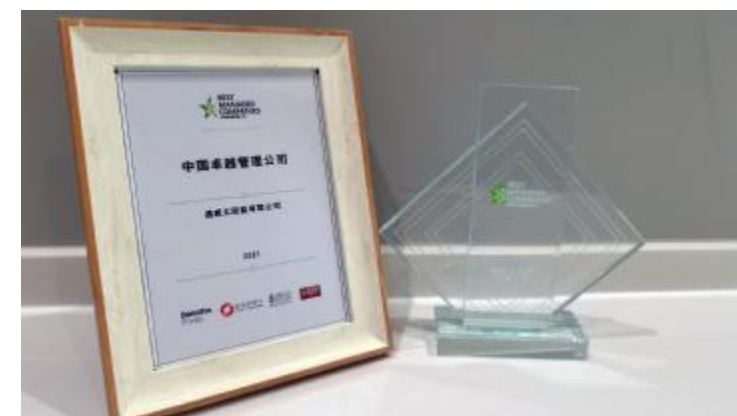
通威太阳能入选“2021 中国卓越管理公司新晋获奖企业”榜单

未来, 通威将一如既往, 勇担社会责任, 不忘“光伏改变世界”使命, 基于全球化视野, 携手德勤, 完善协同一体化管理, 夯实资源整合能力, 为发展成为全球新能源领军企业不懈努力。