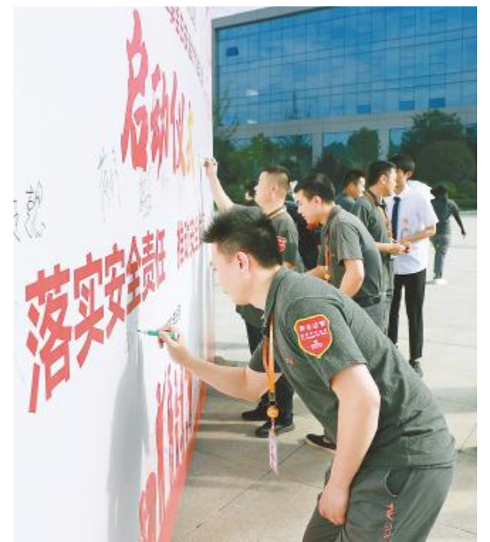
安全生产月暨第二季百日安全大作战活动启动仪式

安全是员工的生命线,员工是安全的负责人,安全问题与每个人都息息相关。一年一度的“安全生产月”是通威太阳能提升安全管理的重要契机和载体。通过开展形式多样的“安全生产月”活动,营造良好的安全生产氛围,持续强化员工安全意识和提升员工安全素养。