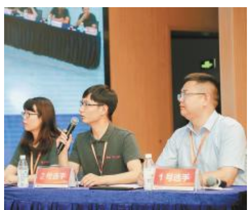
各基地代表队精神饱满参与 EHS 知识竞赛