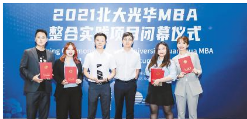
通威太阳能与北大项目整合实践项目圆满结题

在整合实践项目中,通威太阳能根据自身需求设计提出真实课题,在北大教授团队的指导和团队的共同努力下形成切实可行的报告方案,不仅可解决公司面临的实际问题,同时也提升员工的管理能力。本次整合实践项目的成功合作,不仅为未来光伏学习中心与国内顶级院校保持交流互学建立纽带,更为未来公司业务更新迭代及赋能创造新可能!