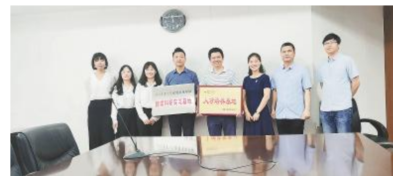
通威太阳能与川农水利水院共建教学科研实践基地

为了解光伏新能源的产业优势,以及通威在光伏领域取得的发展成果与经营管理优势,北京大学光华管理学院《中国经理人》、四川农业大学、成都市石室天府中等专业学校学子,先后走进通威太阳能,了解公司作为光伏行业龙头企业所拥有的创新电池片技术、智能制造生产线和独具通威特色的企业文化,并在增进了解的基础上,建立全新的校企合作模式,助力人才联合培养工作再上新台阶。