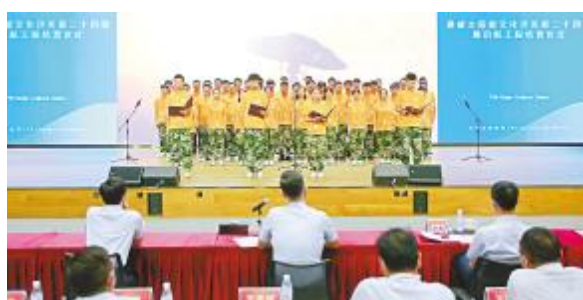
学员们进行才艺展示

“启航工程”人才培养项目是通威光伏学习中心创新人才培养体系的重要举措。该项目自2016年启动至今, 累计将600余名校招培养为公司骨干, 有效支撑了公司快速发展对内培人才的需求, 为推动公司战略落地做出了巨大贡献, 也成为公司雇主品牌形象建设的一张亮丽名片。