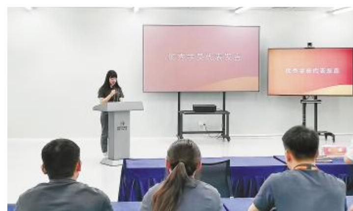
储备技术员培养项目优秀学员代表发言

为了生活更美好不断前行,并向新生颁发了录取通知书,最后开学典礼在新生庄严宣誓中圆满结束。随着公司的快速发展以及行业间的竞争不断加剧,学历已经成为一个人在某一领域知识是否有储备或是否受到相应教育的反映。为更好的激励员工不断进步,为员工在公司的职业发展奠定更坚实的基础,光伏学习中心从2017年便启动了员工学历进修项目,至今已帮助600余名员工实现大学梦。