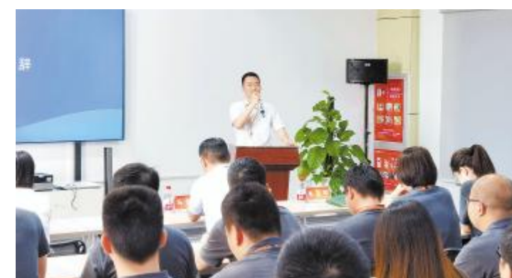
关键岗位储备人才培养项目春季班结业仪式合肥基地业务领导讲话

在寄语环节,部门负责人对储备技术员人才培养项目给予高度肯定和支持,表示本培养项目作为光伏学习中心人才培养体系的重要一环,旨在打通操作序列往技术序列的发展路径。学员被选拔进班培养,将通过线上理论课程学习和导师实操带教相结合的方式展开学习,夯实基础,提升岗位专业能力,帮助学员更有效地处理业务一线的实际问题,尽早完成角色转变和岗位转变。