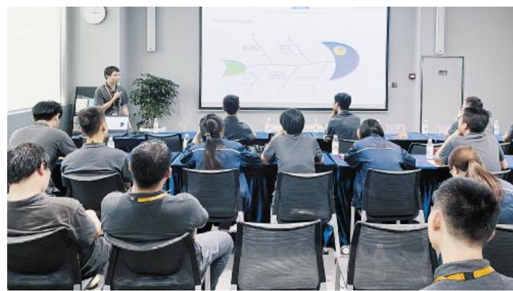
技术案例沙龙现场