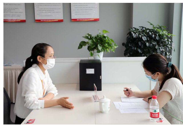
检查小组进行一对一座谈

本报讯(通讯员 辜波 崔美珂)在日前举行的第四届成都市“百佳”职工创客明星评选活动中,通威太阳能双流基地共有3名创客明星进入复审环节。8月24日,根据成都市总工会统一安排,来自天府新区总工会的百佳创客明星复审交叉检查小组莅临双流基地,就3位创客明星候选人展开实地走访核查,对候选人基本情况、项目真实性、经济社会价值等多个维度进行综合评审。