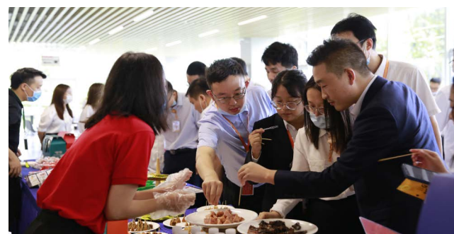
员工现场试吃各种产品