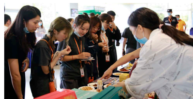
员工代表详细了解套餐种类

本报讯(通讯员 崔美珂 程良)在中秋佳节即将到来之际,为充分落实员工福利发放、展现通威关怀,给员工更好的节日慰问,通威太阳能工会联系多家供应商准备了丰富的中秋福利方案并在8月18日、8月19日面向合肥、双流、眉山、金堂四基地员工举办中秋福利品鉴及投票活动。