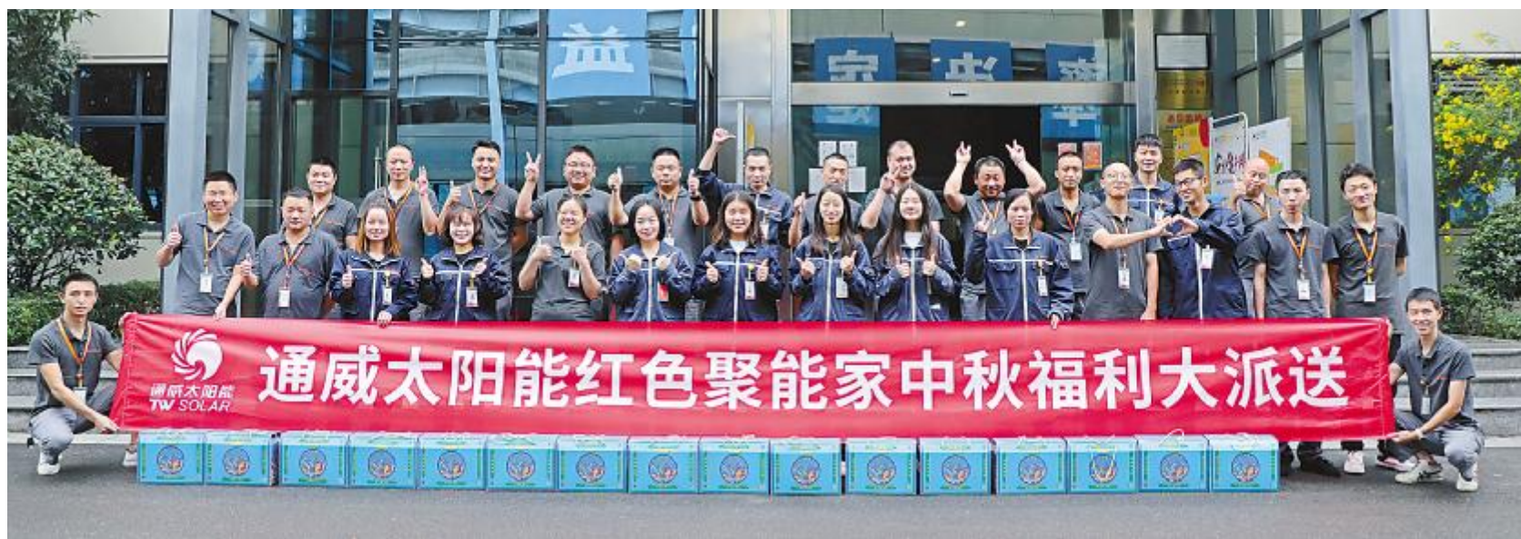
花式点赞比心,祝福中秋快乐