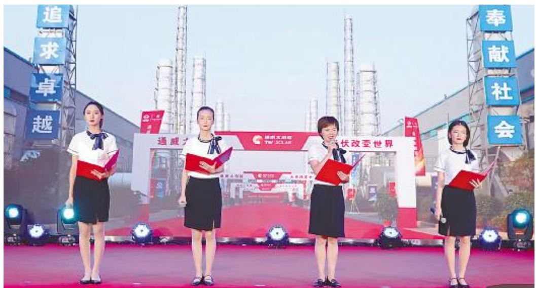
通威太阳能诗歌朗诵现场

脚踏实地、持之以恒,战战兢兢、如履薄冰 透过微小尘埃遥望浩瀚星河 危机文化早已深深烙印心底 宛如迷雾中的灯塔指引方向 从小耳濡目染,父亲成了她心中榜样 当她成为母亲,她又成为孩子的榜样 通威文化就像一串省略号 点滴渗透、不断影响着家里三代人