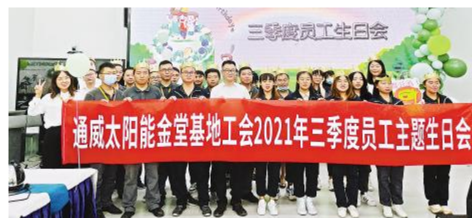
2021年第三季度员工生日会金堂基地合影留念