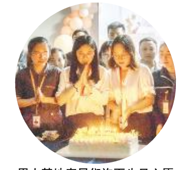
眉山基地寿星们许下生日心愿