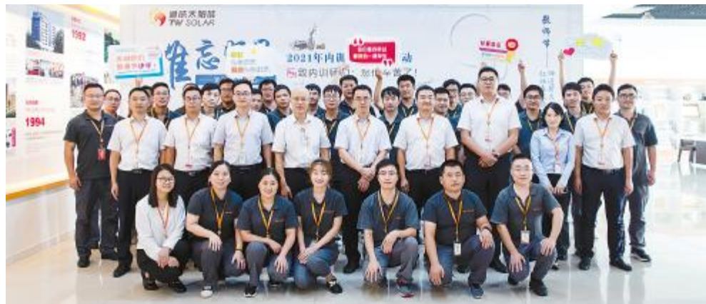
2021年内训师授证仪式合肥基地合影

第二十五期文化沙龙暨质量月主题演讲比赛总决赛以“我眼中的榜样”为主题,比赛现场,选手们或娓娓道来,或慷慨激昂,分享了他们眼中的榜样故事。不同时代的榜样虽有不同,但都具有共同的闪光点,坚定的信念、踏实的脚步、执着的追求,都是榜样的力量。榜样是“千磨万击还坚劲,任尔东西南北风”的坚守;是“黄沙百战穿金甲,不破楼兰终不还”的执着;是“春蚕到死丝方尽,蜡炬成灰泪始干”的朴实;还是“青,取之于蓝而胜于蓝”的传承。希望通过本次文化沙龙的举办,传承榜样力量,树立榜样标杆,不断超越自我,成为无畏将来的通威人,助推公司高质量发展。