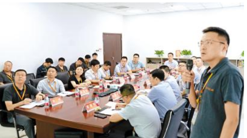
2021年第三季度TQM评审会合肥基地现场