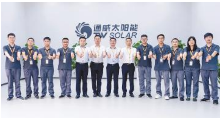
合肥基地多晶团队

在通威集团39年庆诗歌朗诵会暨十大表率颁奖仪式上,通威集团董事局刘汉元主席致辞时表示,企业文化成为了所有通威人的精神引领。我们始终强调“表率是最好的领导方法”,没有之一,是最好。此次颁奖,通威太阳能合肥基地、双流基地、眉山基地共计六组代表荣获通威十大表率。他们是平凡岗位上的追光者,也是光伏道路上的追梦人,让我们一睹他们的风采。