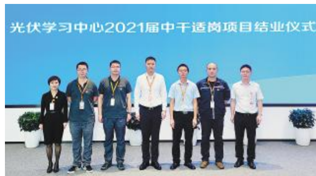
2021届中干适岗培养项目结业仪式眉山基地合影