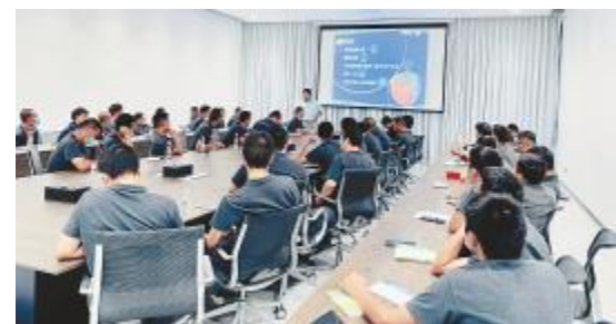
金堂基地应急药品使用培训

通过首轮评审的作品将在后续进行线上评比,最终由基地全员投票,为更多同事提供一个了解和安全生产知识的平台。活动结束后,基地为获奖同事颁发荣誉证书和精美礼物,鼓励其带动身边同事强化安全责任意识。