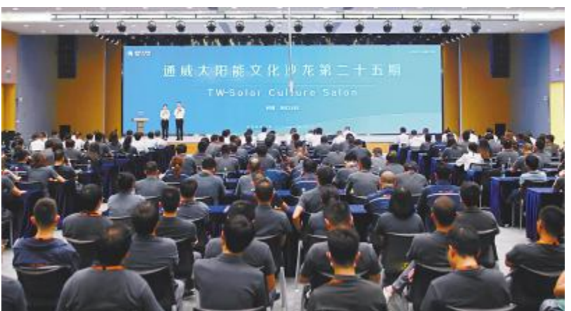
第二十五期文化沙龙暨质量月主题演讲比赛总决赛现场