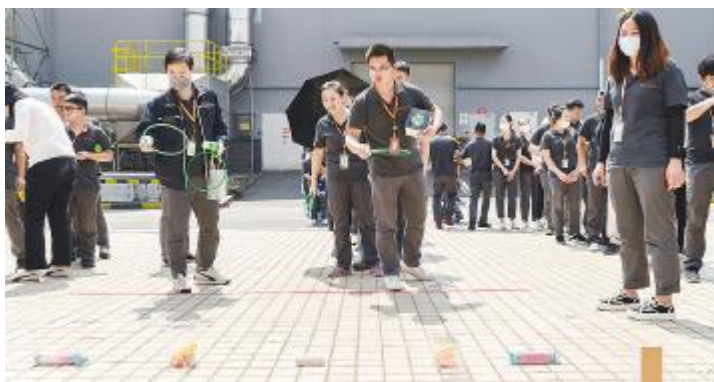
套圈游戏现场员工大展身手