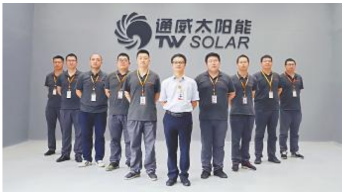
眉山基地电池一厂

合肥基地多晶团队是通威太阳能组建最早的团队。八年来,团队始终坚持“精细管理降成本,持续创新赢市场”的目标,以“对标管理”为方法,不断提高产品质量,降低非硅成本。面对多晶设备不断的老化,深入贯彻“防危重安”理念,完善各项安全管理工作,安全零事故。在团队建设和人才培养方面,优选重用,赋能培训,为公司的发展提供坚实的人才储备。八年奋进路,逐梦多晶人。在光伏改变世界的路上,多晶团队将永葆初心、砥砺前行,在实现“碳中和”的青山绿水中画上浓墨重彩的一笔。