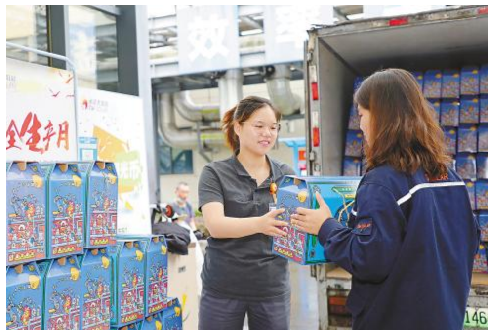
满满中秋礼,送出公司的诚意与祝福