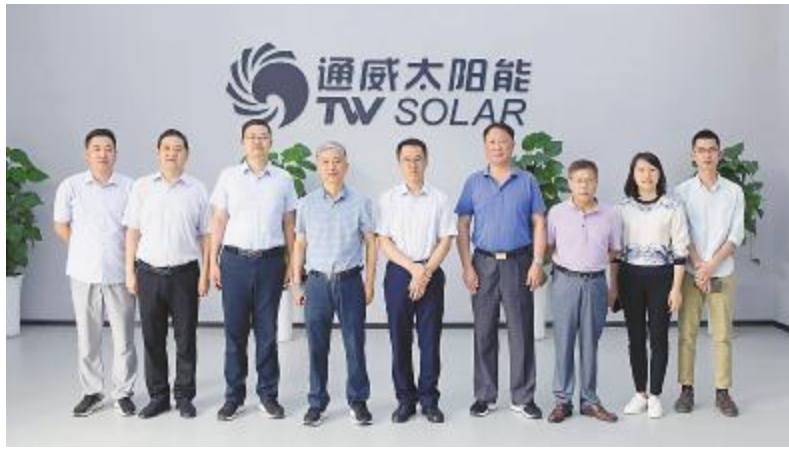
安徽省应急管理厅副厅长汪黎明调研通威太阳能合肥基地