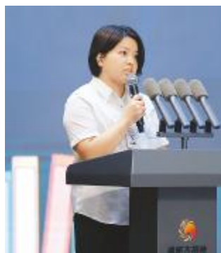
内训师代表分享心得