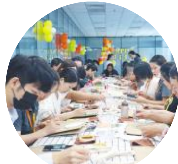
合肥基地寿星们DIY限量版帆布包

小小的生日会凝聚着公司对员工的关怀,也是对努力付出的奋斗者给予的肯定和感谢。一直以来,通威太阳能致力于塑造优良的企业文化,营造温馨舒适的工作环境。未来也将继续积极开展形式多样、内涵丰富的活动,进一步增进与员工间的互动与交流,让每一位员工都能感受到家的温暖。