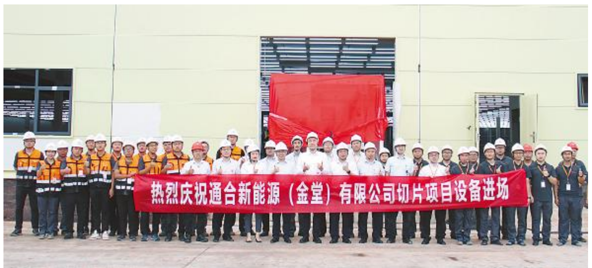
通合新能源(金堂)有限公司切片项目设备顺利进场

必将致力于推进绿色工厂和智能工厂建设,推动企业转型升级,提升技术装备水平和质量效益,努力深化“绿色发展”对各行各业的影响,努力用好“数字化”手段助力我国乃至全球碳中和目标早日实现。