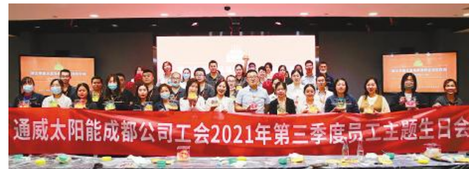
2021年第三季度员工生日会双流基地合影留念