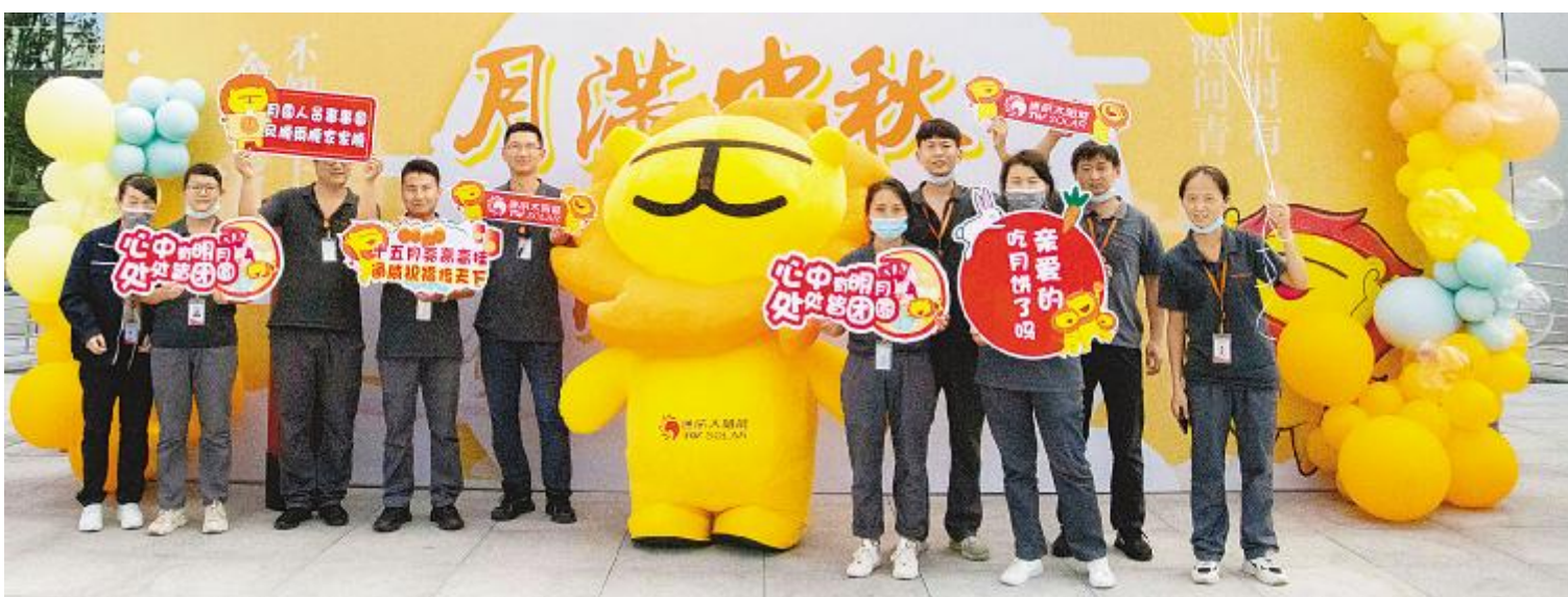
吉祥物“阳光仔”吸引大家打卡拍照