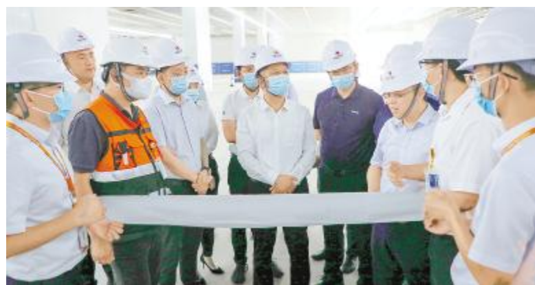
天合光能董事长高纪凡莅临通威太阳能参观交流

在通合新能源项目建设现场,高纪凡董事长详细听取了项目建设进度、技术水平、配套设施等情况的介绍,并走进通威太阳能金堂基地 A1 展厅、智能