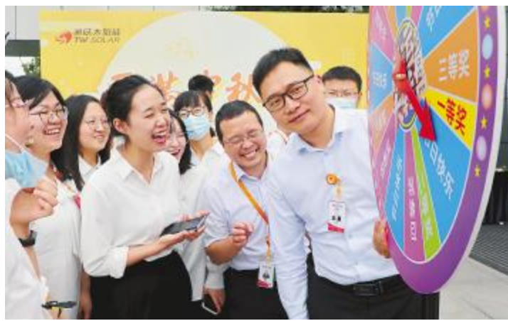
员工欢快地转动幸运大转盘

让节日的氛围愈发浓厚。活动结束后,员工们纷纷表示,要继续发扬团结拼搏、开拓创新的精神,以崭新的风貌和昂扬的斗志投身到工作中。此外,通威太阳能还开展了“共筑光伏梦·守护中秋月”主题发声活动。作为光伏行业龙头企业,通威太阳能积极践行社会责任,号召社会公众一起为环保发声,为中华民族千年优秀传统文化传承和守护发声。活动受到广泛关注及热烈响应,公司也选取点赞前5的粉丝及活动组委会选出的1名粉丝获得原创文创惊喜大礼包。