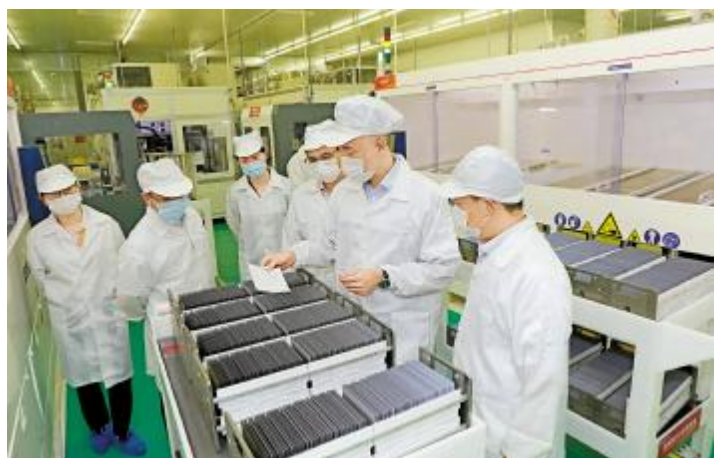
通威太阳能高管团队在电池车间了解节日期间生产情况

中秋佳节前收到公司的这份“心意”,既暖心也开心,将更加积极、努力、向上投入自身岗位,勇担责任,再接再厉,与公司一起共筑光伏梦,笃定碳中和。 通威太阳能自成立以来,高度重视员工人文关怀,深入落实“奋斗者关爱”文化,每逢佳节都会根据员工喜好为员工们发放贴心、实惠的福利礼盒,增强公司凝聚力,提高员工以企业为家的“主人翁”意识,使员工们感受到家一般的温暖。通威太阳能工会——红色聚能家将一如既往地以员工为核心,传承“家”文化,更好地服务员工、关爱员工,在企业文化建设、职工队伍素质建设、员工保障关爱等多方面发挥“聚能、聚家、聚梦”的作用,为公司发展凝聚更大力量!