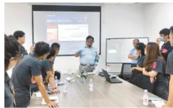
双流基地组织开展应急物资使用专项培训