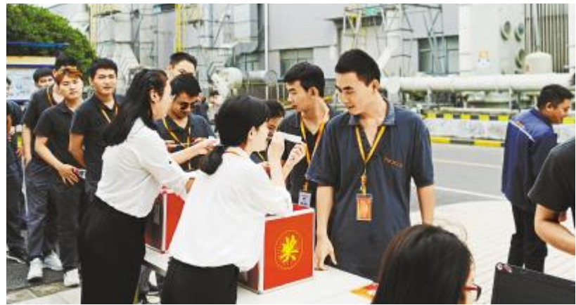
质量知识竞赛活动,员工踊跃答题赢礼品