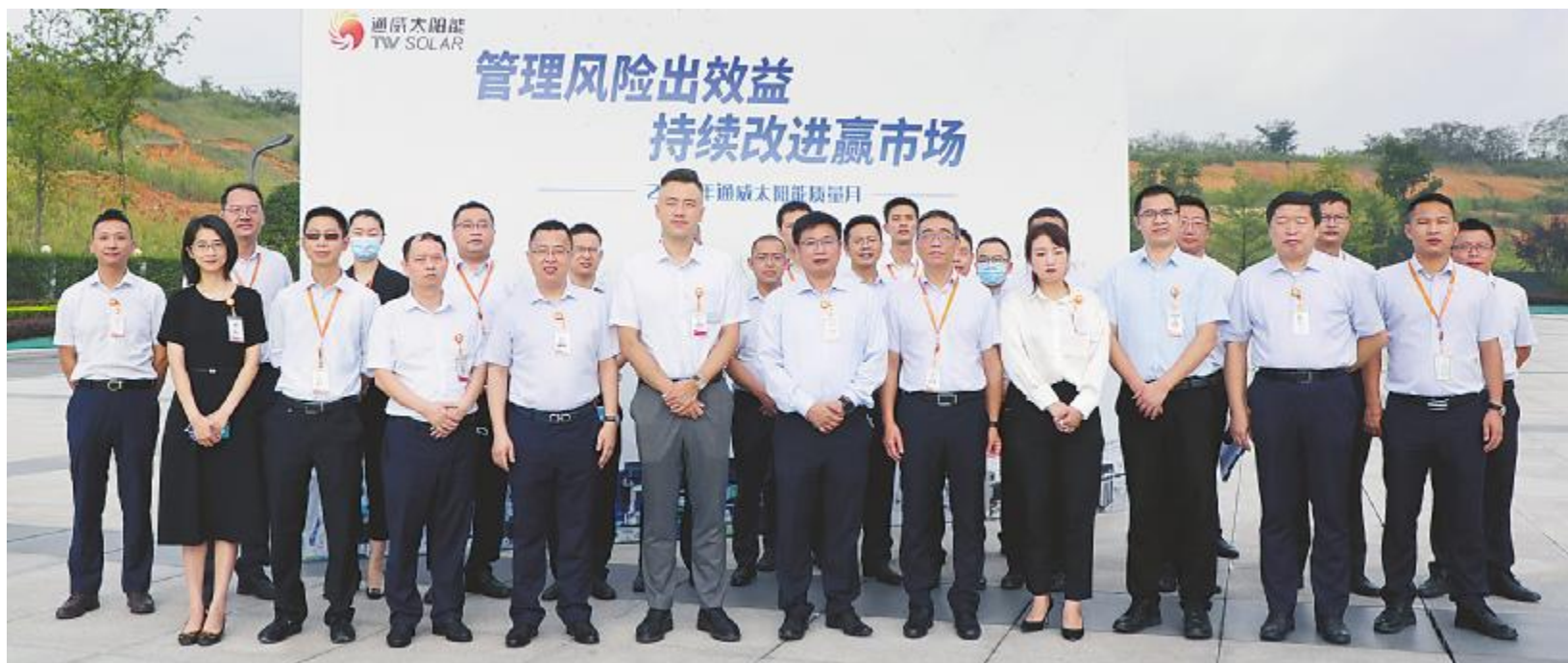
通威太阳能2021年质量月启动仪式双流基地现场