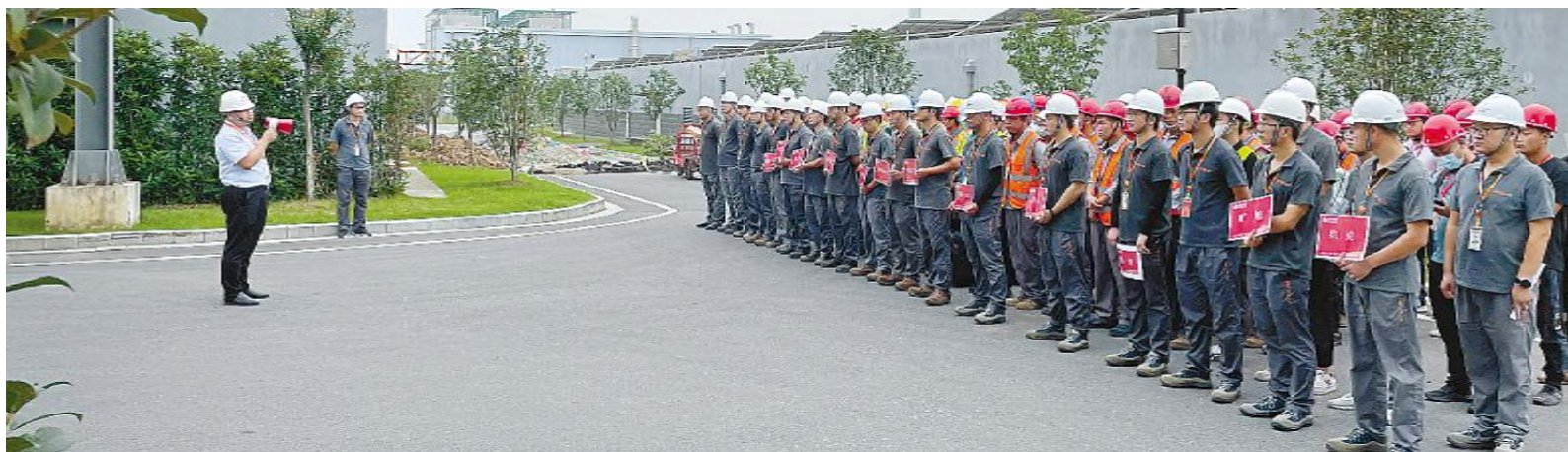
季度维保现场,合肥基地厂务部负责人向检修人员进行安全交底