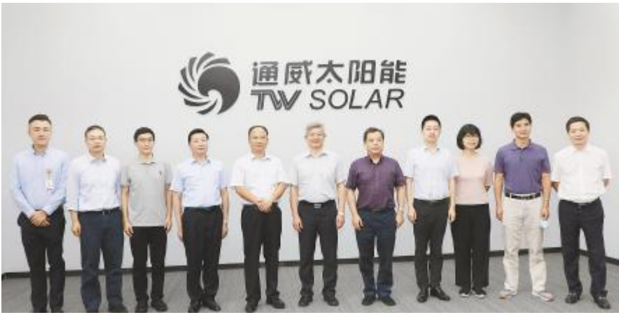
全国工商联党组书记、副主席樊友山调研通威太阳能双流基地

全国工商联党组书记、副主席樊友山,安徽省应急管理厅副厅长汪黎明,佛山市南海区委书记闫昊波调研通威太阳能