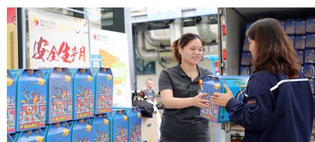
员工领取福利礼包

本报讯(通讯员 唐婷婷 徐忠琴 崔美珂 程良)中秋将至,月满情浓,为弘扬传统文化,感谢全体员工为公司发展付出的辛勤努力,9月16日,通威太阳能合肥、双流、眉山、金堂四基地组织开展“红色聚能家中秋福利大派送”活动,为广大职工送去节日祝福。 9月16日上午,在各基地工会及委员的有力组织下,在各部门文员的有序配合下,满载福利的车队有序入场,各点位卸货、清点、发放一气呵成,顺利将10000余份礼盒送到基地员工手中。 月满中秋,情满通威。沉甸甸的礼盒是公司全体员工满满的节日祝福,也是对大家辛勤工作的肯定和慰问。在福利发放