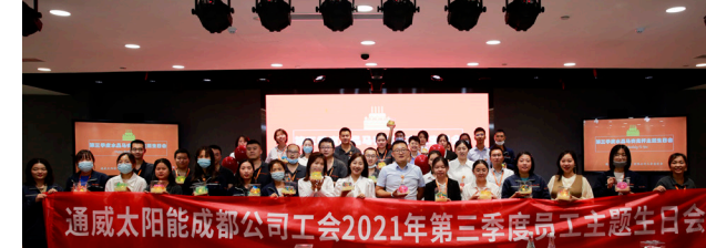
双流基地合影留念