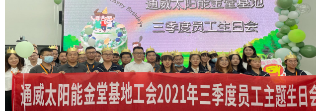
金堂基地合影留念

本报讯(通讯员 徐忠琴 唐微丽 程良 全芳)9月23-25日,通威太阳能合肥、双流、眉山、金堂基地先后举办了2021年度第三季度员工生日会。 伴着生日歌,员工生日会正式开始,工作人员播放了工会为寿星们精心准备的生日祝福视频。随后,为了让寿星们玩得开心,现场开展了“猴子上树”、“蒙眼敲锣”“吹纸牌”等游戏,寿星们积极参与,乐在其中,用笑声和欢呼声营造了一片欢乐和谐的氛围,各基地寿星们玩得不亦乐乎。