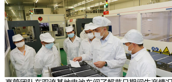
高管团队在双流基地电池车间了解节日期间生产情况