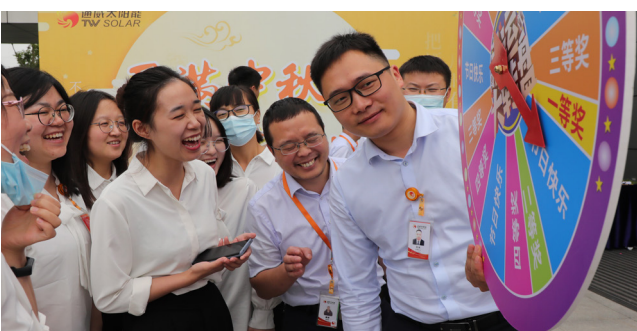
员工开心地转动幸运大转盘