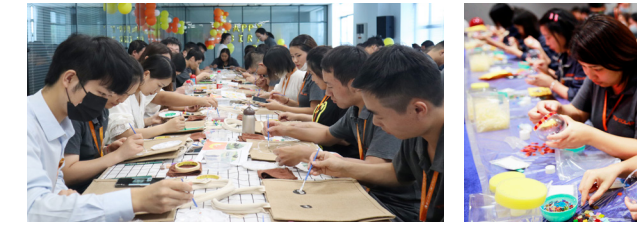
合肥基地寿星们DIY限量版帆布袋