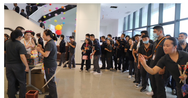
投篮游戏让员工体验“穿越”的乐趣

本报讯(通讯员 程良 徐忠琴 崔美珂 唐微丽)秋风送爽,丹桂飘香,为给奋斗在岗位上的广大员工营造团结和谐的工作氛围及浓厚的节日氛围,加强员工间的互动交流,弘扬通威“家”文化,9月17日,通威太阳能开展“月满中秋 情满通威”主题活动。 活动设有打卡集赞“挣”积分、“信”圆中秋爱满满、趣味投篮“礼”多多、喜欢你“套”住它、爱的魔力“转”圈圈、“中秋月饼DIY”、“趣味灯谜猜起来”等环节,每个主题活动的摊位前都排着长龙,活动现场十分火爆,节日氛围拉满,赢得游戏的欢呼声此起彼伏,到处洋溢着欢声笑语。 公司可爱的吉祥物“阳光仔”成为大家竞相合影的宠儿,一张张逗趣的中秋活动照片,员工们纷纷打卡通威中秋活动现场,让节日的氛围愈发浓厚。活动结束后,