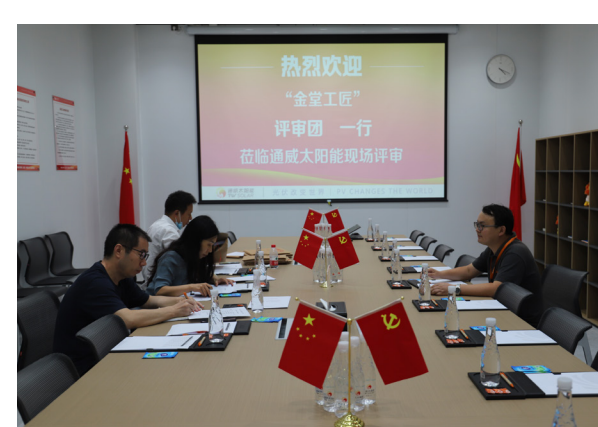
“金堂工匠”评审现场

本报讯(通讯员 唐微丽)在日前举行的2021年度“金堂工匠”评选活动中,通威太阳能金堂基地共有8名一线职工进入现场复审环节。9月23日,根据金堂县总工会统一安排,来自金堂县总工会的专家评审团莅临金堂基地,就8位“金堂工匠”候选人展开实地走访核查,对候选人基本情况、事迹真实性、行业贡献价值、人员培养输出等多个维度进行综合评审。 本次进入复审阶段的8名候选人均来自一线岗位,他们中有的具有工艺专长、掌握高超技能,技艺精湛、精益求精,有的严谨细致、专业敬业,长期坚守在生产服务一线岗位。在评审现场,评审团的专家与候选人开展了一对一座谈交流,大家根据平时的工作情况诚恳回答,现场氛围轻松。座谈结束后,评审团将搜集的信息进行汇总整理,并表达了对公司积极配合相关工作认可的肯定。 通威太阳能金堂基地发电核心产品的研发、制造和推广,具备良好的人才培养环境和扎实的创新能力。在今后工作中,公司将继续大力弘扬劳模精神、劳动精神、工匠精神,着力构建规模结构与产业发展相适应的高素质技能人才队伍,助推公司高质量发展。