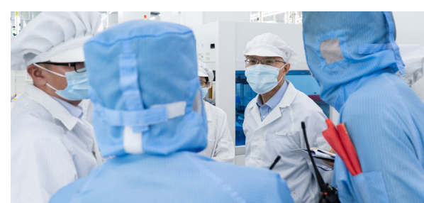
高管团队在合肥基地电池车间了解节日期间工作安排