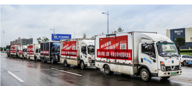
满载福利的车辆缓缓驶入厂区