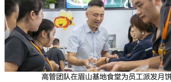
高管团队在眉山基地食堂为员工派发月饼