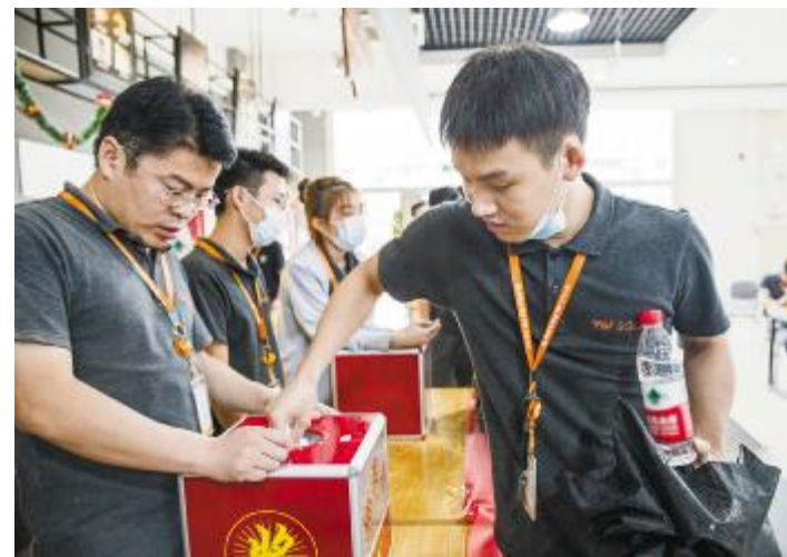
“安全环保十大禁令”主题活动现场,员工抽取答题条