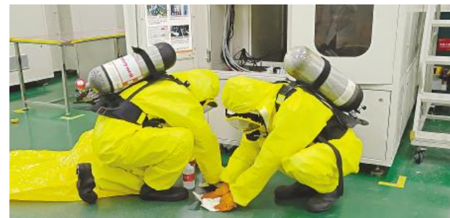
合肥基地三氯氧磷泄漏应急演练现场

在眉山基地开展消防疏散综合应急演练现场,警报响起,各工序员工及行政班员工有序从就近安全出口进行撤离。到达紧急集合点后,由各主管人员清点人员及所辖区域运营安全异常,并将相关数据逐级汇报。演练过程从报警、启动预案、人员疏散、紧急集合清点人数等做到了一气呵成,按要求完成了逃生疏散等任务,达到演练预期效果。通威太阳能始终将安全生产与环境保护作为公司生产发展的首要任务。后期,眉山基地将进一步夯实公司安全生产基础管理工作,提高员工安全意识,为公司安全文化建设奠定坚实基础。