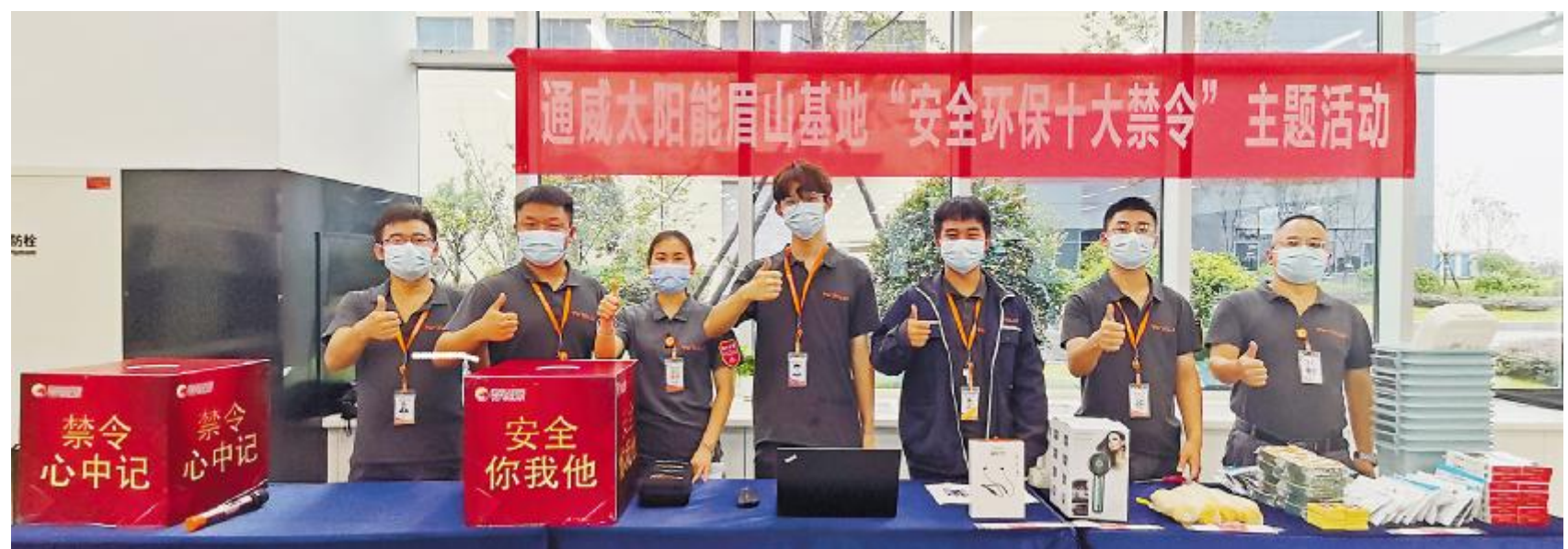
眉山基地员工点赞“安全环保十大禁令”活动