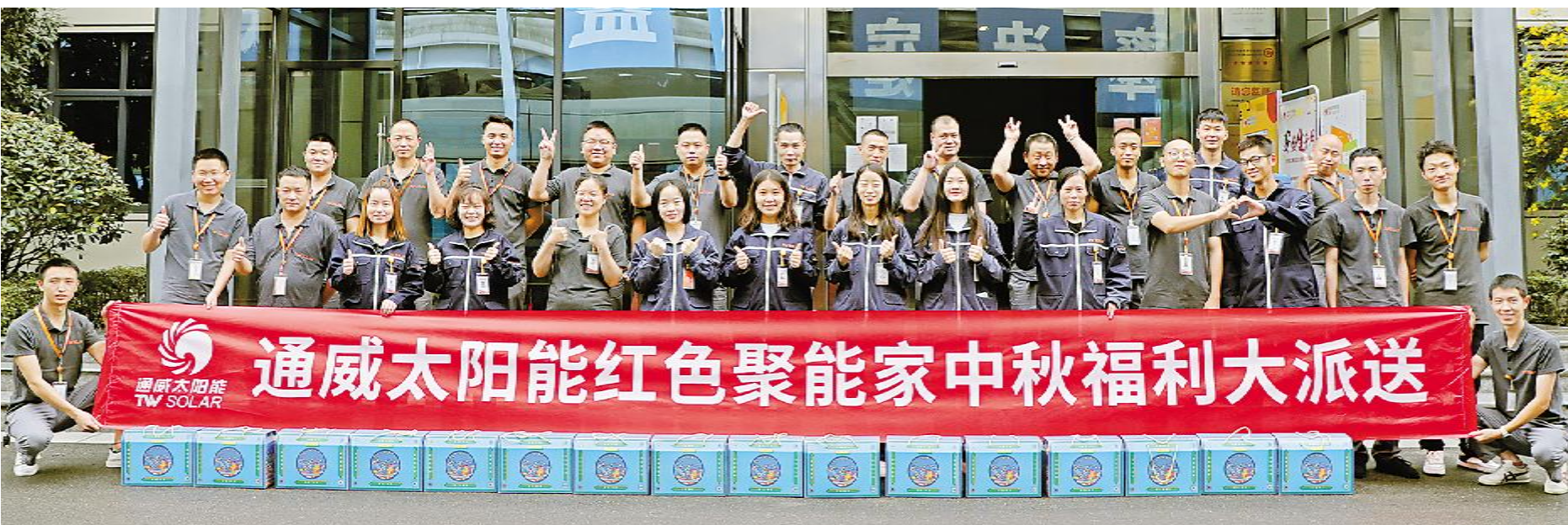
花式点赞比心,祝福中秋快乐

10 月 11 日—13 日,通威太阳能合肥、双流、眉山、金堂基地组织开展了第四季度红色观影主题活动,各基地党员共计 140 余人参与观看革命历史题材影片《长津湖》,从影片中汲取力量。通威太阳能将持续深化党史教育工作,将党史教育与各项工作紧密结合,传承红色基因,激发奋斗精神,把活动成效转化为敬业爱岗、勇担使命的强大精神动力,为经济社会的高质量发展贡献更多通威力量。