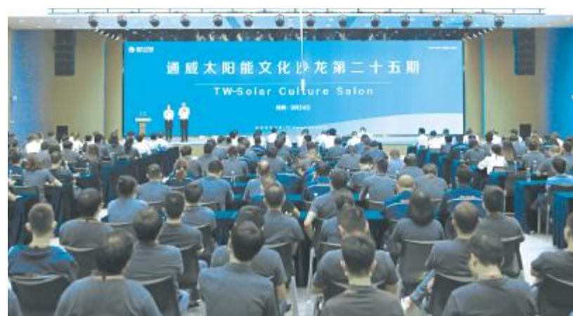
第二十五期文化沙龙暨质量月主题演讲比赛总决赛现场