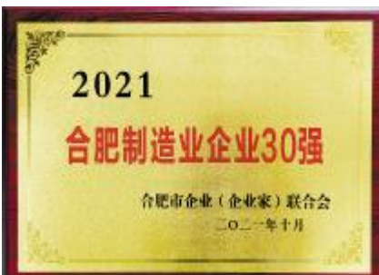
通威太阳能合肥基地荣列 2021 合肥制造业企业 30 强