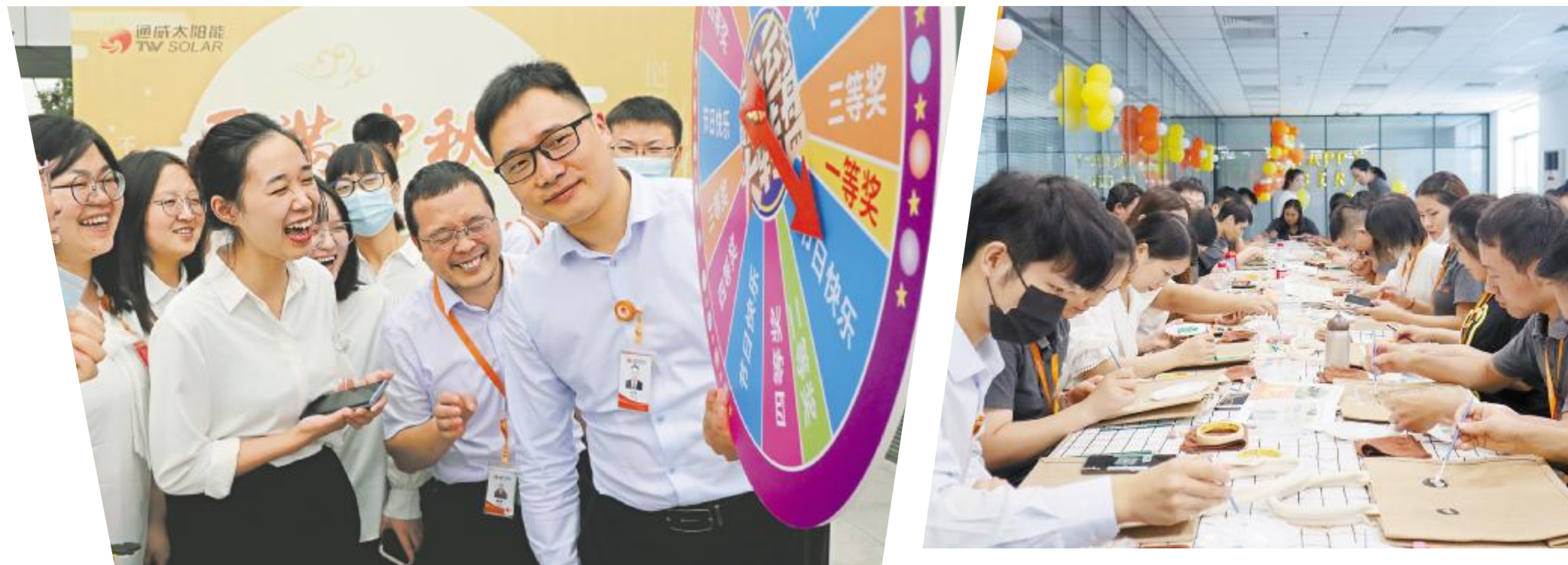
通威太阳能第三季度员工生日会开展丰富多彩的活动