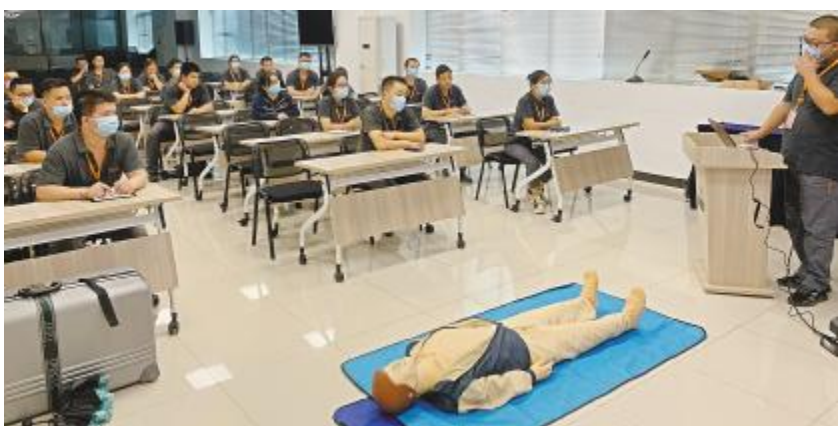
合肥基地开展海姆立克急救法及心肺复苏术培训讲座

金堂基地组织开展了 8 月安委会月度会议,会议公示了公司安全环保绩效目标达成情况、公司污染物排放达标情况、职业健康检查结果、安全检查完成情况、隐患排查整改情况、疫情管控要求及公司员工疫苗接种完成率等信息。在安全管理中要深入挖掘事故原因,结合公司生产现场实际情况,全方位全面排查,消除事故隐患。同时,要不断提升全员安全意识,营造积极向上的企业安全文化氛围,以法律法规为基准,落实各项安全事务,强化安全管理基础。