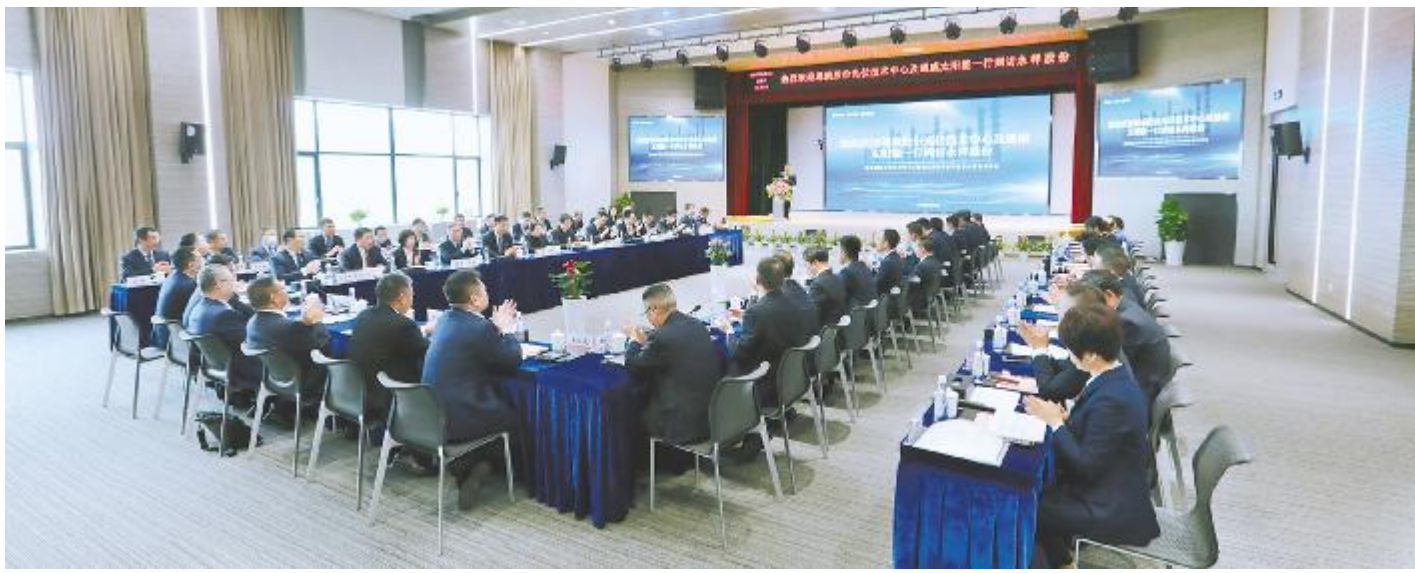
对标学习交流活动座谈会现场

为了在对标中找差距、寻突破,在化危为机中赢得主动,在攻坚克难中焕发新机,通威太阳能与永祥股份开展对标学习交流活动,汲取推广兄弟公司优秀经验,持续驱动企业发展内生动力,增强团队向心力、凝聚力,激发高质量发展新动能。