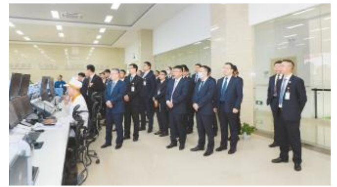
参观永祥中心控制室

市场行情波诡云谲,行业发展日新月异,惟改革者进,惟创新者强,惟改革创新者胜。此次对标学习是通威太阳能“拥抱危机”企业文化核心理念的落地实践,是面对企业新发展阶段提出新发展要求的积极探索,总结借鉴兄弟公司优秀发展经验,内化为企业发展动力,更好地破解发展难题,在竞争激烈的行业内继续勇立潮头、攻坚克难、开拓前行。