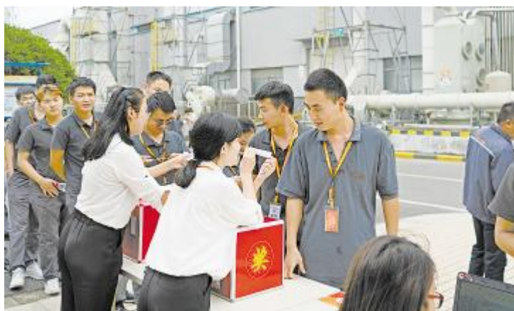
质量知识竞赛活动,员工踊跃答题赢礼品