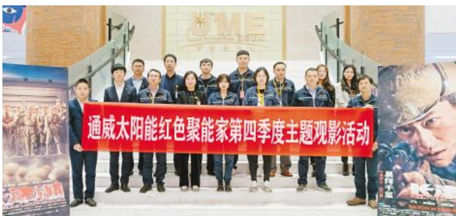
第四季度红色观影活动合肥基地合影留念