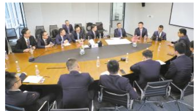
降本增效组内研讨