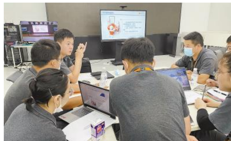
内训师培训现场,学员积极交流讨论