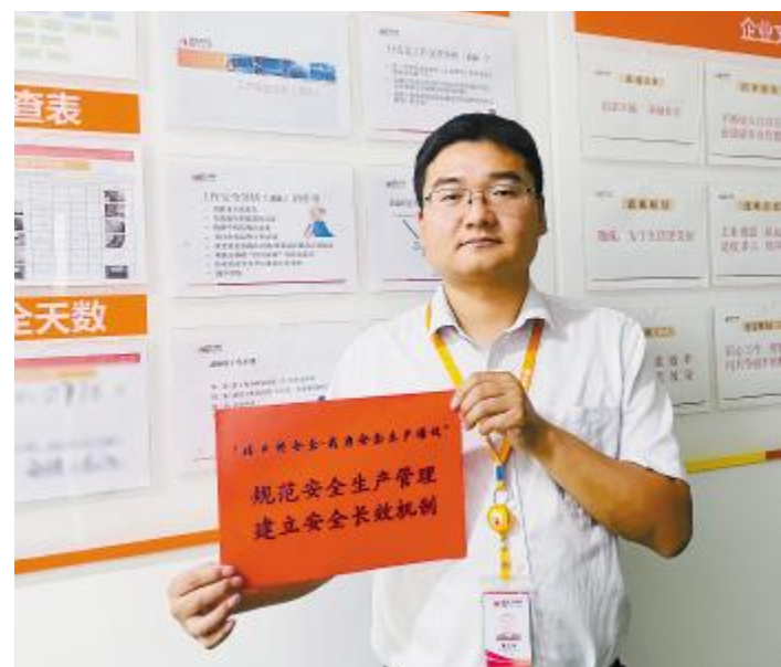
“21 天安全环保行为养成记”活动,员工打卡