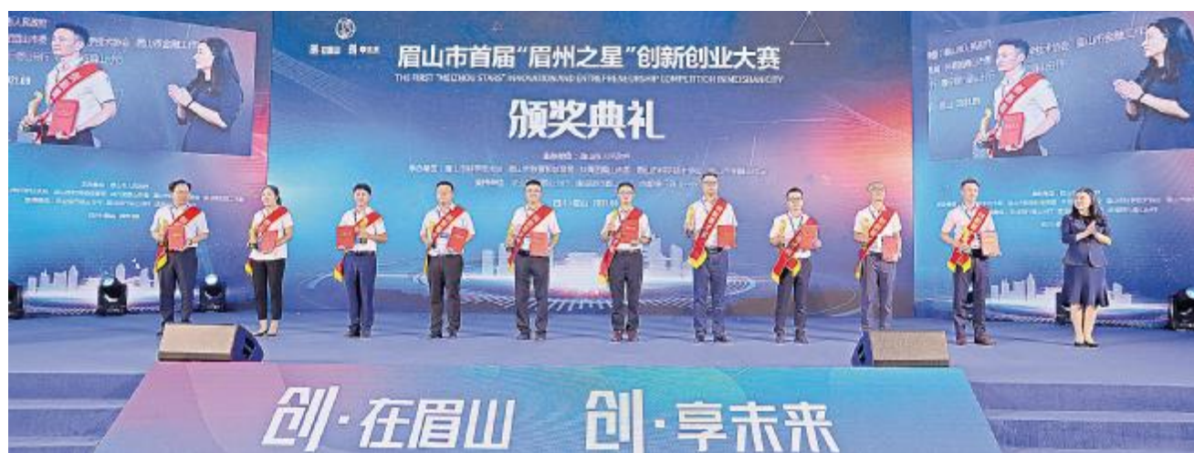
眉山基地荣获“眉州创新菁才”“眉州创新领军企业”两项大奖