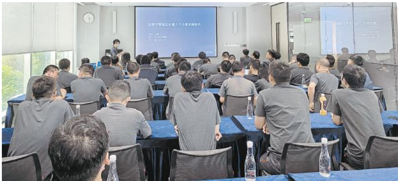
技术案例沙龙双流基地活动现场