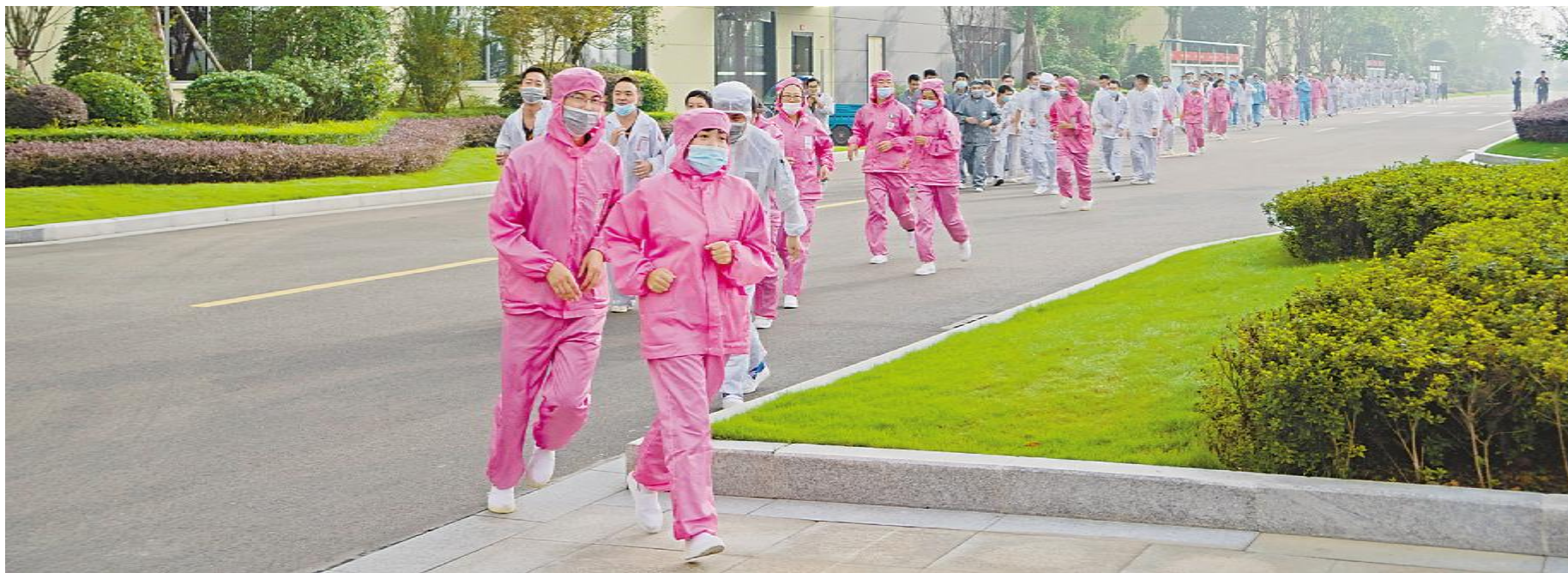
眉山基地开展消防疏散综合应急演练