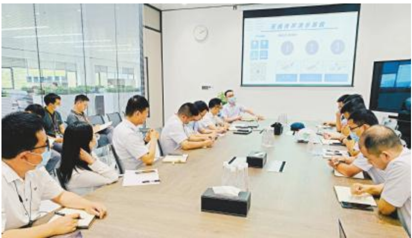
金堂基地组织开展安委会月度会议