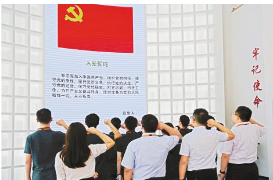
红色研学活动中,双流基地党员重温入党誓词

小小的生日会凝聚着公司对员工的关怀,也是对努力付出的奋斗者给予的肯定和感谢,一直以来,通威太阳能致力于塑造优良的企业文化,营造温馨舒适的工作环境。未来也将继续积极开展形式多样、内涵广泛的活动,进一步增进员工间的互动与交流,让每一位员工都能感受到家的温暖。