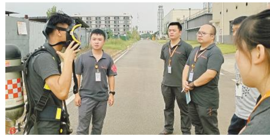
双流基地 ERT 应急处置实操演练现场,SCBA 使用演练