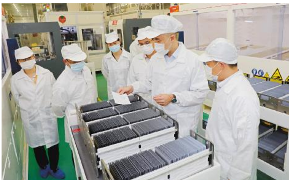
高管团队在双流基地电池车间了解节日期间生产情况

同时,通威太阳能组织开展“月满中秋 情满通威”主题活动,每个主题活动的摊位前都排着长龙,活动现场十分火爆,节日氛围拉满,赢得游戏的欢呼声此起彼伏,到处洋溢着欢声笑语。此外,通威太阳能还开展了“共筑光伏梦·守护中秋月”主题发声活动,号召社会公众一起为环保发声。此次中秋系列活动的开展,为构筑公司和谐大家庭、提升团队凝聚力发挥积极作用,为优秀传统文化传承和守护唱响了通威声音,为助力国家“2030 年碳达峰,2060 年碳中和”目标的实现贡献了通威力量。