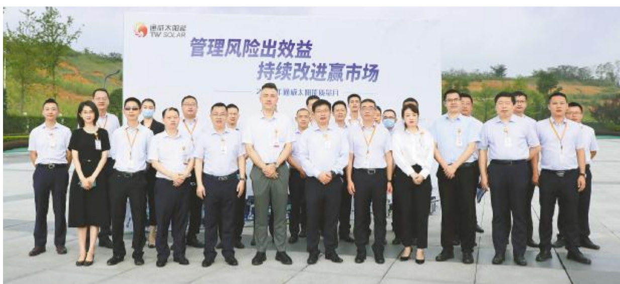
通威太阳能 2021 年质量月双流基地启动仪式现场

9月26日,通威太阳能2021年第三季度TQM评审会在合肥、双流、眉山三地举行。本季度参评项目共计398项,其中合理化建议361项,TQM改进项目37项,经财务核算年收益约1.50亿元。本次TQM项目覆盖面广泛,包含了新材料应用、工艺优化、备品备件维修改善、包装优化改善、化学品降耗改善等。会上,各汇报人分别从选题背景、现状调查、目标设定、项目计划、要因分析、实施对策、效果确认等方面向评委们展示了各自的项目,展现了通威人勤奋钻研、积极进取的风貌。过程中,评委们对项目进行了专业的点评和打分,并对各汇报人持续改进的工作态度给予肯定和鼓励。