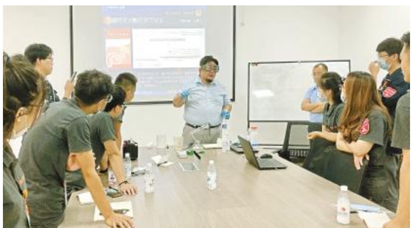
双流基地开展应急物资使用专项培训