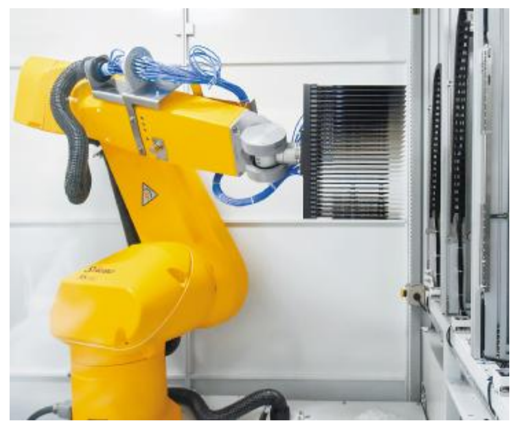
通威太阳能智能制造生产线

和企业总体盈利能力,秉承“追求卓越,奉献社会”的企业宗旨,为加快建设新阶段现代化美好安徽做出更大贡献。在首届“眉州之星”创新创业大赛颁奖大会上,通威太阳能眉山基地荣获“眉州创新菁才”、“眉州创新领军企业”两项大奖。本次创新创业大赛自6月正式启动,以“创·在眉山,创·享未来”为主题,为创新创业者提供展示创意、挥洒热情、驰骋赛场、追求荣耀的舞台,历时近3个月,共计240个项目报名参赛,经过激烈角逐和层层选拔,66个优秀项目脱颖而出,决赛获奖企业将择优入围中国创新创业大赛四川赛区决赛。