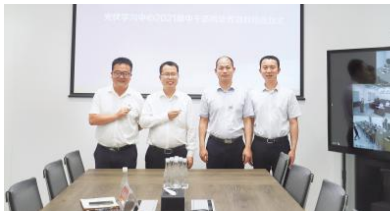
中干适岗培养项目结业仪式金堂基地合影

案例分享结束后,针对5W2H、鱼骨图、5WHY法等创新思维工具在案例中的应用,在场的学员还展开了热烈的讨论。