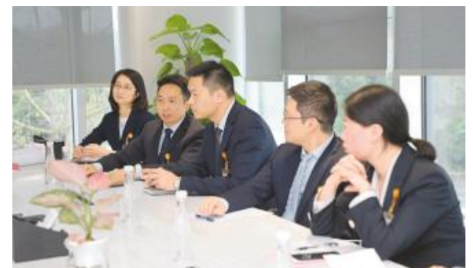
团队建设组内研讨